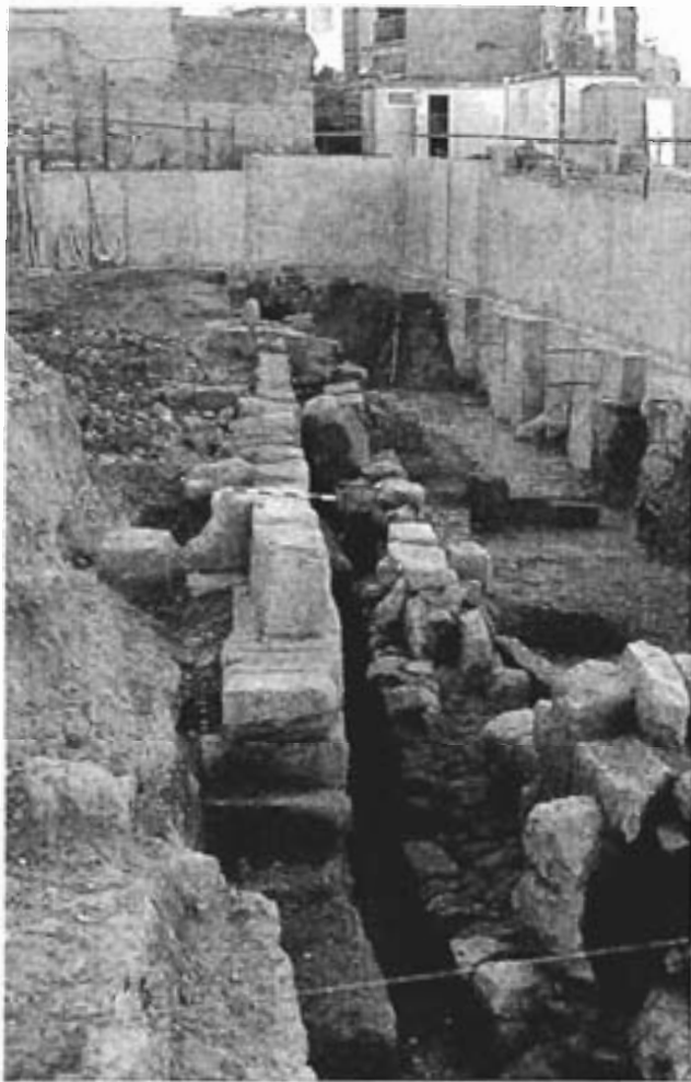
Fig. 1. Acequia antigua en solar de Lavaderos.

Durante las excavaciones se localizaron en ambos solares trazas de una acequia, ubicada en el