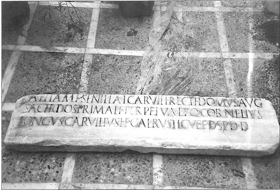
Lám. I. Inscripción romana de Baeza.

A continuación se constata otro personaje llamado Quinto Cornelio Longo, siguiéndole un Carvilio Rústico, perteneciente a la tribu Galería. Estos dos nombres hacen referencia a una sola persona, estaríamos pues ante un caso de doble filiación en la que dicho individuo sería el hijo adoptivo de L. Carvilio Recto, fruto de un anterior matrimonio de Aelia Senilla con un tal Rústico.