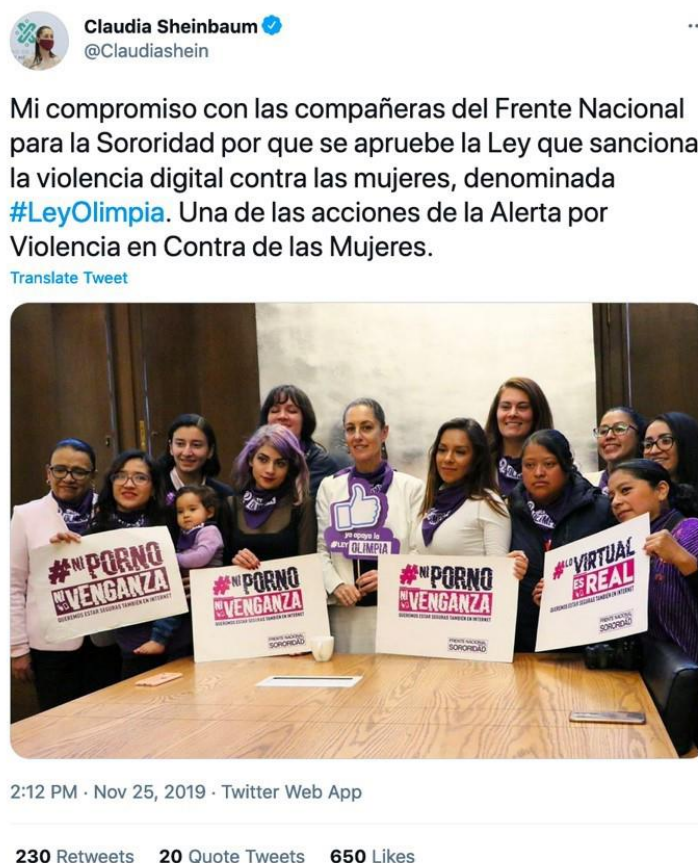
Imagen 3. Tuit Mi compromiso con las compañeras del Frente Nacional para la Sororidad

longitudinalmente en las redes durante 2019 y 2020 hasta aparecer como una reivindicación en la coyuntura del 8m 2021.