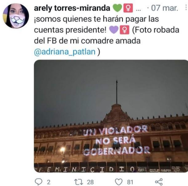
Imagen 5. Tuit #UnVioladorNoSeráGobernador

Resultó llamativa la interpelación al partido en el poder por parte de las activistas, que reafirmó la conformación del feminismo como un bloque no complaciente con el gobierno en turno, como en otros sexenios, geografías y contextos, independientemente de su filiación partidista. En este sentido, destacó la intervención en Palacio Nacional como una clara acción tecnopolítica a partir de la proyección de la frase “Un violador no será gobernador” en el edificio que alberga el máximo poder político en México (imagen 5).