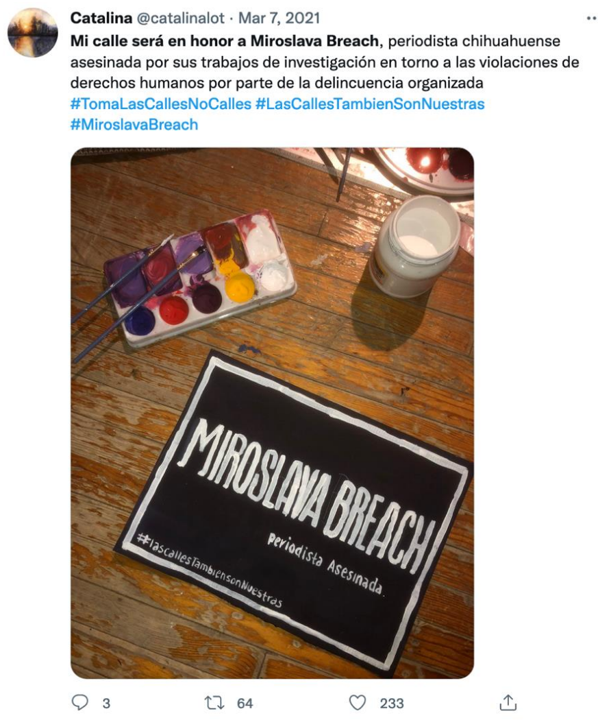
Imagen 6. Tuit Mi calle será en honor a Miroslava Breach

Lo relevante de la acción era generar una representación de apropiación y resignificación. De acuerdo con Rovira (2013), esta es una manera de nueva visibilidad, que es una forma de poder simbólico, pues configura la percepción de realidad. Según Butler (2010), las imágenes estructuran a su vez la manera como registramos la realidad, por lo que están estrechamente vinculadas con el escenario interpretativo en el que operamos.