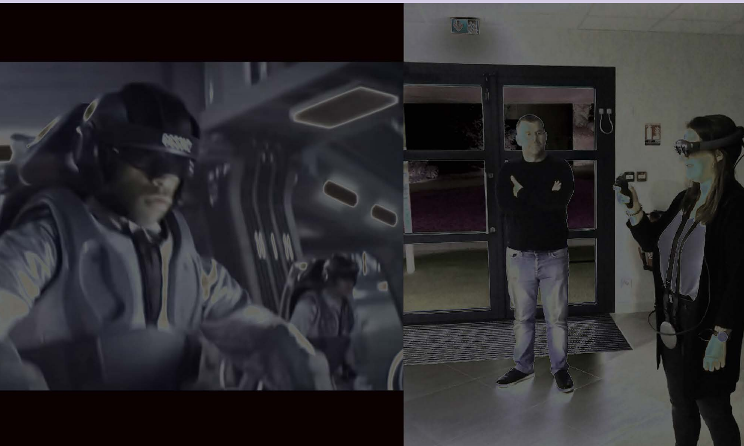
Figura 0 De la película Ready Player One . Fuente: Spielberg (2016) y experiencia con realidad mixta dentro del Centro de Realidad Virtual de Brest, Francia. Fuente: Elaboración de la autora.