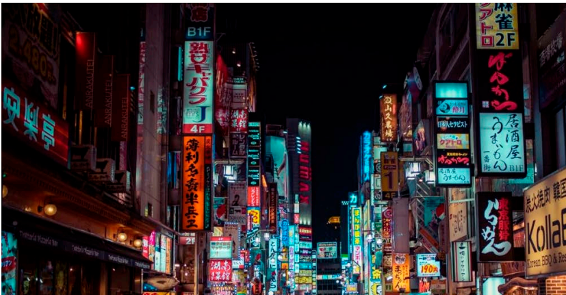
Figura 5. La ciudad como escaparate ciudad SHINJUKU (2021).