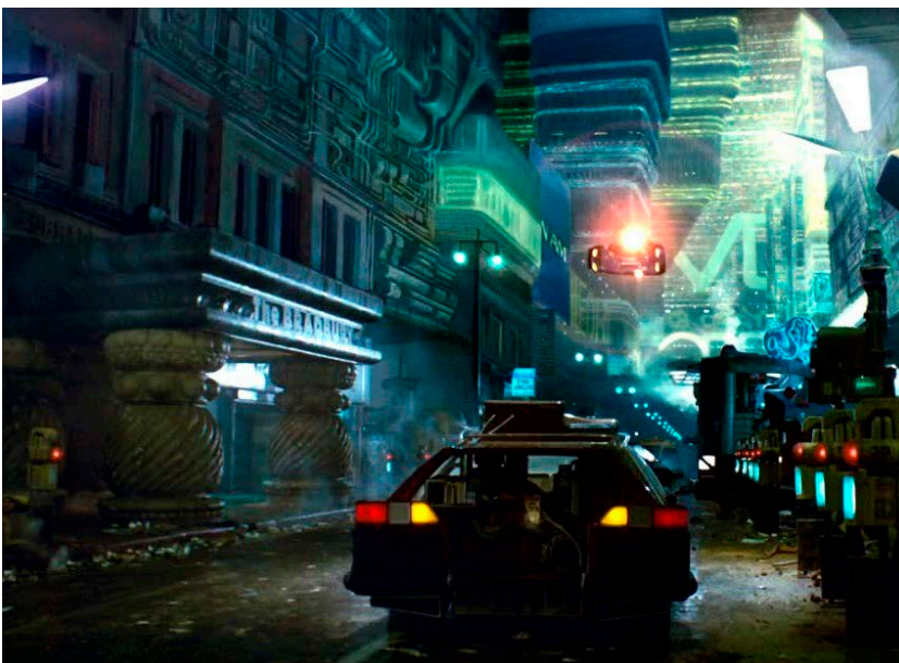
Figura 6. La ciudad en la película Blade Runner . Fuente: Scott (1982).