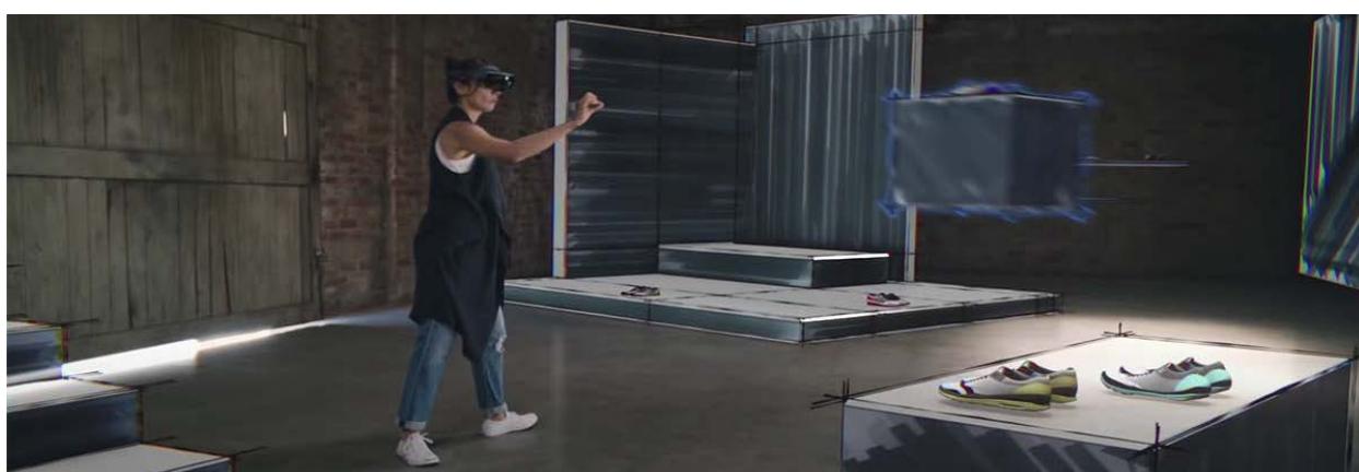
Figura 1 Experiencia con realidad virtual dentro del CAVE en el Centro de Realidad Virtual de Brest, Francia.