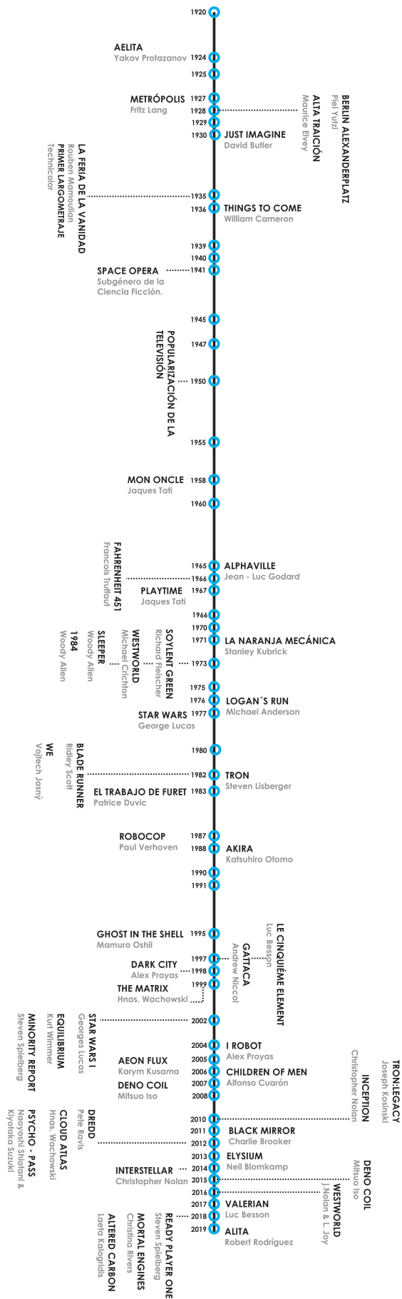
Figura 3 Línea del tiempo Cine + Literatura.