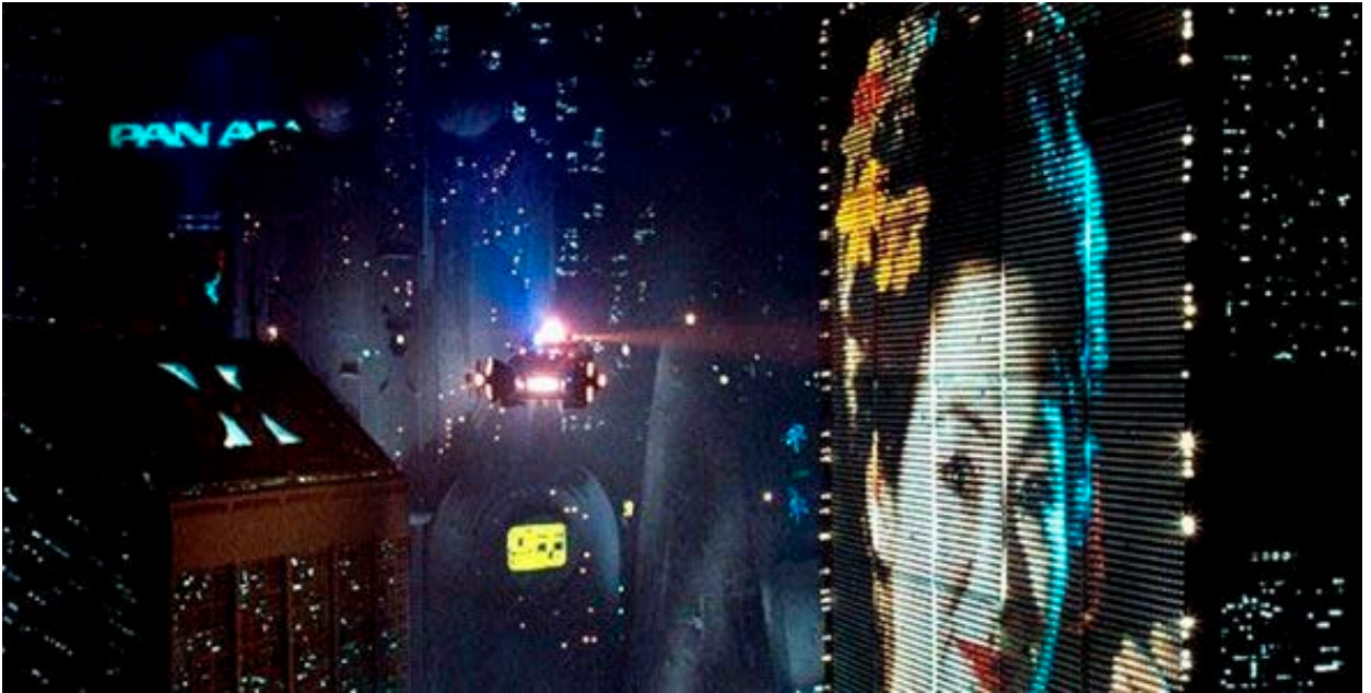
Figura 4. La ciudad como escaparate en Blade Runner (1982).