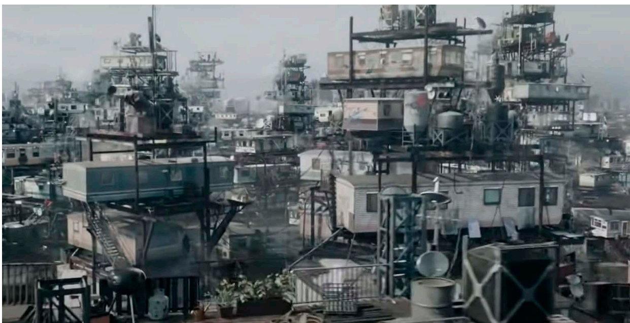
Figura 7 Las torres de la película Ready Player One . Fuente: Spielberg (2016).