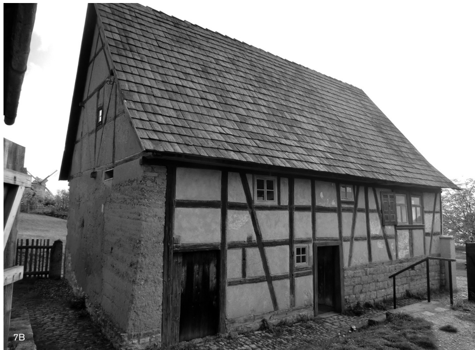
Figuras 7A y 7B: Vivienda con fachada lateral de pared de mano y fachada principal de entramado con encestado.