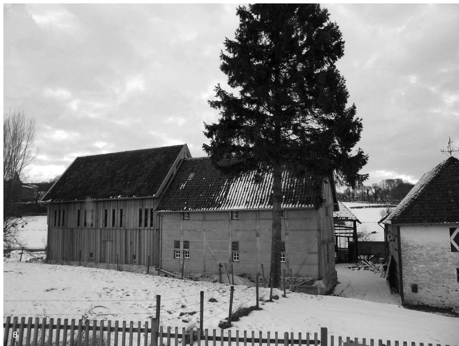
Figura 8: Viviendas tradicionales rurales en Países Bajos.