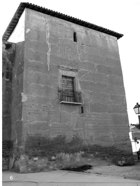
Figura 6: Intervención en vivienda de tapia, Castilla y León, España.