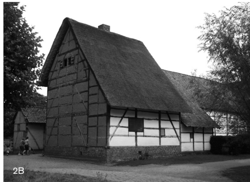
Figuras 2A y 2B: Técnica mixta de encestado integrado en estructura de madera, Museo de Bokrijk, Bélgica.