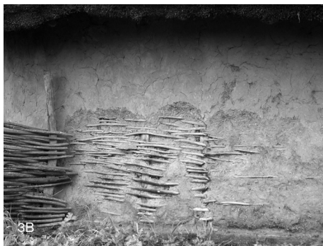
Figuras 3A y 3B: Encestado en viviendas tradicionales, Museo de Bokrijk, Bélgica.