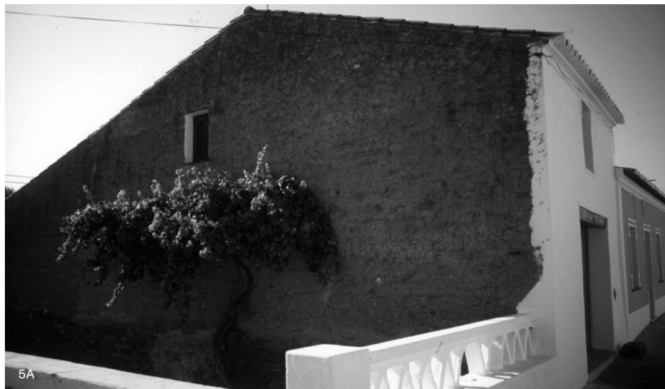
Figura 5A: Vivienda tradicional de tapia, en Telheiro, Reguengos de Monsaraz, Portugal. Fuente: (Correia, 1999).