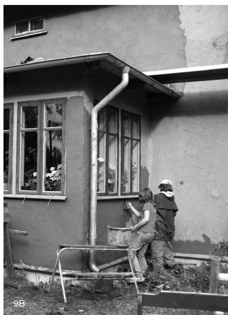
Figuras 9A y 9B: Oficina con revoque de tierra, en Vekhyttan, Suecia. Fuente: (Correia, 2010).