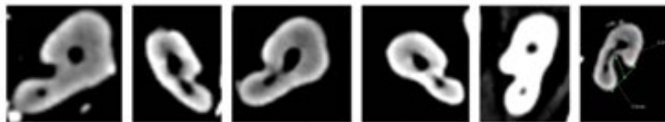
Figura 3. SR vistos en corte axial CBCT.