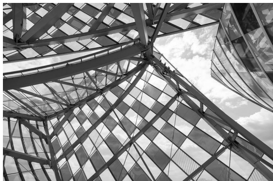
Figura 4. Módulo rectangular de la trama.

El motivo que se puede observar en el museo de la Fondation Louis Vuitton constituye una figura rectangular. Es la parte elemental de la organización simétrica y su aplicación se rige por las leyes u operaciones de simetría. Las mismas se refieren a la identidad o representación del objeto sobre sí mismo sin ninguna variación, la reflexión especular o retrato bilateral donde se invierten los lados, la traslación o corrimiento del motivo sobre un órgano recto denominado eje de traslación, la rotación o giro del motivo alrededor de un eje de rotación y la extensión o variación multiplicada del motivo pero que permanece semejante a sí mismo (Figura 4).