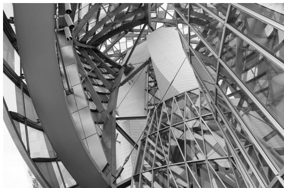
Figura 5. Trama visual desde el interior.

La exageración en tamaño y forma se percibe en la morfología propiamente dicha de las velas arquitectónicas que componen el museo. Es una exageración visualmente efectiva, extravagante y atractiva ya que las mismas se pueden visualizar desde lejos intensificando las sensaciones y emociones del visitante. La profundidad en estos volúmenes, regida por el uso de la perspectiva se ve reforzada por las luces y las sombras sugiriendo una apariencia natural al museo en el emplazamiento donde se encuentra ubicado (Figura 5).