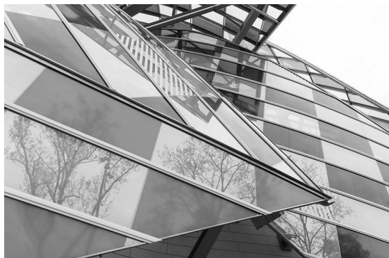
Figura 6. Trama con aplicación de color.

El artista trabajó cubriendo con filtros de colores translúcidos los diversos módulos de trama que recubren las doce velas o volúmenes del edificio y que poseen 3600 piezas de vidrio creando, de este modo, un efecto caleidoscópico. Los colores seleccionados fueron trece y se aplicaron en forma de tablero de ajedrez en todas las fachadas otorgando un efecto óptico en constante cambio. Desde el exterior, estos paneles recogen tonalidades y texturas del entorno adaptándose a las horas del día y época del año creando una experiencia multidimensional.