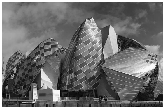
Figura 3. Trama aplicada en arquitectura exterior.

museo de la Fondation Louis Vuitton desde otra perspectiva. En su arquitectura espacial, las conformaciones o particiones del espacio denominados motivos o módulos dan lugar a tramas espaciales que son percibidas por el público como una tridimensionalidad ya que están aplicadas a los volúmenes de vidrio que componen la arquitectura de este edificio (Figura 3).