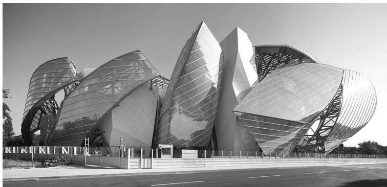
Figura 1. Museo de la Fondation Louis Vuitton.

Considerado un edificio singular, insólito y emblemático, creado por un arquitecto innovador, Frank Gehry, este museo se encuentra a la altura del Centro Pompidou en París o del Museo Guggenheim de Bilbao, entre otros. El auge económico, cultural y tecnológico de estas obras dejan su impronta en la imagen del país, contribuyendo a la señalética corporativa. De este modo, la identidad de la empresa Louis Vuitton forma parte de la ciudad de París reforzando su imagen frente al mundo (Figura 1).