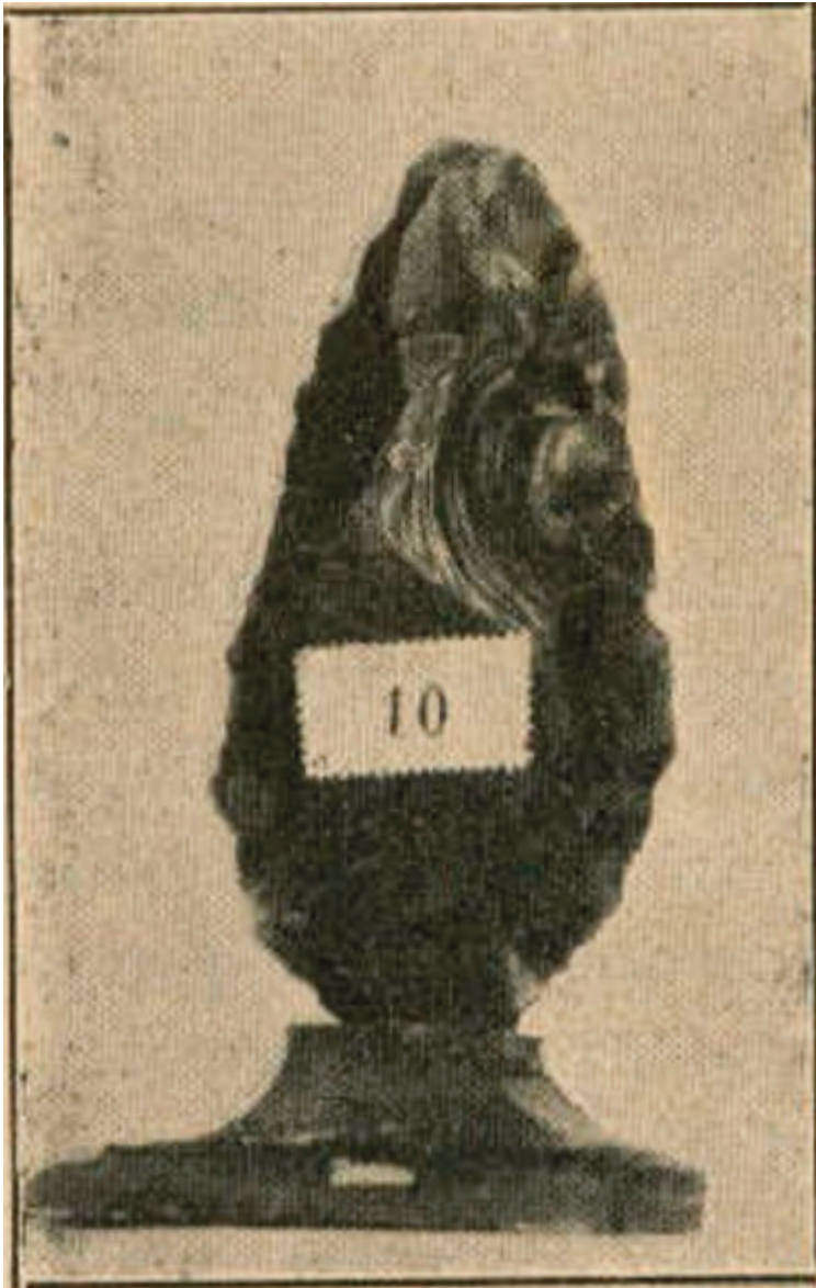
Fotografia de la destal publicada en el llibre d'A. M. Gibert (1909).