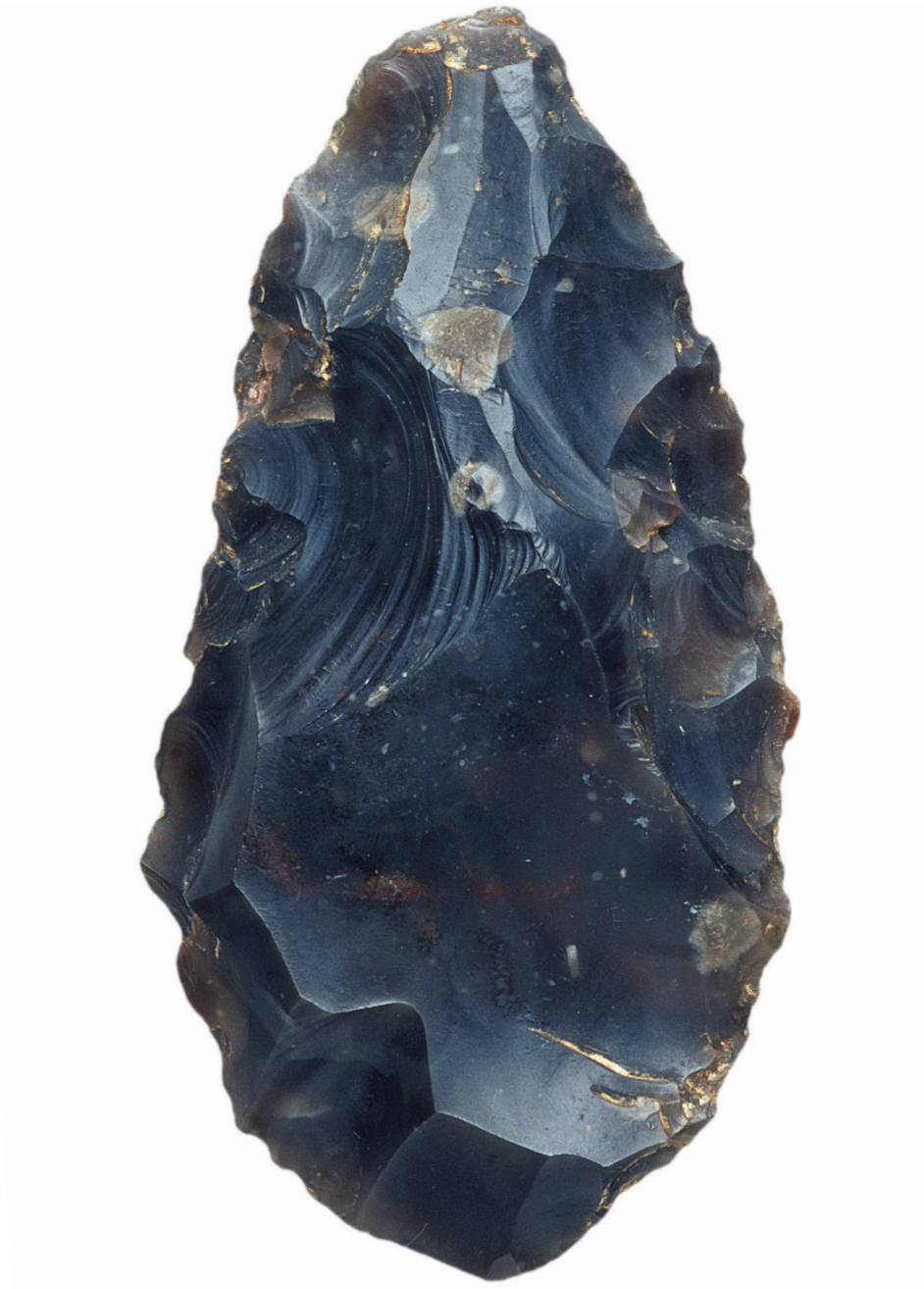
La destal de sílex negre conservada al Museu Nacional Arqueològic de Tarragona.