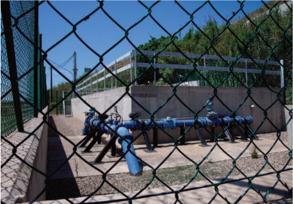
Centre de distribució de la mina de la Protectora i la mina de la Ferrerota.