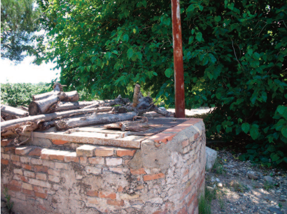
El pou on s'acopla la mina de la Ferrerota amb la mina de la Protectora.

A ran de la decisió d'aquests quatre pagesos d'exigir un pou obert per treure l'aigua per regar la finca, els promotors de la mina van modificar sobre la marxa el projecte inicial i ja ningú més va poder fer aquesta demanda.