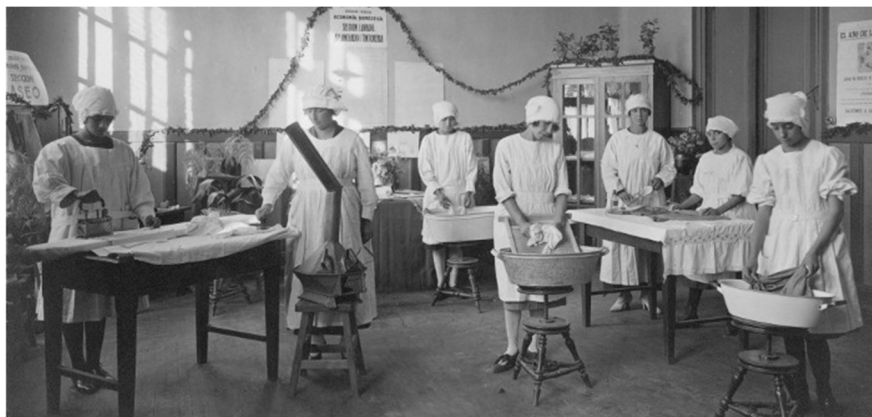
Fig.5. Alumnas en clase de Puericultura y Educación para el Hogar. Escuela Vocacional de la República. 1926

«Los cursos de economía doméstica y educación para el hogar en la educación femenina. Chile 1920-1960». HYBRIS. Revista de Filosofía, Vol. 12 N° 2. ISSN 0718-8382, noviembre 2021, pp. 193-222