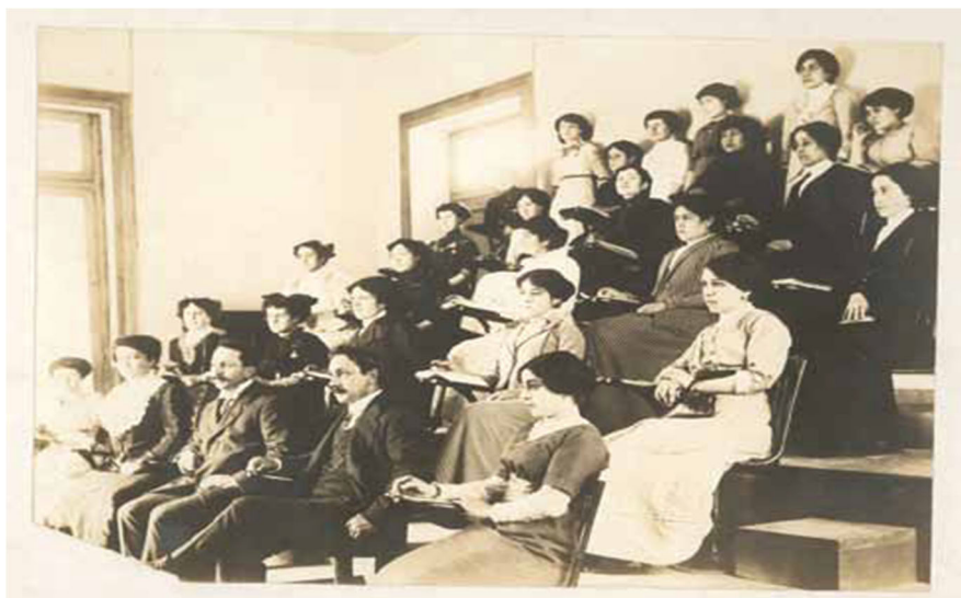
Fig.2. Alumnos y alumnas de Economía Doméstica en clase de Higiene, Instituto Superior de Educación Física y Trabajos Manuales. 1912.

Si bien el Estado señala desde 1910 la incorporación del curso de Economía Doméstica en los planteles educativos (Serrano, 20013) en 1928 el Ministerio de Educación Pública, aprueba los programas que serán aplicados a partir del año 1929 bajo el Gobierno de Carlos Ibáñez del Campo. El decreto correspondiente señala incluir dentro de la educación primaria y a partir del cuarto año un programa de labores femeninas, enfocado en el aprendizaje de técnicas de costura y tejido destinado a la confección de vestuario. Si bien este curso apuntaba a entregar herramientas útiles como medio de trabajo, principalmente interesaba inculcar estas técnicas en las futuras dueñas de casa. Tal como señala el decreto en la descripción del programa: