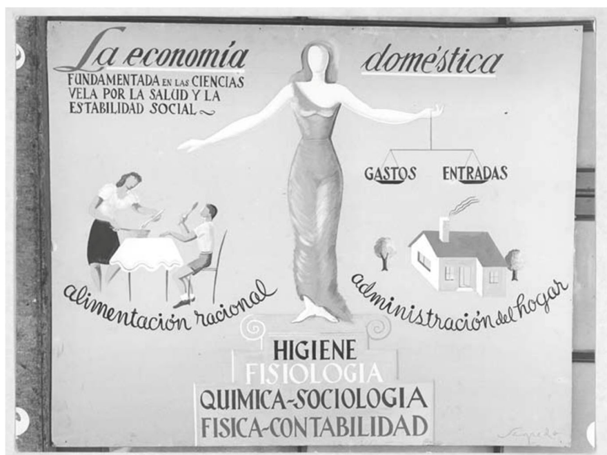
Fig. 6. Economía Doméstica, lámina de la Exposición Retrospectiva de la Enseñanza.