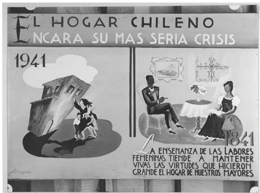
Fig. 8. Economía Doméstica, lámina de la Exposición Retrospectiva de la Enseñanza.

La unidad dedicada a la contabilidad doméstica constituye uno de los puntos que cobra mayor relevancia a lo largo del tiempo, en la medida que la formación de las dueñas de casa se va especializando. Durante el Gobierno Gabriel González Videla se emprende una campaña relacionada con el consumo, la que indica que la que la dueña de casa debe ser instruida en los preceptos básicos de la economía, sobre todo en relación con el ahorro. En otras palabras, debía ser una buena administradora del hogar lo que en ese momento implicaba gastar lo menos posible. Sin embargo, cabe destacar que este ímpetu de instruir a la mujer en aspectos relativos a la racionalidad económica constituye uno de los elementos centrales de la economía doméstica en sus orígenes, como podemos ver en la Fig. 6, que ilustra gráficamente el rol del hogar en contextos de crisis económicas o sociales.