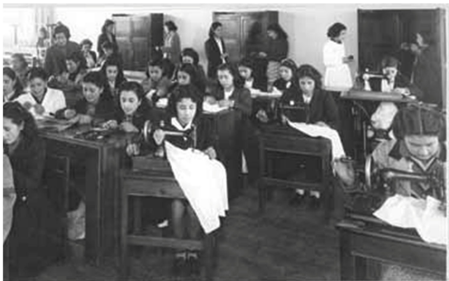
Fig. 3. Alumnas de Economía Doméstica en clase de Higiene, Instituto Superior de Educación Física y Trabajos Manuales. 1912.

De manera paralela se propone un curso de economía doméstica que constaba de tres ejes centrales. Un primer eje dedicado a la adquisición de conocimientos relacionados con la preparación de los alimentos y el manejo general de la cocina y sus artefactos. Un segundo destinado a la higiene y a la puericultura y un tercero dedicado a la contabilidad doméstica. Sin embargo, cabe mencionar un cuarto eje que se relaciona con la formación ética relativa con el conjunto de saberes y conocimientos que de modo paralelo a la formación práctica que se desprende de los tres ejes anteriores se instala en el campo del adoctrinamiento disciplinario moral que debe sustentar y transmitir la mujer en el contexto hogareño.