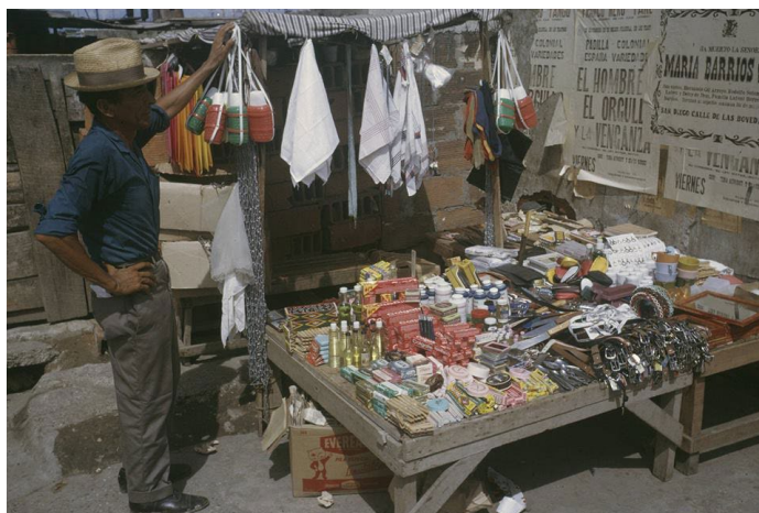
Autor: Danny Lyon.

Vendedor ambulante en el mercado público de Getsemaní, 1969. Nótese el cartel que promueve la película “El hombre, el orgullo y la venganza” western protagonizado por Franco Nero.