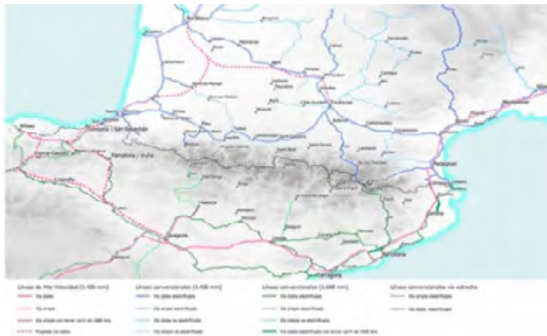
Red ferroviaria en el área pirenaica.