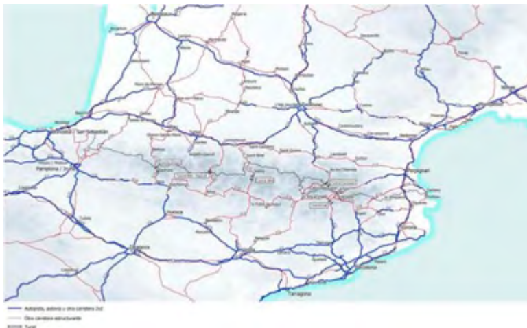
Red estructurante de carreteras en la zona pirenaica (2018).

Infraestructura lineal en los pasos fronterizos de España