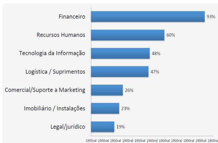
Gráfico 1: As principais funções conduzidas por Centros de Serviços Compartilhados relativos a sete áreas