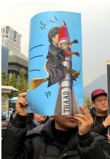
Imagen 1. Cartel de protesta en las demostraciones exigiendo la destitución de la presidenta Park Geun-Hye