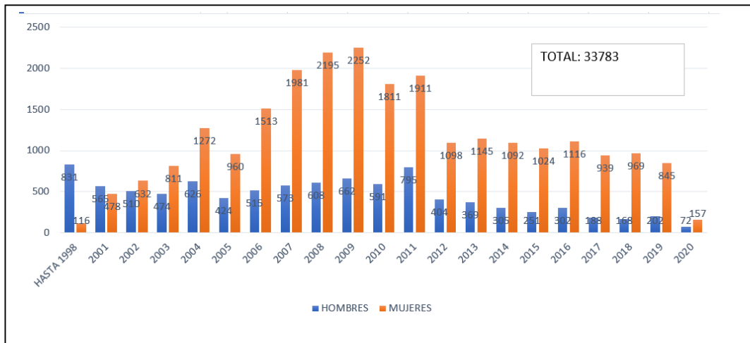
Cuadro 3. Cantidad de desertores que ingresaron a Corea del Sur, 1998-2020

Fuente: Elaboración propia en base a datos del Ministerio de Unificación de Corea del Sur (hasta diciembre 2020)