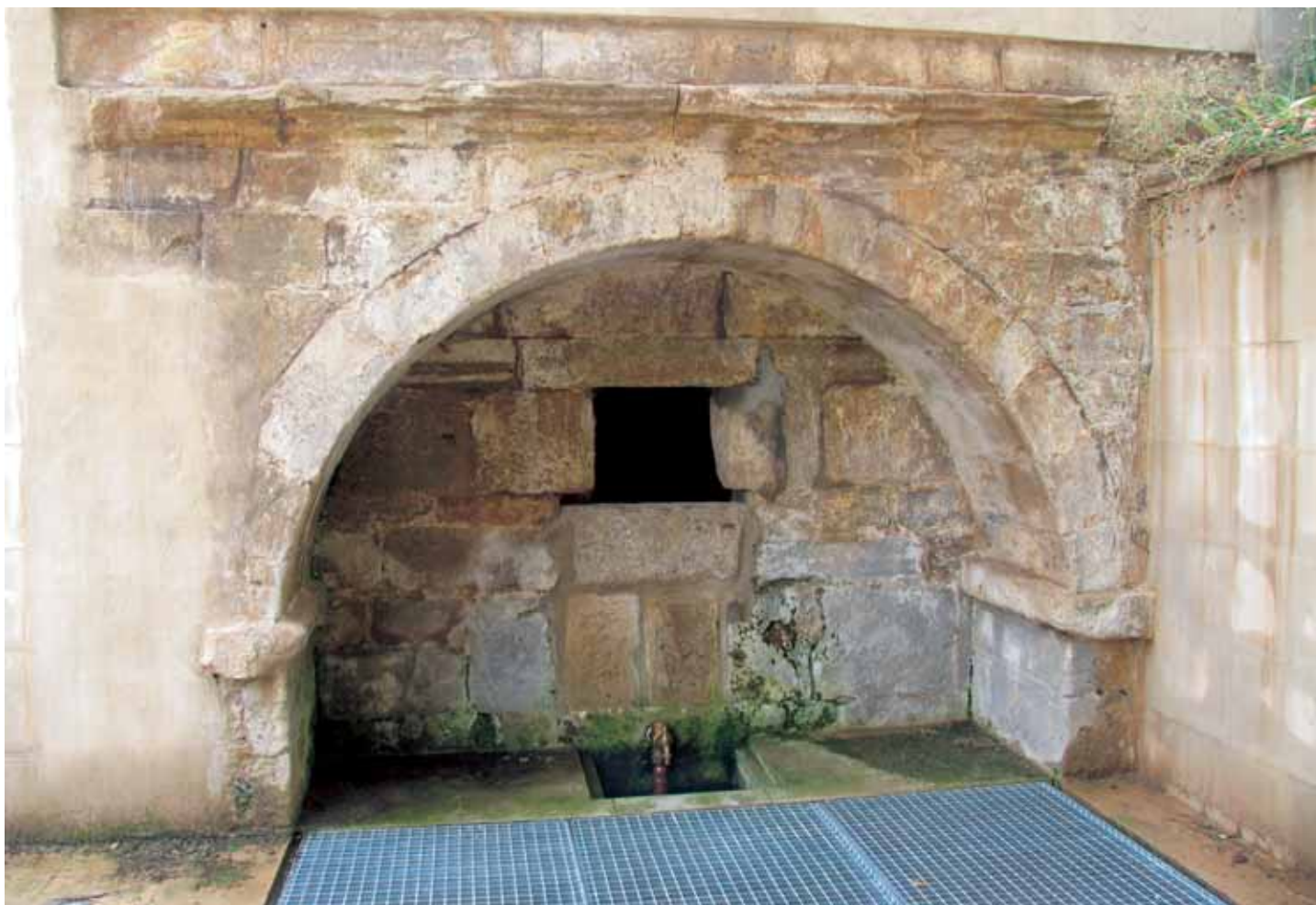
Exterior de la fuente

advocado al otro santo del que se tenían reliquias, San Bartolomé.