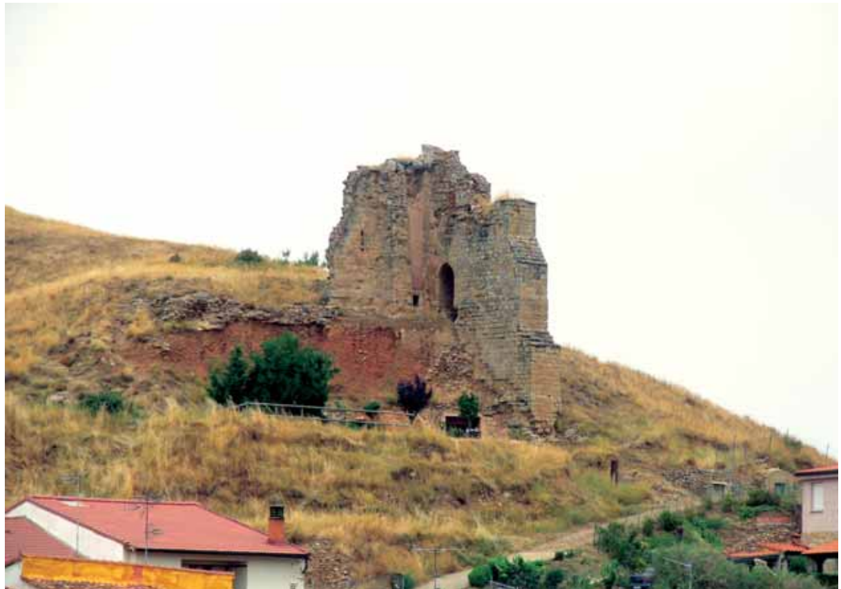
Enclave de las ruinas de la ermita de Santa María o iglesia del castillo