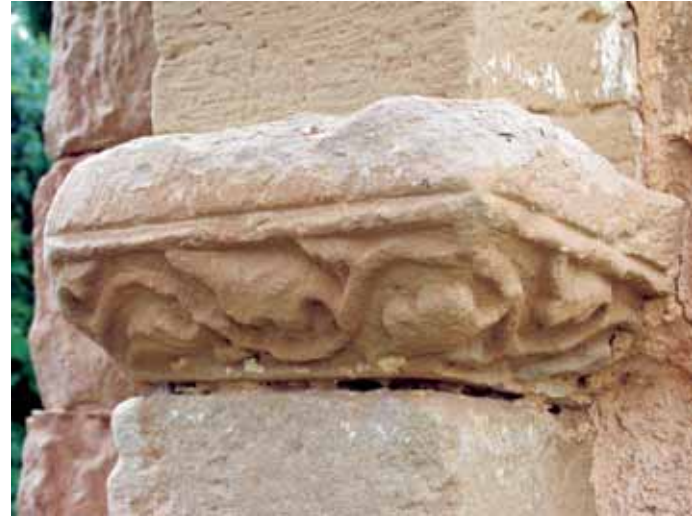
Imposta de la jamba derecha de la portada norte