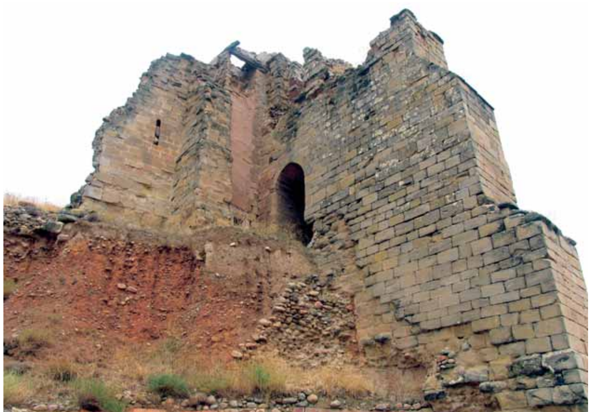
Ruinas de la ermita de Santa María desde el Suroeste