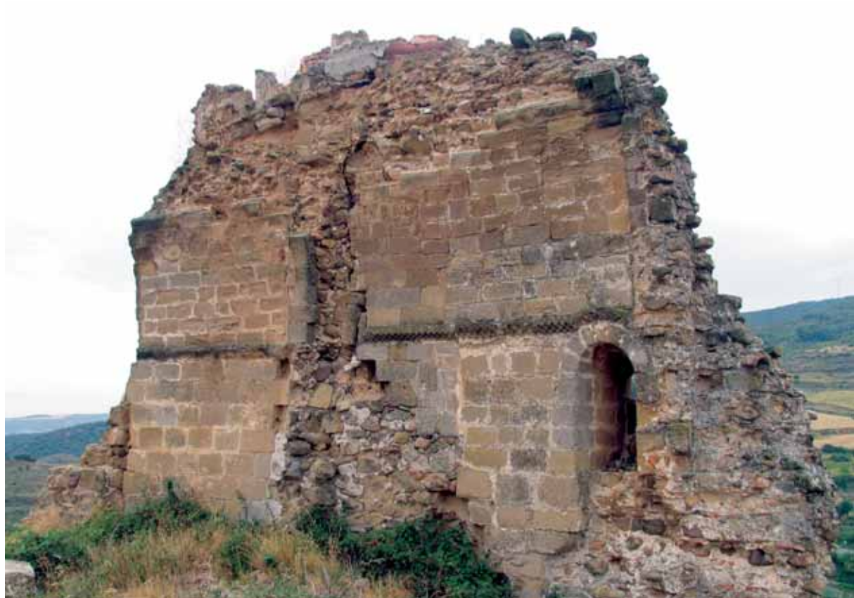
Ruinas desde el norte

sión del fuero de Ocón en 1174, siendo todos ellos reparados en el siglo XIX durante la Primera Guerra Carlista.