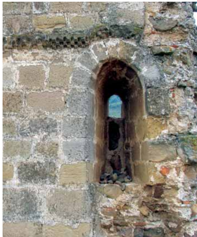
Detalle de la imposta y ventana del muro sur

La gran espadaña en sillería ejercía la función de contrafuerte, pues salvaba el desnivel del terreno, ya que la construcción se erige en un declive, justo al borde de una curva de nivel. En su parte inferior conserva un ingreso apuntado que posiblemente serviría de paso al cementerio y quizás también al castillo, y en su parte superior aún