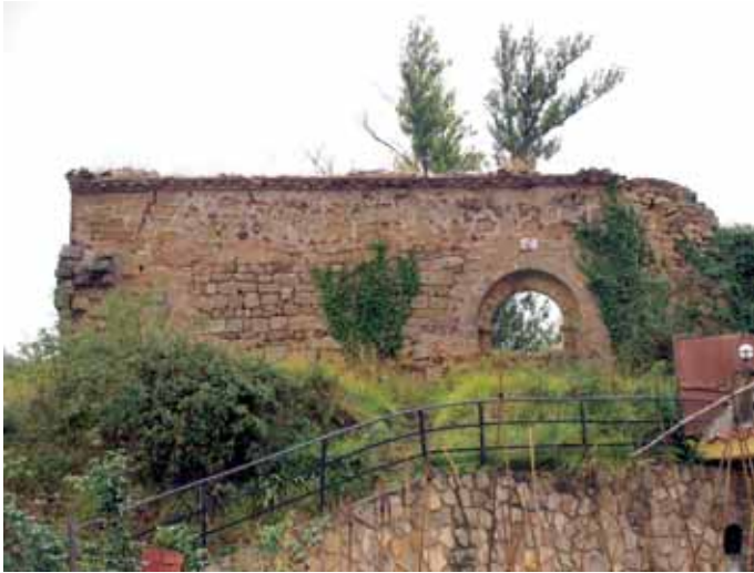
Exterior del lado norte