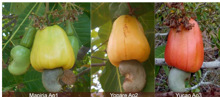
Figura 3. Clones de marañón: Corpoica Mapiria Ao1, Corpoica Yopare Ao2 y Corpoica Yucao Ao3; recomendados para su cultivo en la altillanura de Puerto Carreño, Vichada.