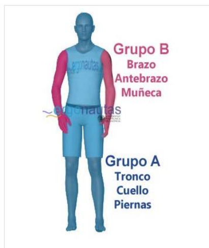
Figura 2. Grupo de Miembros REBA.

Método OWAS (Ovako Working Analysis System) para el método OWAS, se considera que este método se lo aplica por medio del levantamiento de datos en sitio por medio de la observación en las cuales se identifican 252 posibles posturas del cuerpo combinadas entre las siguientes zonas del cuerpo correspondiente a la cabeza, hombros, brazos, piernas y en relación al peso de la carga levantada al realizar la actividad de trabajo. Al momento de valorar por el método Owas cada postura es analizada y valorada bajo la asignación de una numeración por lo cual se procede a realizar una valoración asignando una categoría valorativa al riesgo localizado, en el método Owas existen 4 parámetros de valoración por cada riesgo de postura. Siendo esta la parte de contribución para la clasificación de los riesgos según la valoración obtenida por cada evento o trabajador evaluado por las diferentes zonas del cuerpo como son, espalda, cabeza, brazos y regiones inferiores o piernas. Por concluir el análisis de las posturas se establecen por categorías de riesgos las mismas que serán valoradas por le aplicación de cálculos establecidos en el método de las distintas partes del cuerpo con el objetivo de crear o establecer las medidas necesarias correctivas o preventiva (Bravo, 2019). El procedimiento para aplicar el método Owas según (Diego-Mas, 2015), puede resumirse en los siguientes pasos: