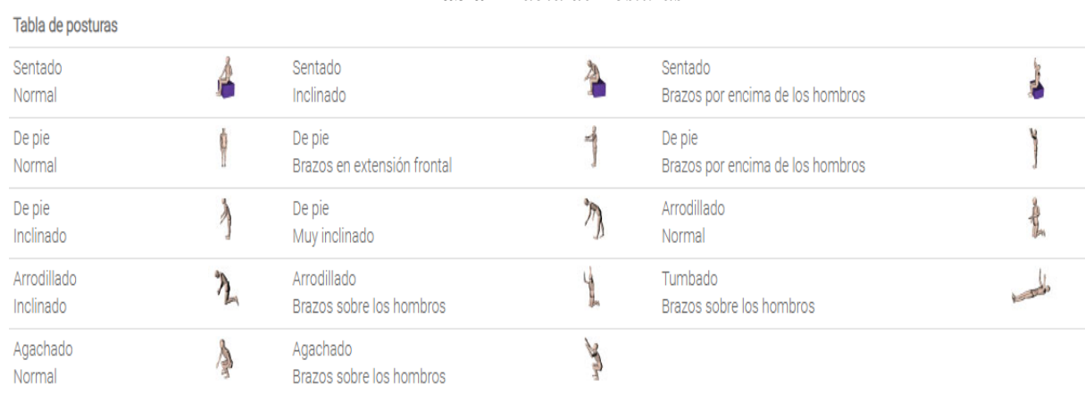
Tabla 2 Tabla de Posturas