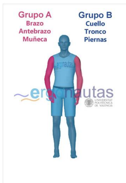
Figura 1. Grupo de Miembros RULA.

El procedimiento para aplicar el método RULA puede resumirse en los siguientes pasos: