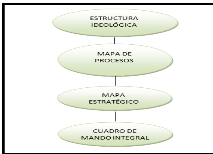
Gráfico 1 Modelo de la propuesta

Para la elaboración de la planificación estratégica de la Compañía de Transporte Pesado “Rutas Salcedences” S.A se basa en una estructura propia que se establece de acuerdo a las necesidades de la compañía donde se describirá la estructura ideológica, el mapa de procesos, el mapa estratégico y el cuadro del mando integral