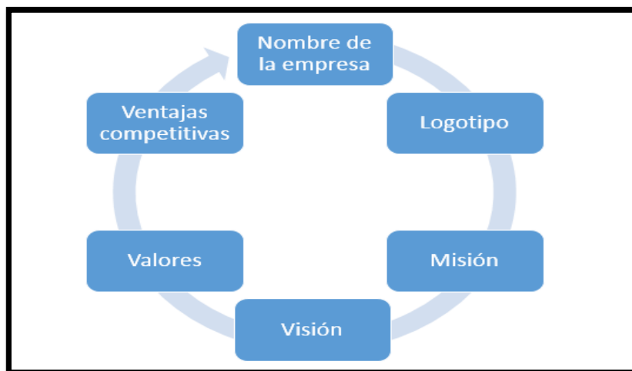
Gráfico 2 Modelo de la Estructura ideológica

En base a lo antes mencionado la estructura ideológica para la Compañía de Transporte Pesado “Rutas Salcedenses” S.A se realizará en base al gráfico 3 donde se detalla, el nombre de empresa, logotipo de la empresa, así como la misión, visión, valores y una descripción de las ventajas competitivas.