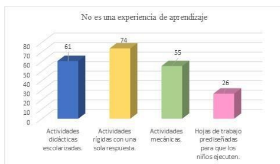
Figura. 2 Encuesta aplicada a docentes de los Centros de Desarrollo Infantil.

De los resultados de la encuesta se evidencia que el 95% de docentes dan importancia a los recursos y materiales, el 87% centran su respuesta a las actividades rutinarias, un 84% puntualizan los ámbitos y destrezas en su planificación micro-curricular sin secuencia. Evidenciando que las docentes no tienen claro la estructura de una planificación por experiencias de aprendizaje, lo que indica que no aplican esta estrategia para generar aprendizajes significados en los niños de 2 a 3 años.