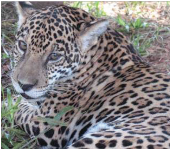
Figura 5. Jaguar ( Panthera onca ) incautado en Puerto Carreño

Teniendo en cuenta que el mantener fauna silvestre de manera ilegal es un delito castigado por la ley (Decreto 1608 de 1978), se generaron comunicaciones con las personas poseedoras del animal, ya que es necesario llevar a cabo este proceso para legalizar la incautación, generándose un retraso en el cronograma establecido por más de dos meses. El desarrollo de este proceso demostró, en parte, la falta de conocimiento de las leyes y de los procedimientos que se deben llevar a cabo para la incautación por parte de las entidades regentes.