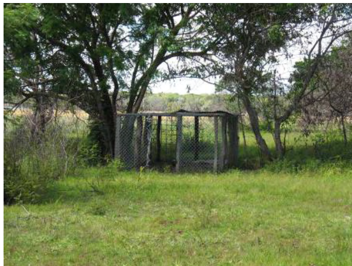
Figura 3. Encierro provisional para el manejo del Jaguar en la reserva Bojonawi en cercanías a Puerto Carreño.

El animal fue sometido a una evaluación clínica, donde se destacó la presencia de mucosas pálidas, frecuencia respiratoria de 25 respiraciones por minuto (rpm) y una pequeña laceración no reciente de 0,5 cm en el miembro posterior izquierdo. Se examinó la frecuencia respiratoria, la cual osciló entre 12 y 22 respiraciones por minuto en un lapso de 40 minutos, su frecuencia cardíaca fluctuó entre 100 y 120 pulsaciones por minuto. Se realizó una inspección visual evitando la interacción con el individuo, encontrándose despierto y activo; se hizo una búsqueda de material de desecho del animal para análisis, encontrando vómito el cual es producto del efecto fisiológico emético de la Xilacina.