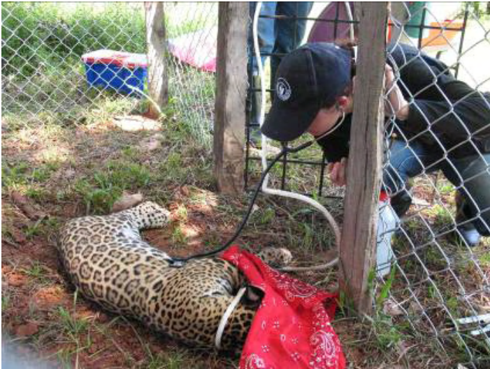
Figura 4. Procedimiento de análisis preliminar del estado de salud del Jaguar