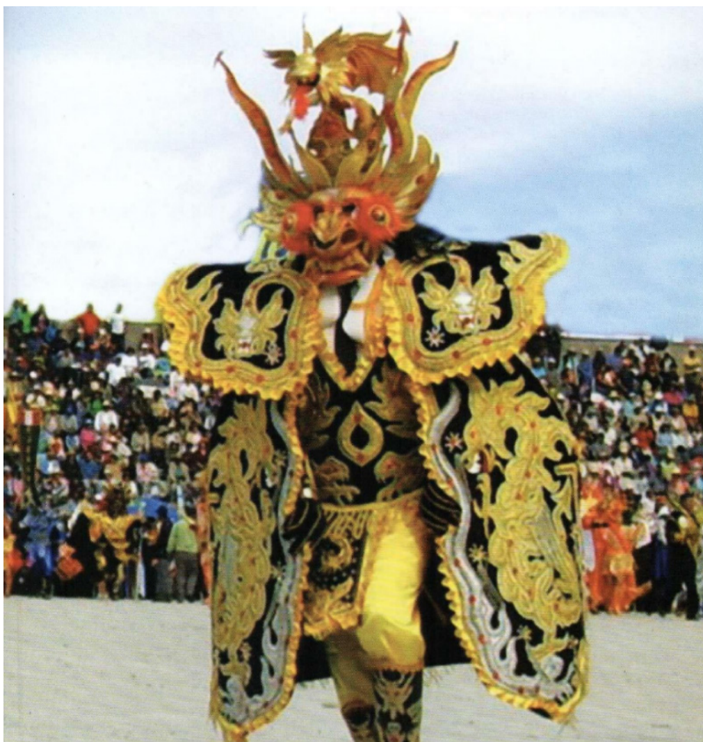
Shuyu 6. Caporal Mayor representante de la Diablada Puneña (Puno, Perú).