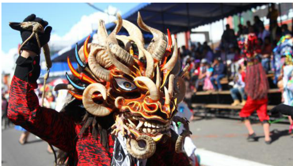
Shuyu 2. Máscara de la Diablada Pillareña (Píllaro, Tungurahua).