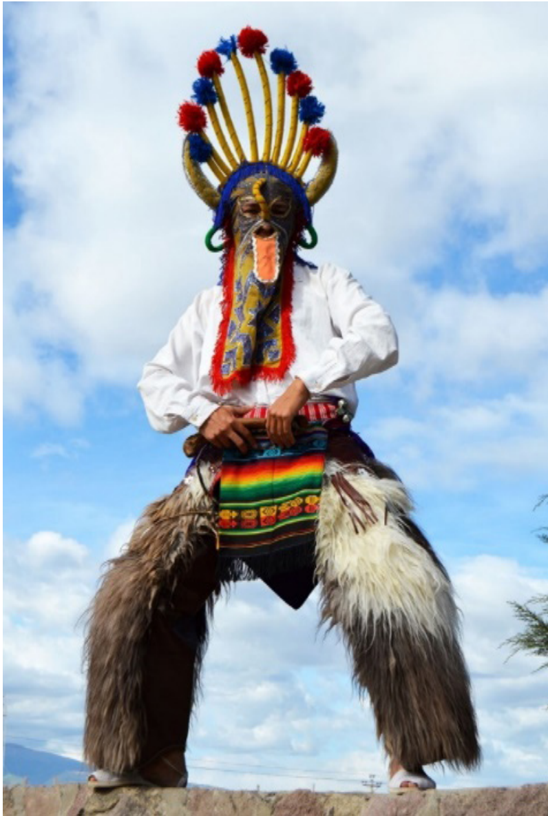
Shuyu 4. Diablo Aya Huma (Cayambe, Pichincha).