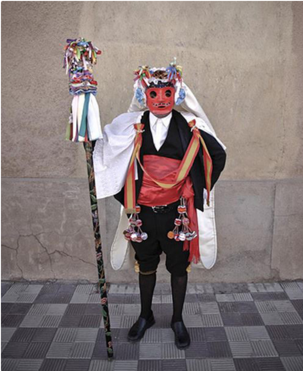
Shuyu 1. Pecados de Camuña (Toledo, España).