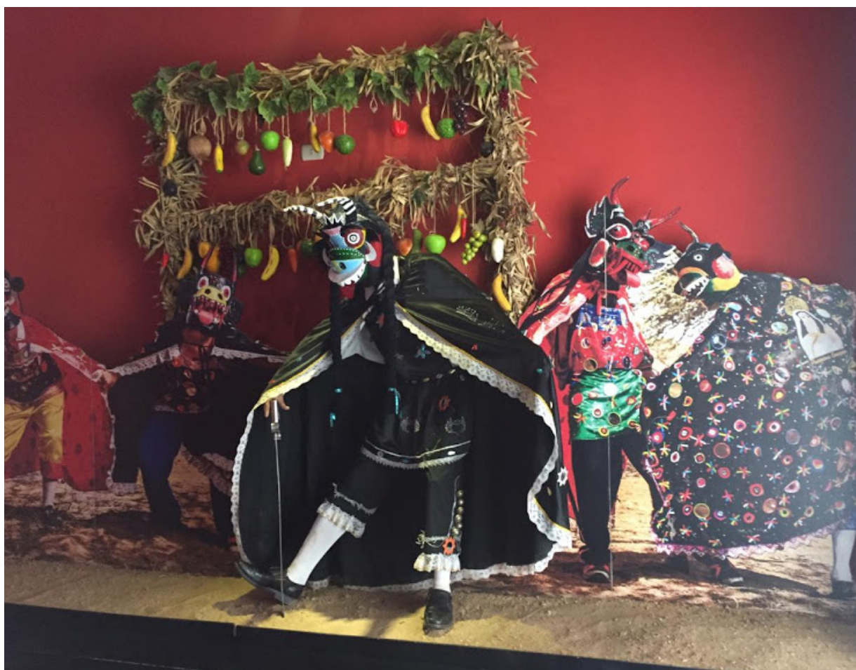
Shuyu 7. Diablicos de Túcume (Ecosmuseo de Túcume, Perú).