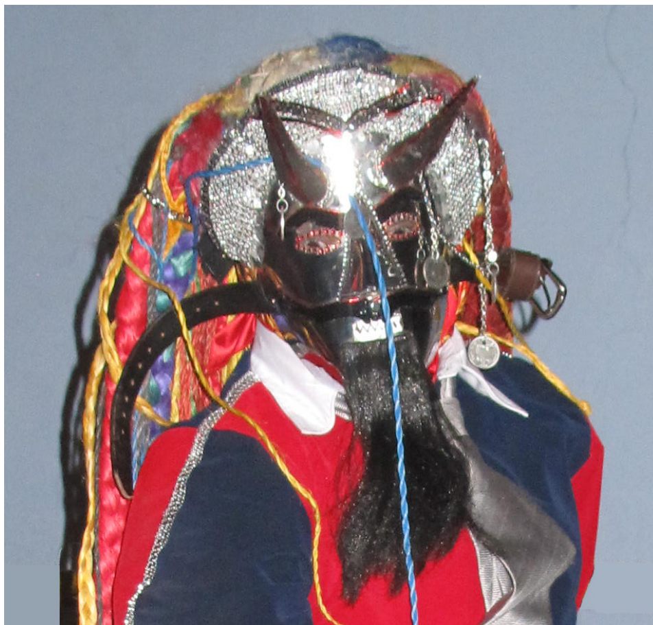
Shuyu 10. Careta del Diablo Mayor o Diablo de Diablos.