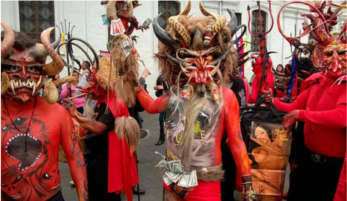
Shuyu 5. Diablo de Alangasí (Alangasí, Pichincha).