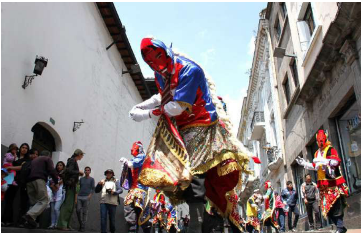
Shuyu 8. Diablo de Lata en el Pase del Niño Rey de Reyes (Riobamba, Chimborazo).