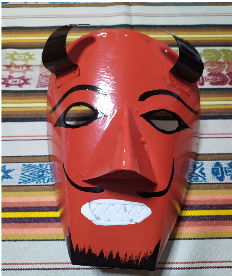
Shuyu 9. Careta Básica del Diablo de Lata color rojo y negro.