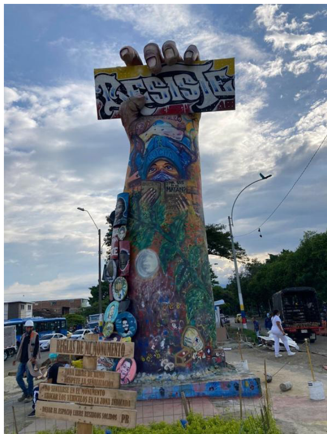
Figura 4. Registro etnográfico. Monumento a la Resistencia