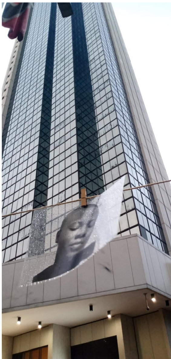
Figura 2. Registro etnográfico. Fotografía como recurso de confrontación