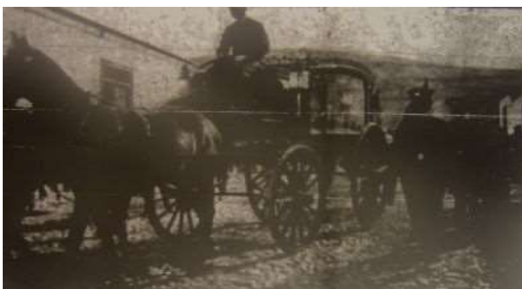
Imagen N° 1: Funerales de Guillermo Bierwirth publicados en la revista “Sucesos”