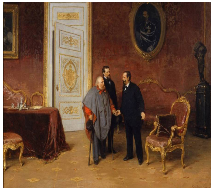
Fig.9 Gerolamo Induno, Giuseppe Garibaldi e il Generale Giacomo Medici incontrano il Re Vittorio Emanuele II.