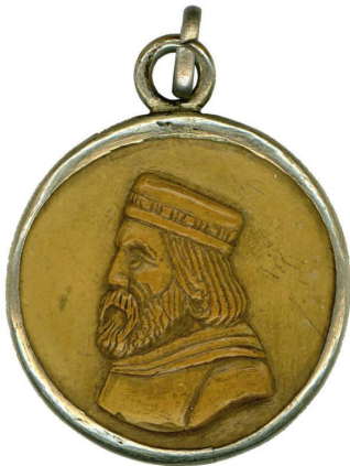
Fig. 3 Colgante con perfil de Garibaldi, en hueso y cornisa de plata, 1892.