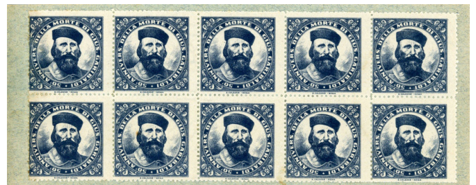
Fig. 2 Sello conmemorativo de los 50 años de la muerte de Giuseppe Garibaldi.