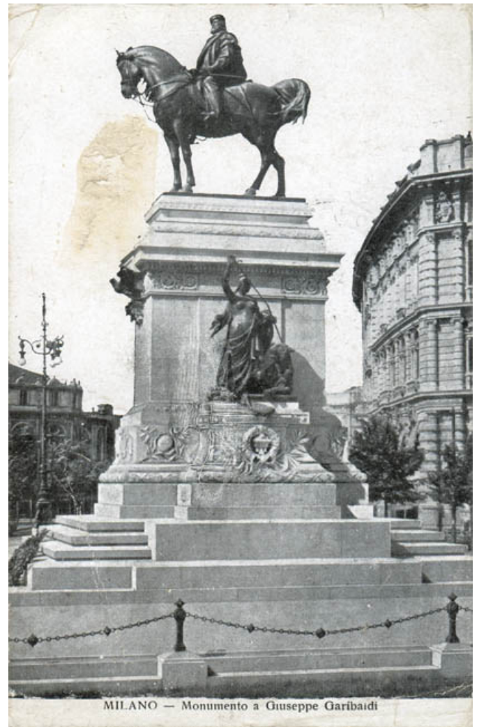
Fig. 12 Tarjeta postal, Milano- Monumento a Giuseppe Garibaldi (r/v).

Fuente: Santiago de Chile, Museo Benjamín Vicuña Mackenna, 1910