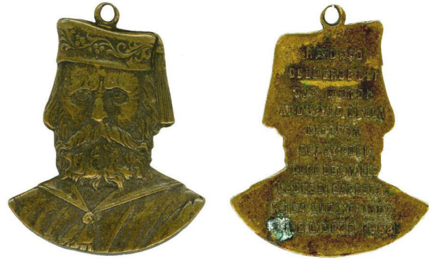
Fig. 4 Colgante en forma de busto de Garibaldi, r/v, 1882.