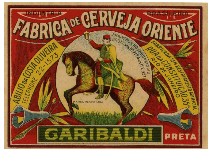
Fig.5 Reclame para cerveza brasilera, finales de XIX