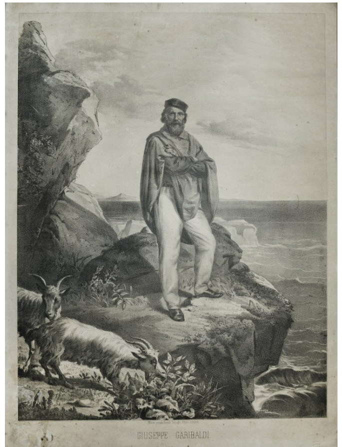
Fig. 1 Fratelli Terzaghi, Giuseppe Garibaldi en Caprera, litografía, 1860 ca.