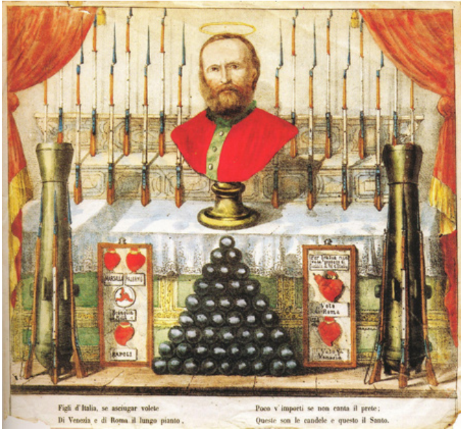
Fig. 6 Calendario año 1863, Litografía.