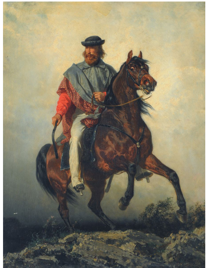
Fig. 7 Filippo Palizzi, Garibaldi a caballo.

Históricamente se reconoce la animadversión de la Monarquía hacia Garibaldi. Es de recordarse que las Exposiciones Nacionales se celebraban al amparo y bajo el ojo atento del Gobierno.