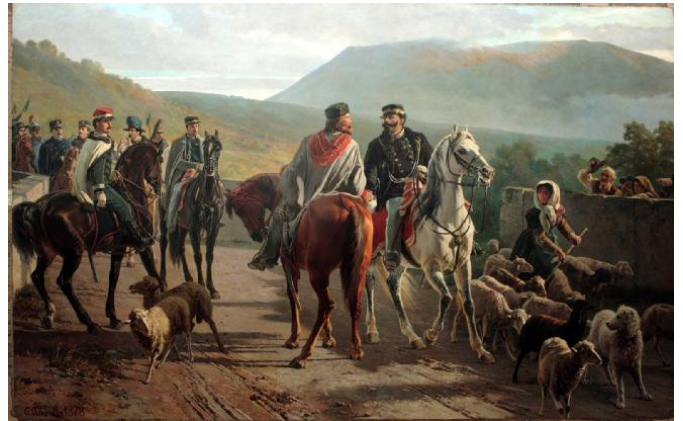
Fig.10 Carlo Ademollo, Garibaldi y Vittorio Emanuele II en Teano.