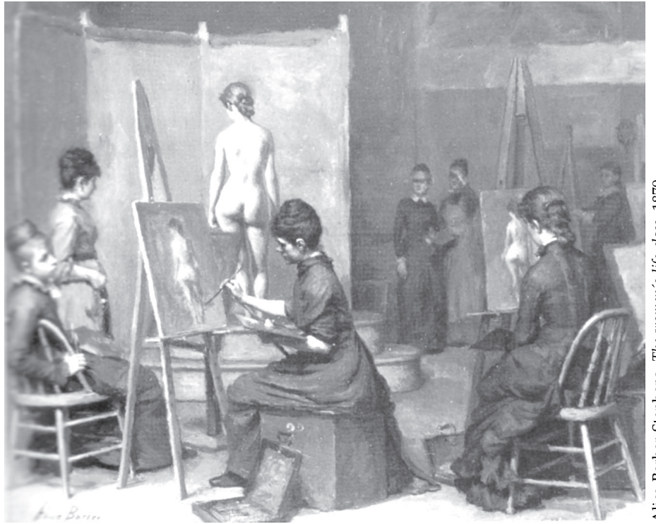
Alice Barber Stephens. The women's life class . 1879.