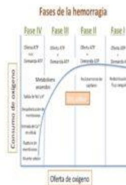
Imagen 1: Fisiopatología de la hemorragia

Existen distintas definiciones recogidas en la literatura, todas ellas arbitrarias y con escaso valor clínico. Entre las más utilizadas destaca la pérdida de más de 150 ml/min durante más de 10 minutos siempre que las pérdidas sean cuantificables.