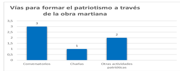
Fig. 3- Vías para la formación del patriotismo a través de la obra martiana

Atendiendo a vías para formar el valor patriotismo a través de la obra martiana en estudiantes universitarios, los conversatorios obtuvieron la mayor cantidad, ya que 3 (50 %) eligieron este, como muestra la figura 3, mientras las charlas resultaron con el 16,6 % (1) y los restantes en actividades patrióticas 33,3 % (2), señalando matutinos, actos, observación de películas y documentales y otras actividades que fortalecen el patriotismo en los jóvenes.