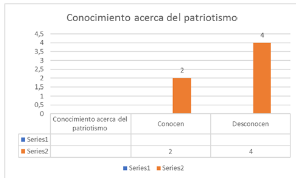
Fig. 1- Conocimiento acerca del patriotismo

Sobre el conocimiento de la existencia del Cuaderno Martiano IV "Martí y la Universidad" , el 100 % de los encuestados (6) refirió que no lo conocía; en cuanto al conocimiento de los otros cuadernos de la educación primaria, secundaria y preuniversitario, solo uno de ellos, que representa el 16,6 % respondió que sí lo conocía.