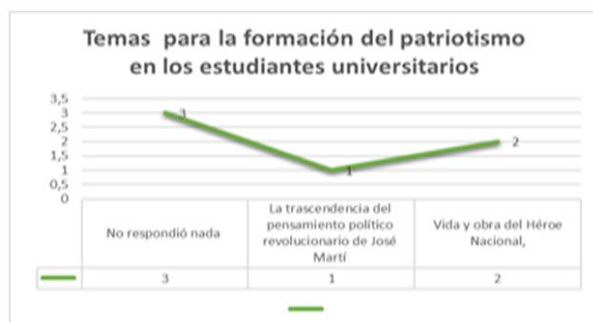
Fig. 6- Temas para la formación del patriotismo a través de la obra martiana

Sobre los temas que debieran recibir los profesores para la formación del patriotismo a través de la obra martiana, el 50 % (3) no respondió nada, el 16,6 % (1) vinculado a la trascendencia del pensamiento político revolucionario de José Martí y el 33,3 % (2) se refirió a la vida y obra del Héroe Nacional, por el enorme legado que presenta para las presentes y futuras generaciones y la vigencia en los momentos actuales.