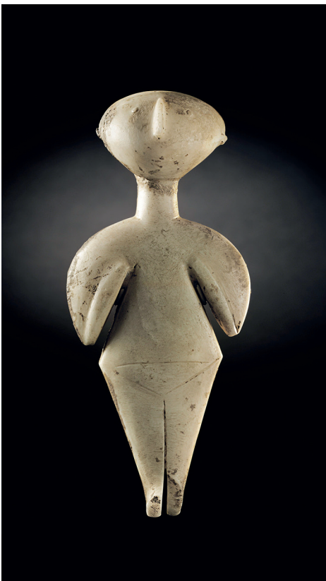
Imagen 10: Ídolo Kilia , 3000-2200 AEC. Marmol, Anatolia (Turquıa).