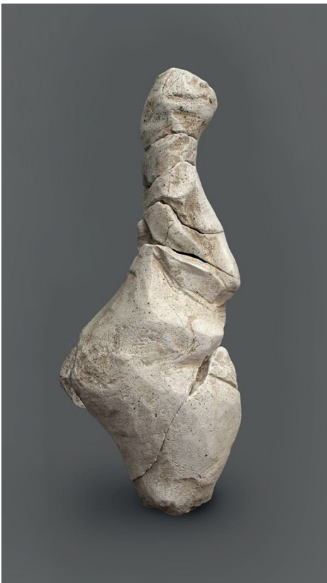
Imagen 6: Mujer de Renancourt , 21.000 AEC. Piedra caliza, Amiens (Francia).