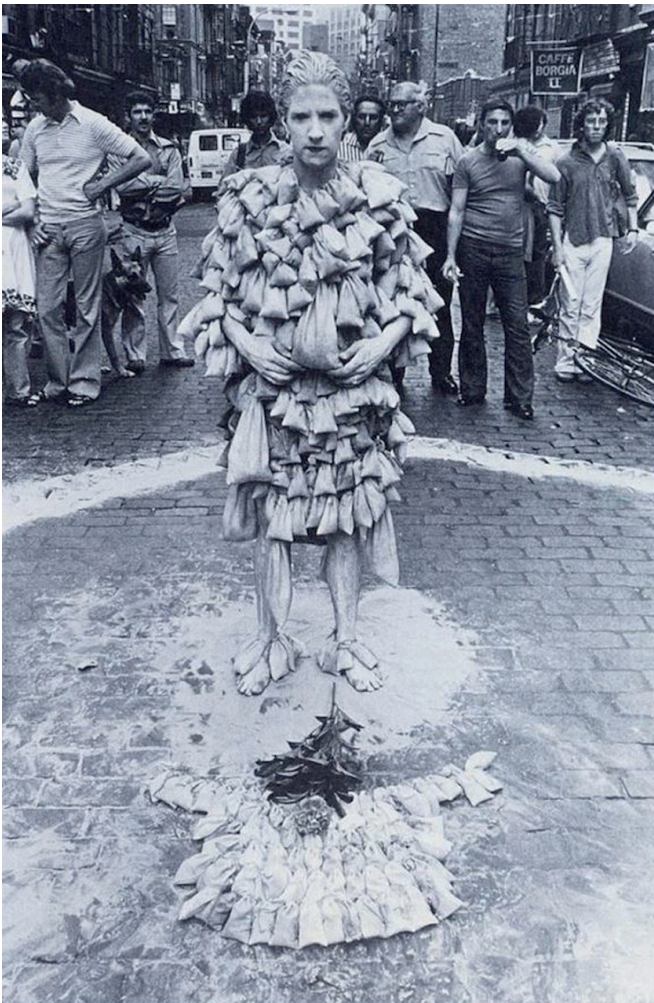
Imagen 2: B. Damon, 7000 Year Old Woman , 1977.