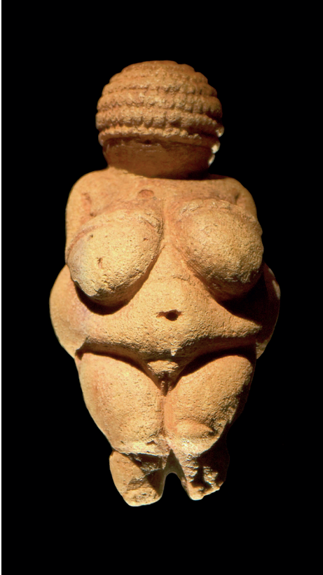
Imagen 4: Mujer de Willendorf , 24- 22.000 AEC. Piedra caliza, Willendorf (Austria).