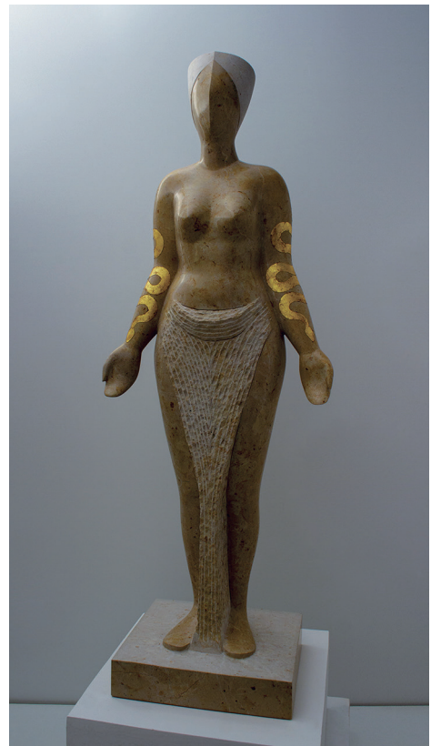
Imagen 19: A. M. Morro, La recolectora de azafrán , 2021. Piedra de Ulledecona y pan de oro.