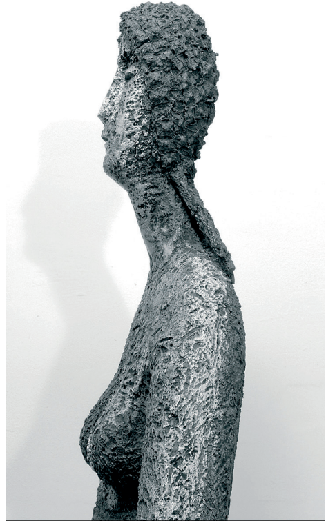
Imagen 9: A. M. Morro, Aries o Luna de Abril , 2011. Aluminio.