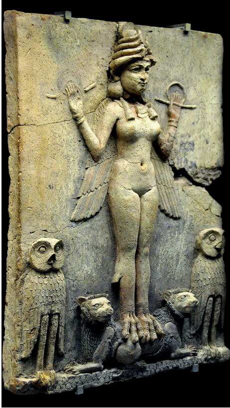
Imagen 16: La reina de la Noche , 1800-1750 AEC. Cerámica, Irak.