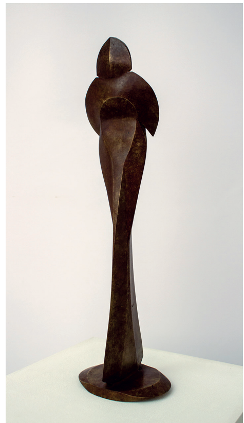
Imagen 11: A. M. Morro, Numina o la muerte de Homero , 2020. Bronce.