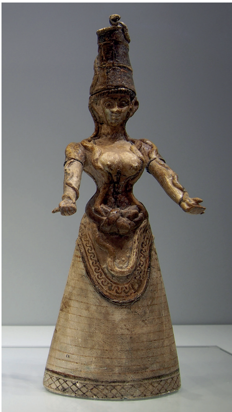
Imagen 18: Diosa serpiente , c. 1600 AEC. Cerámica, Creta (Grecia).