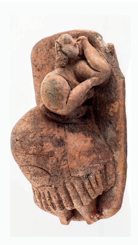
Imagen 14: Mujer del Hipogeo , 3300- 3000 AEC. Cerámica, Paola (Malta).