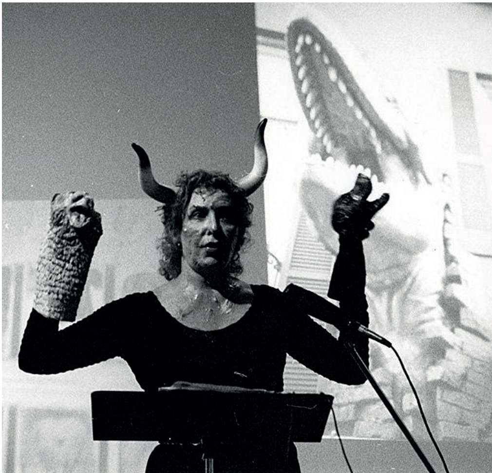
Imagen 3: C. Schneemann, Ask the Goddess , 1993-97. Performance .

sarrollo de una propuesta artística objetual, desde una mirada masculina, blanca y occidental, con la que apelar a nuevas relaciones de género más válidas y significativas, no está libre de contradicciones y acepta múltiples abordajes críticos. En cualquier caso, entendemos que plantear, a través de la expresión artística, nuevos entornos en los que relacionarnos, y contribuir desde un enfoque decrecentista a la exaltación del poder femenino, es por sí misma una vía que escapa a las lógicas productivas del capitalismo; y puede, además, alentar la participación en el debate de género en sectores populares que han permanecido, en los últimos tiempos, ajenos a los lenguajes del arte contemporáneo.