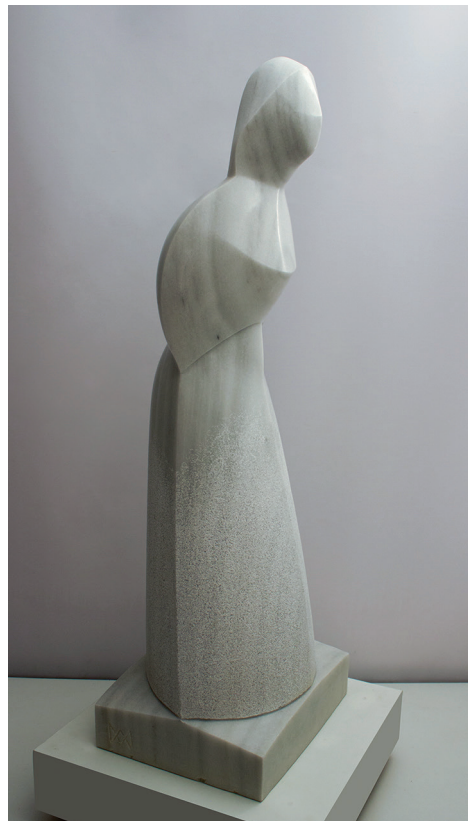
Imagen 7: A. M. Morro, Gylania , 2020. Mármol blanco de Macael.