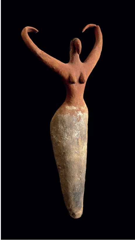
Imagen 12: Mujer de Al-Gerzeh , 3500-3400 AEC. Cerámica, Fayún (Egipto).