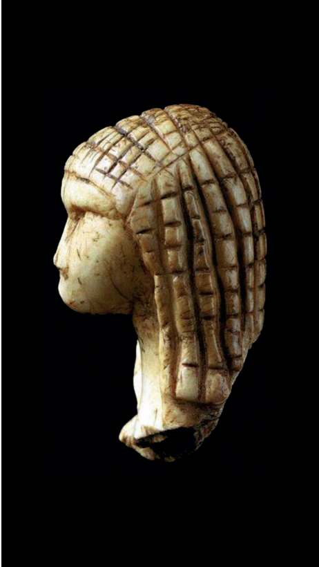
Imagen 8: Mujer de Brassempouy , 26- 24.000 AEC. Marfil de mamut, Brassempouy (Francia).