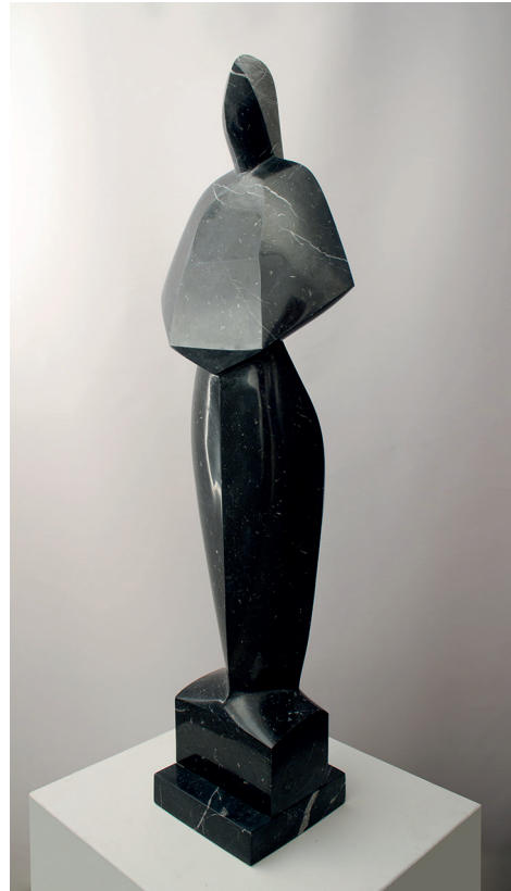
Imagen 13: A. M. Morro, Tormenta , 2019. Már- mol negro de Markina