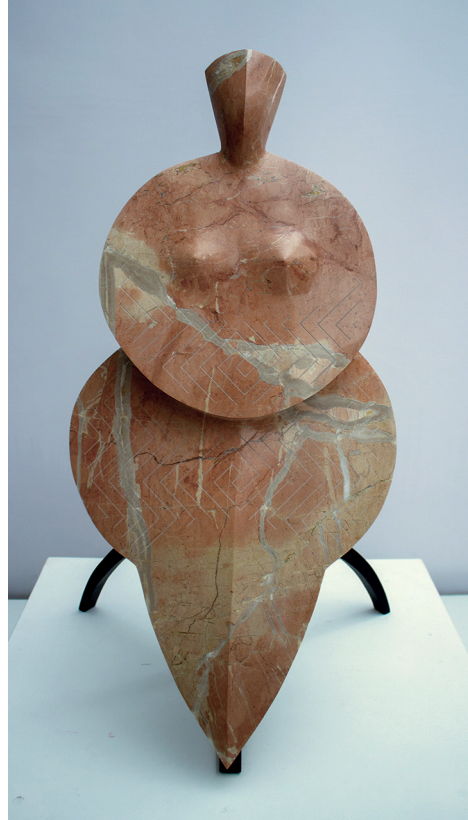
Imagen 5: A. M. Morro, Madre de madres , 2020. Caliza roja de Alicante.