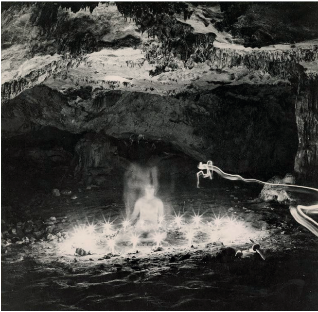
Imagen 1: M. B. Edelson, Grapceva Neolithic Cave See for Yourself , 1977.