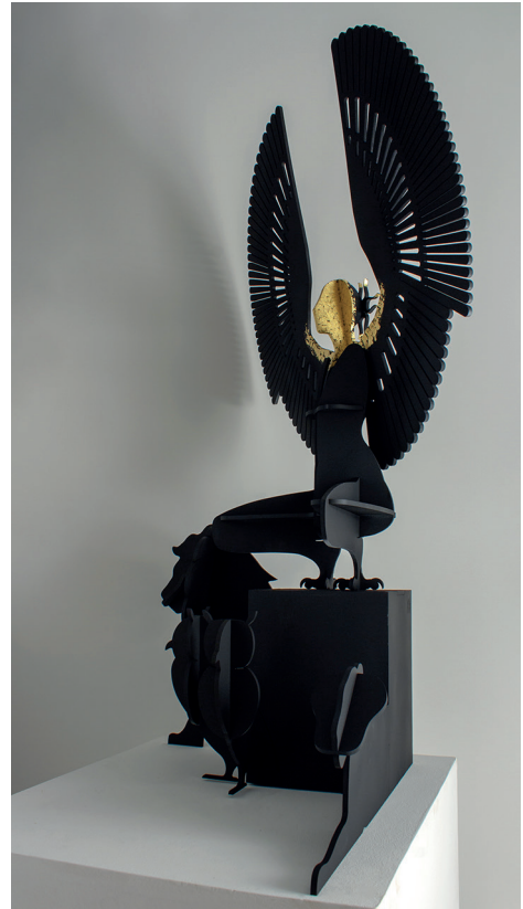
Imagen 17: A. M. Morro, Ishtar , 2021. Acero esmaltado y pan de oro.