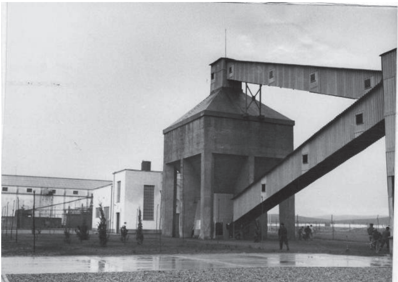
Fig.1. Fachada de la Fábrica General Hernández Vidal (FUA), Andújar (1959), Anónimo.

No se trata exclusivamente de visibilizar una problemática nuclear que afecta gravemente al ecosistema y a la salud de las personas que habitan el espacio, sino de dinamizar y agitar la conciencia en