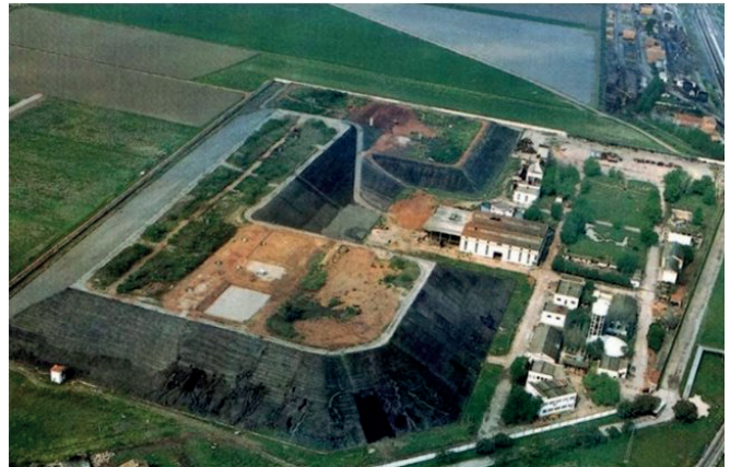
Fig. 5. Imagen aérea de la FUA, (1981), Enresa.

Genoma, deriva rural y prácticas cartográficas. Radiactividad en Andújar.