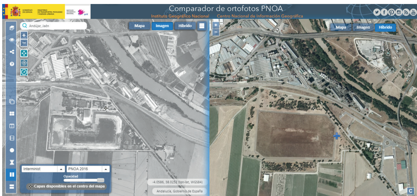
Fig. 3 (arriba). Captura de comparador de ortofotos PNOA de la FUA desmantelada (1997-2003).