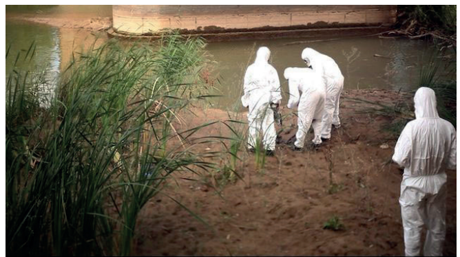
Fig. 7. Miembros del CSN inspeccionan el terreno cercano a la FUA. (2007), Enresa.