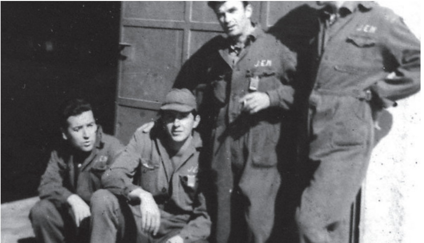
Fig. 2. Operarios y trabajadores de la FUA, (1959), Anónimo.

búsqueda de un pensamiento crítico que propicie la reflexión. Así mismo, este estudio pretende reivindicar el caminar como forma activa de meditación y como práctica artística, sin embargo, no es un caminar como gesto de disculpa hacia la naturaleza por la deshumanización y radiactividad provocada intrínsecamente en el paisaje, sino un caminar más bien como búsqueda de conocimiento, de reflexión y de documentación, un caminar como archivo cartográfico para denunciar y evidenciar una realidad invisibilizada. Los resultados y respuestas que evidencia este estudio pretenden servir, en última instancia, como herramientas políticas para descolonizar la naturaleza debido al estado de emergencia climática en el que nos encontramos insertas. Así pues, la práctica en esta investigación sería el resultado de un camino de exploración a través del mapa para presentar, como otra guía de viaje, un hallazgo catastrófico. Para ello se recorre La mota , (tramo, junto al río Guadalquivir de Andújar, más cercano al terreno radiactivo) y se extraen diversos archivos para evidenciar el problema. Por último, se ha generado un tríptico de infografías y esculturizaciones plásticas que recogen los archivos de la investigación bajo un punto de vista cartográfico.