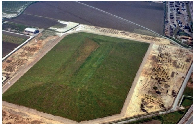
Fig. 6. Imagen aérea de la FUA, (1991), Enresa.