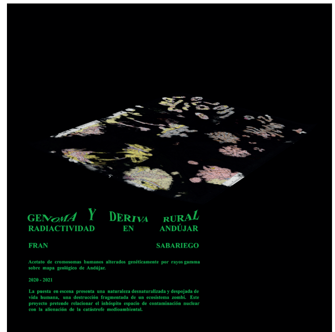
Fig. 10. Fran Sabariego Uceda, (2021). Infografía 03. Acetato de cromosomas humanos alterados genéticamente por rayos gamma sobre mapa geológico de Andújar.

Cuando elaboramos un estudio de investigación artística basada en la práctica podemos rescatar recursos científicos, gráficos y audiovisuales de manera que estos presenten el contenido de forma pragmática, basándonos en lecturas, escritura, catalogación y relación de datos. Sin embargo, una investigación en la que se revela un proceso etnográfico y/o cartográfico no se prestaría a enmarcarse en un formato estandarizado y exclusivamente académico, por lo que el artista e investigador asume su capacidad