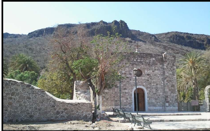
Fig. 3. Misión de San José de Comondú

La falta de alternativas productivas viables es ya muy evidente: de las 92 parcelas que originalmente existían, en la actualidad únicamente 32 permanecen activas en la cañada. Si bien la estructura productiva de San Miguel y San José comunidades descansa en el sector primario, en ambas coexisten otras prácticas productivas que complementan el ingreso de sus habitantes. De éstas, 11 parcelas tienen cultivada caña de azúcar, 16 parcelas vid, 10 palma datilera, y 23 huertas cuentan con frutales y otras siembras. De esas huertas se procesa la caña para producir piloncillo, se hacen vino, frutas confitadas, y esteras de carrizo que venden a los aún escasos visitantes que llegan a Los Comondú, atraídos por la misión en San José, cuya construcción data del siglo XVIII. Adicionalmente, es de notar que una parte relevante del escaso ingreso monetario en las dos comunidades proviene de los diferentes niveles de gobierno (federal y estatal) en la forma de programas de empleo temporal y capacitación para la conservación ambiental y el desarrollo rural. Aun así, la falta de empleo, la sequía, la pérdida del ganado, la escasa agregación de valor de sus productos, la dependencia de canales externos (que vuelve a los productores sujetos del intermediarismo), mantienen a los habitantes de esta zona en una situación de vulnerabilidad permanente, que redundo en un creciente envejecimiento de la población por el despoblamiento, como ya se anotado.