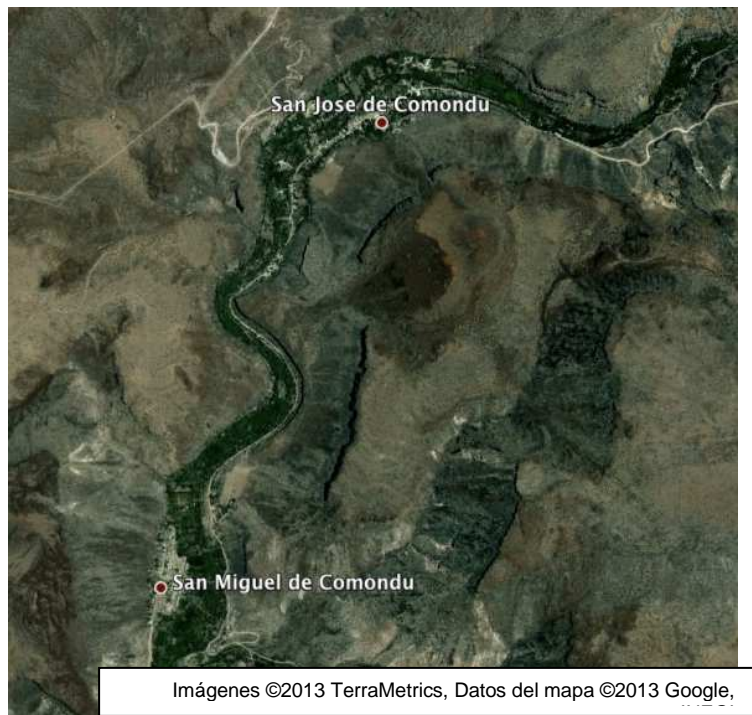
Fig. 3 El oasis de San Miguel y San José de Comondú, B.C.S.