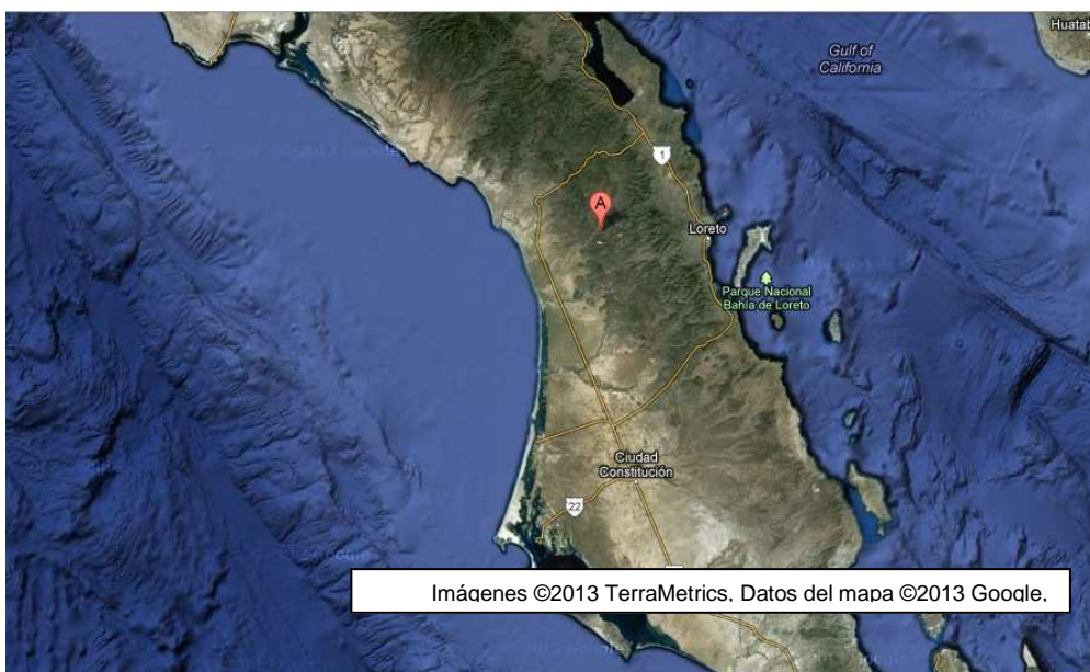
Fig. 2. Ubicación geográfica de Los Comondú, BCS

Comondú alberga casi una cuarta parte de las 2,850 localidades que componen Baja California Sur. De las 661 localidades activas que integran el municipio, 95 por ciento son rurales, con una población menor a 99 habitantes (INEGI, 2011). Si se incluyen las localidades que son habitadas por menos de 499 personas, la proporción se eleva a 98.5 por ciento (SEDESOL, 2011). En ese contexto las comunidades de estudio, San Miguel y San José de Comondú (el oasis de “Los Comondú”), están enclavadas en la Sierra de la Giganta, a una distancia de 130 km de Ciudad Constitución, la cabecera municipal, de la que dependen administrativamente estos poblados (Fig. 2). A mitad de 2011 se concluyó el tramo carretero que comunica a Los Comondú con la comunidad de Francisco Villa, poblado a 37 km de distancia entre éste y los dos poblados. Justo ahí, está la intersección con una carretera que se entronca con la carretera Transpeninsular, eje de las comunicaciones por tierra de la entidad, que va desde el extremo sur de la península hasta la frontera con California.