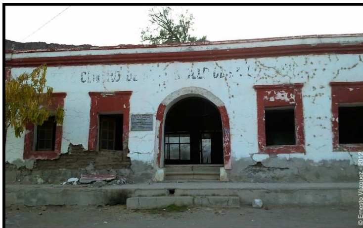
Fig. 4 Centro de desarrollo comunitario de San Miguel de Comondú

Aunque el abandono y deterioro de las viviendas, especialmente de las antiguas, es notorio en ambas comunidades, las de San Miguel muestran el mayor desgaste. Es ahí también donde es notoria la ausencia de espacios públicos para la socialización de los habitantes y como insumo para actividades de turismo rural, por ejemplo. Es de mencionar que el impacto de las diferencias entre los pobladores respecto a la tenencia de la tierra se extiende no sólo al aspecto de tensión social, preocupante en comunidades tan pequeñas, sino también a las posibilidades de activación agrícola (si bien la falta de claridad sobre la tenencia no es la única explicación, influye en que muchas de las huertas se encuentran abandonadas).