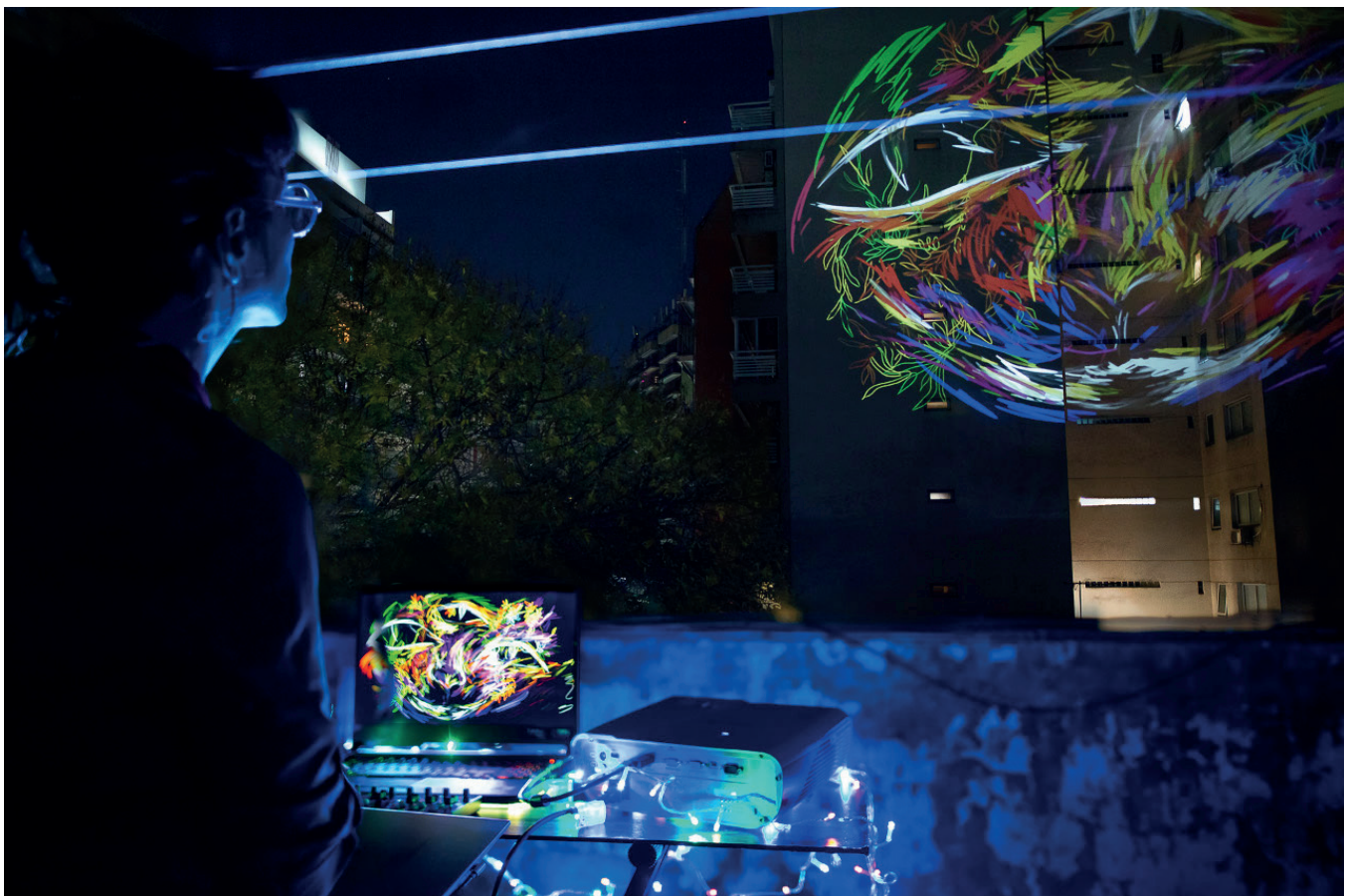
Fig 6. Lau Castro Foto - 2021 - Medianeras Intervención urbana Dibujo abierto

El otro proyecto en proceso es Uma , una obra que celebra al agua como esencia, misterio y principio de la vida; pero que también aborda la problemática ambiental y la necesidad de generar concien-