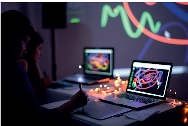
Fig 3. Lau Castro Foto - 2017 - Presentación Trazos Club en Club Cultural Matienzo

En el dibujo escénico es necesario considerar a la vez el dibujo que se está trazando, el que queda fijo en cada momento y el resultante de toda la interpretación. Cuando los dibujos digitales son animados en tiempo real (a través de programas que lo posibilitan), se puede mostrar la acción de dibujar en los mismos tiempos en que ésta se realiza, por lo que los efectos digitales son aplicados en función del dibujo a mano alzada. Esto posibilita concebir el dibujo como un arte con base en el tiempo, lo que refuerza el rol del artista visual en escena, y da lugar al desarrollo de la improvisación, del ensayo, y de sistemas de notación para obras en vivo a través del dibujo.