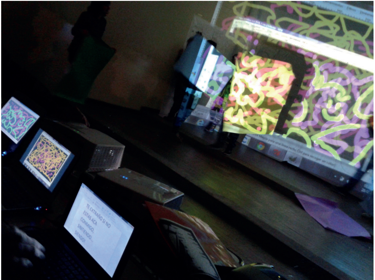
Fig 1. Marcela Rapallo - 2015 - Registro de Acción poética con dibujo en vivo Formación CAJ Mar del Plata

En cuanto a la dimensión temporal del dibujo, Andrés Colubri (2009) escribe en su Tesis Estado latente que la naturaleza procesual del cine en vivo es la clave para la madurez del género. Hace foco en el dibujo en vivo como el elemento central de este tipo de performances por considerarlo un acto profundamente performático, donde el gesto transmite directamente las emociones del artista, y su fisicalidad a través del trazo, en el momento de la creación.