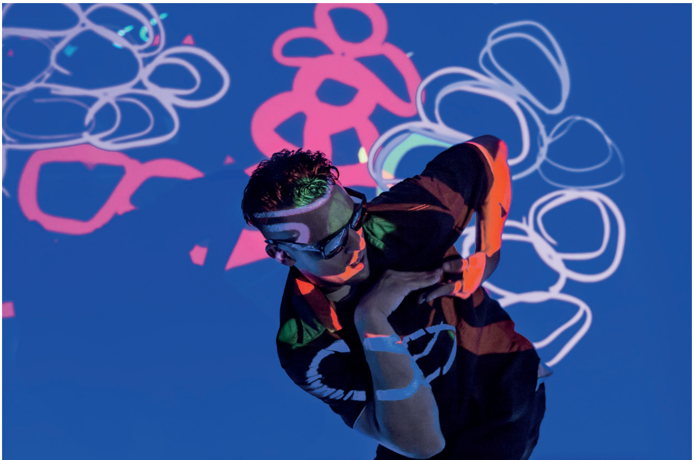
Fig 5. Lau Castro Foto - 2017 - Trazos y Ritmo Actividad participativa en el Centro Cultural de la Ciencia

También se realizaron capacitaciones de dibujo digital colectivo y software libre en la experiencia nombrada anteriormente del programa socioeduca-