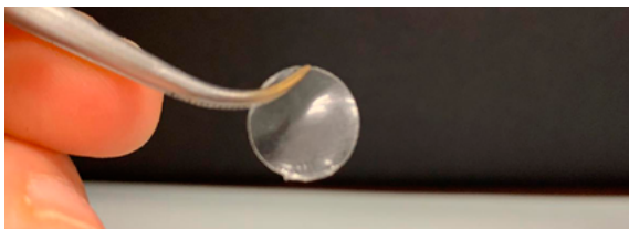
Figura 1. Inserto ocular formulado con FCV.

El inserto ocular formulado es suave al tacto, translúcido y su consistencia es la adecuada (Fig 1).