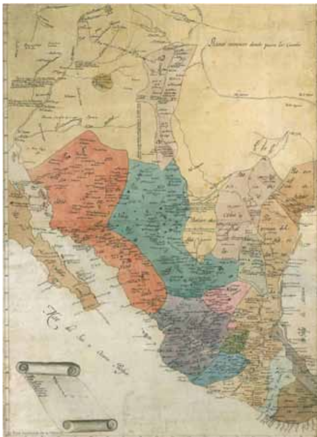
Figura N° 7. Humboldt, Carta Geográfica general del reino de la Nueva España (1804).

de la Nueva España”. De hecho, esta Carta representa a las provincias y a las intendencias de provincia, y muestra cómo se dio la integración territorial novohispana, origen de la división geopolítica nacional. Gracias a los acervos cartográficos de la Real Academia de la Historia de España, en especial de la Colección Humboldt que posee, y a la posibilidad de consulta digital que ofrece su portal, podemos revisar una copia digital de tan importante carta identificada recientemente (Manso Porto, 2008).