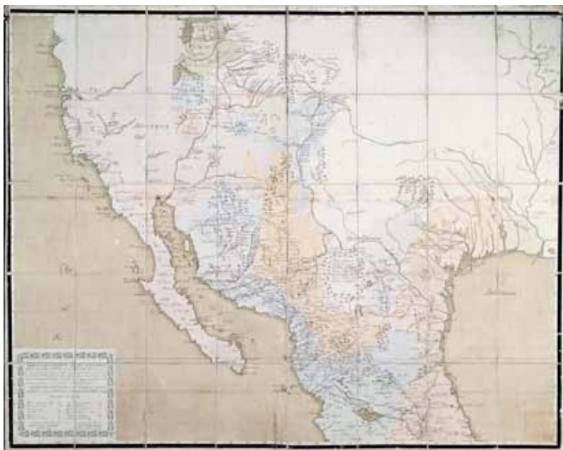
Figura N° 8. Costanzó y Mascaró, “Carta o Mapa Geográfico de una gran parte del Reino de N.E...” (c1779).

De acuerdo con el propio Humboldt, para la elaboración de la Carta General consultó 36 mapas o cartas, y entre las más destacados, que ofrecen una visión general de la Nueva España, fueron el Mapa manuscrito de la Nueva España , realizado por Costanzó y Mascaró (ca.1779), al igual que el Mapa general de la Nueva España , también por Costanzó, “precioso por el conocimiento de las costas de Sonora”; el Mapa del Arzobispado de México (1772), por José Antonio de Alzate, “es muy malo”, comentó lacónicamente Humboldt; el de Velázquez, de 1772, Mapa manuscrito de toda la Nueva España ; el de Antonio Forcada y la Plaza, de 1787, Mapa manuscrito de todo el reino de Nueva España ; y el de Carlos Urrutia, Mapa manuscrito de una parte de la Nueva España... , ordenado por el virrey Revillagigedo (Antochiw, 2000).