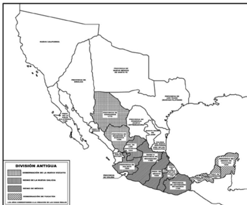
Figura N° 1. Mapa de la “División Antigua”.

Fuente: Edmundo O’Gorman, Historia de las divisiones territoriales de México , Ed Porrúa, 9ª. ed., 2000, pp. 16-17; reelaborado digitalmente por María González. Los años debajo de cada nombre de provincia son los años de creación de las cajas reales en cada capital, agregados por el autor de este ensayo.