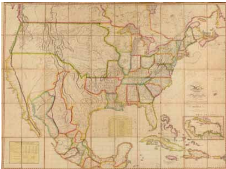
Figura N° 9. John Melish et al. Map of the United States of America...

El mapa que expresará con claridad la importancia de las divisiones en provincias internas e intendencias de provincia sería el publicado por John Melish en Filadelfia, el año de 1820. Melish analiza la extensión de cada provincia y su población, así como la extensión de las provincias internas y prácticamente el despoblado entre las posesiones estadounidenses y españolas. Quizá por ello era el silencio de la Monarquía hispana, no solo por el temor de dejar al descubierto los tesoros novohispanos, sino porque las grandes extensiones y sus necesidades de protección terminarían dejando grandes vacíos de poder y de territorio.