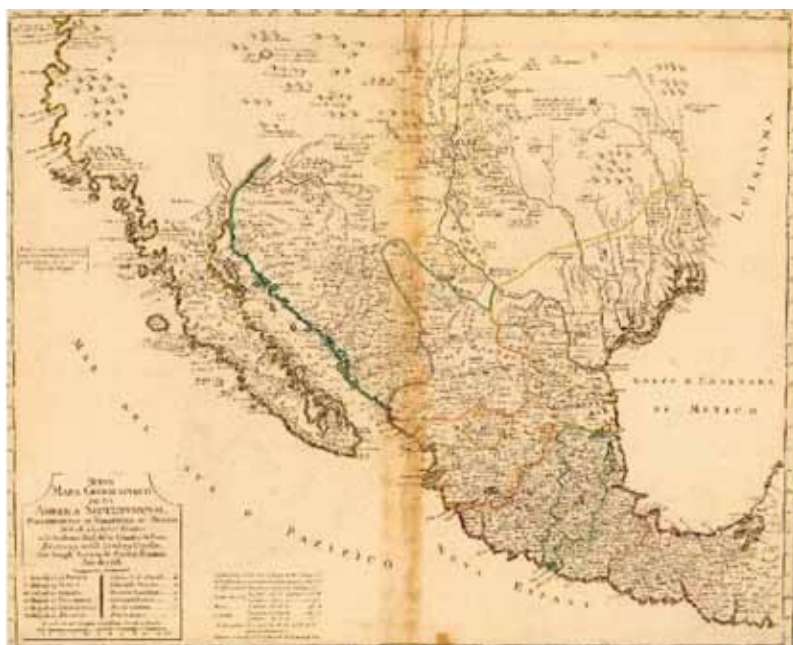
Figura N° 6. José Antonio de Alzate, “Mapa del Arzobispado de México” (1768).

Alzate mantuvo la división en obisposados (Figura N° 6), con el argumento de que “un alcalde mayor por razón de que así lo establecen las leyes, poco tiempo reside en un mismo territorio, y por consiguiente no puede tener aquella instrucción topográfica que poseen los curas.” (Trabulse 1983: 25). Es decir, los curas estaban mejor preparados para llevar a cabo las mediciones cartográficas. De hecho, el nombre que le dio la biblioteca en la que se encuentra el original de Alzate es el “Mapa del Arzobispado de México”, dado que representa las divisiones eclesiásticas.