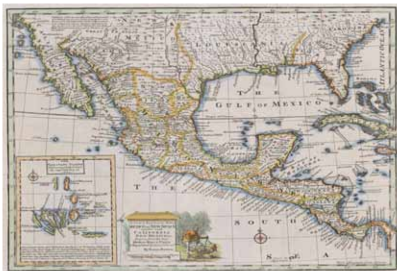
Figura N° 4. Mapa de Eman Bowen "A New & Accurate Map of Mexico or New Spain (1759).

vincias, incluidas California, Nuevo México, Luisiana y Florida, pero con cambios en grados en las ubicaciones. Se trata de un excelente ejemplo de representación de las provincias de mediados del siglo XVIII.