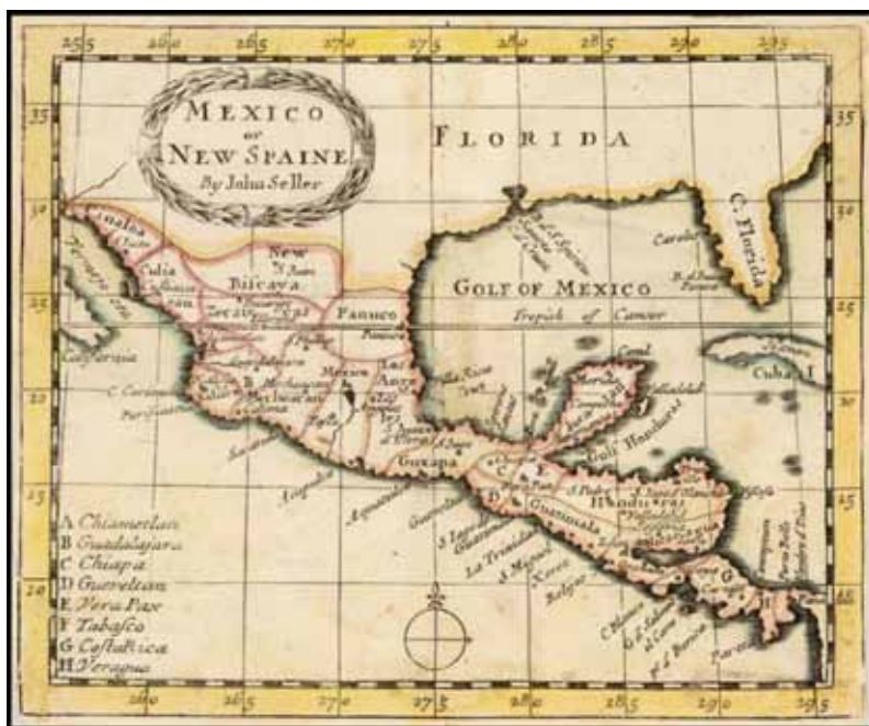
Figura N° 2. Mapa de John Seller "Mexico or New Spain" (1685).

Existe otro mapa muy similar al de John Seller, que fue el realizado por Robert Morden, "Mexico or New Spain" (1688), que se encuentra en el Museo Franz Mayer.