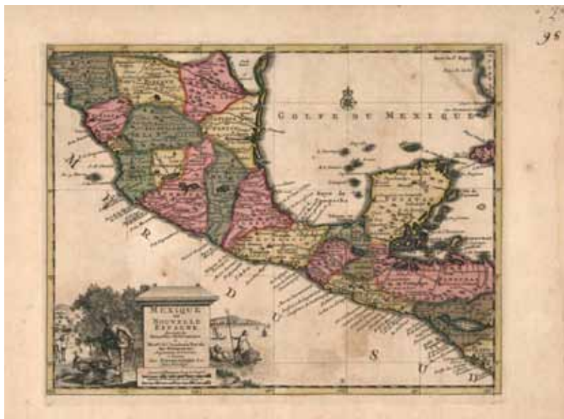
Figura N° 3. Mapa de Pieter Van der Aa “Mexique ou Nouvelle Espagne” (1714).

dicado en específico a “Mexique ou Nouvelle Espagne” sigue siendo un referente importante en la reflexión acerca de las divisiones que, como hemos comentado, se originaron desde el siglo XVI con propósitos administrativos, territoriales/militares y fiscales. 1