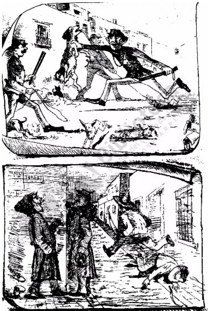
Imagen 1. Caricatura de la policía de Guadalajara*

* Si bien la fuente sale estrictamente de la temporalidad propuesta, considero que es relevante para reforzar el punto en cuestión.