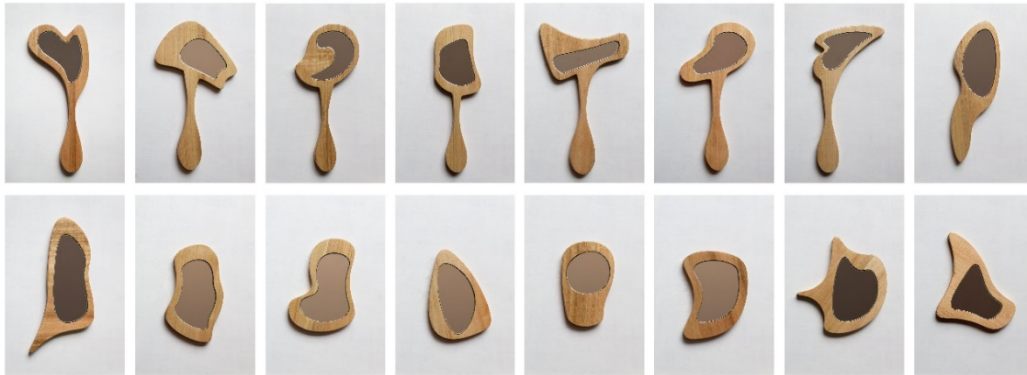
Figura 1. Polo, D (2021) Espejos para Cuéntame de los cuerpos por donde transita nuestra intimidad.