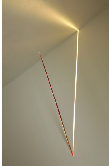
Figura 7. Detalle de Kuyllur . Resina poliéster cristal, luces led y video digital.

ficticios, creados a partir de luces, brillos y variaciones de luz que fueron obtenidos de la video transmisión online del momento previo a su entierro.