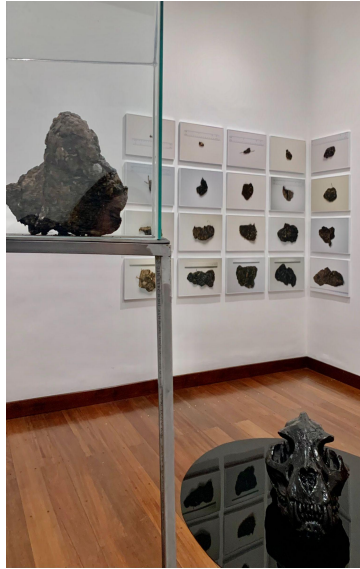
Figura 4. (izq-der). Detalle de Costra , Inscripción Ñuthse Cansefaye sobre pasivo de petróleo realizado con Croton lechleri (Sangre de drago). Ñuthse Cansefaye significa “Buen Vivir” en lengua AI’Cofán. Detalle de Archivo , 20 fotografías impresa sobre papel. 50 x 31 cm. c/u Selección de 20 muestras de pasivos de petróleo petrificados provenientes del bloque 62 Tarapoa. Esta selección forma parte de un registro fotográfico de 314 muestras de petróleo, encontrados en 2 quintales de pasivos de petróleo. Estas piedras de petróleo han sido medidas y pesadas. (Der-inf) Detalle de La caída del Jaguar , Cráneo de Jaguar de petróleo. Realizado con 310 muestras de pasivos de petróleo petrificados provenientes del bloque 62 Tarapoa, resina poliéster y metacrilato negro.

La investigación que viene realizando mediante largos procesos de trabajo enlazados con territorios que sufren explotación extractiva (debido a encargos laborales que lo han ubicado estratégicamente en estos sitios) lo han llevado a seguir poniendo a prueba a nivel metodológico y sensorial, acciones experimentales para el procesamiento de materiales generados mediante la extracción de petróleo de rocas petrificadas o el uso de resinas naturales contenedoras de pigmentos con los cuales consigue fluidos que a posteriori , emplea a manera de “pintura” sobre soportes tradicionales.