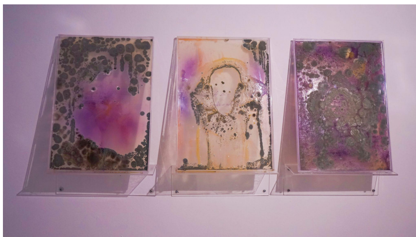
Figura 6. Detalle de Kallumpakunamikan shunku . Hongos Penicillium , Rhizopus y levaduras, cajas petri de metacrilato con cartas transferidas con violeta de genciana, merthiolate y yodo, vara de cobre. (Tomado del website del artista).