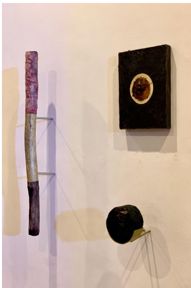
Figura 5. Detalle de Catálogo de materiales. Pigmento de polvo de oro, sangre de drago y pasivo de petróleo del Bloque 62 Tarapoa sobre palo santo y lienzo.

estrategias sensibles de construcción artística concretadas mediante los proyectos La caída del Jaguar y Catálogo de Materiales .