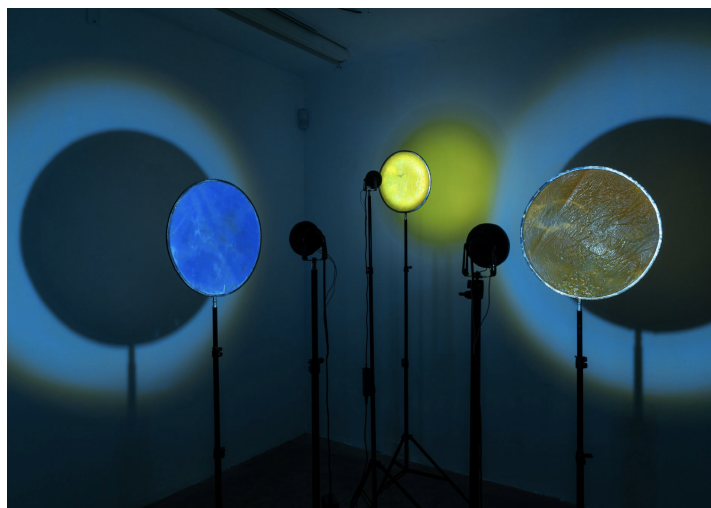
Figura 2. Tres planetas o la imposibilidad de alcanzar a Plutón. (Fotografía tomada de N24 Galería). Tres pantallas de luz ensambladas sobre pedestales y construidas con residuos de glicerina, violeta de genciana [Violeta de metilo 10B], achote [Bixa orellana], cúrcuma y amarillo no. 6 fundidas a 400° C. Proyectadas con luces led de 12 watts.

A estos agenciamientos matéricos se incorpora además su actual vivencia intuitiva y el interés que mantiene hacia la contradicción entre la astronomía y la astrología. Esta cercanía ha procedido gracias al grupo de personas con quien se ha relacionado en Ciudad de México y Ecuador, lo cual le ha procurado una invitación hacia el ejercicio zodiacal visible en un lenguaje estético que amalgama con astros, ritos y formas terapéuticas, en la resolución de su gesto artístico (figura 2).