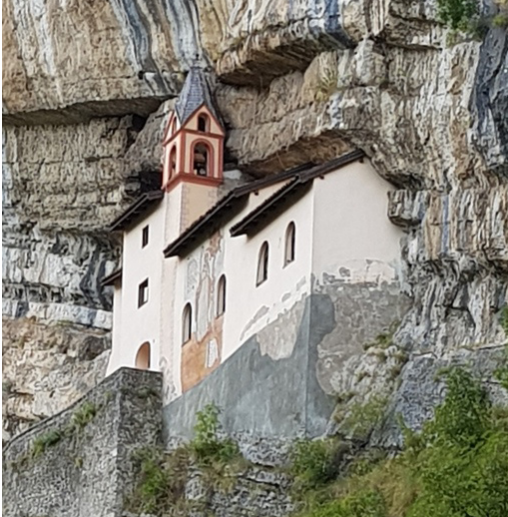
Figura 09. Ermita de San Colombano (1319) Trambileno, Rovereto