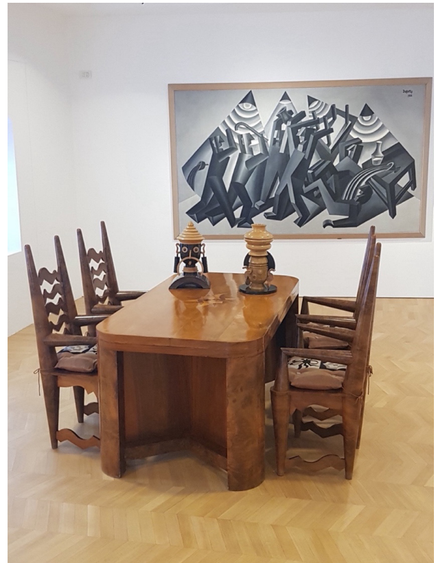
Figura 01. Tavolo con quattro sedie (1926), Testa orientale (1930-1934), Testa di cinese (1930-1934). Al fondo Rissa nella galleria (1926). Casa d'Arte Furista Depero, Rovereto.