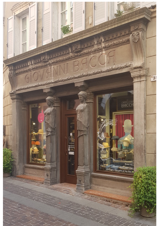
Figura 08. Cappelleria Giovanni Bacca. Cariátides en cemento de Fortunato Depero (1910).

El 26 de diciembre de 1769 Wolfgang Amadeus Mozart (1756-1791) dio en San Marcos su primer concierto italiano. Asimismo, en Don Giovanni (1787), hace referencia a Isera, localidad cercana a Rovereto, por su “excelente marzimino”, variedad de vino de la región probablemente en recuerdo de su estancia en la ciudad (Berselli, 2020, p. 19). Una placa en la casa en la que se alojó en la casa de la via Mercerie 14 así como la Asociación Italiana Musical que lleva su nombre recuerdan el evento en la ciudad.