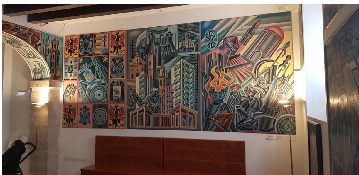
Figura 02. Sala Rovereto. Pietre antiche e moderne (1957), Vampa Eroica (1957) y Generosità sconfinata (1957). Casa d'Arte Futurista Depero, Rovereto. (SUSTITUIR)