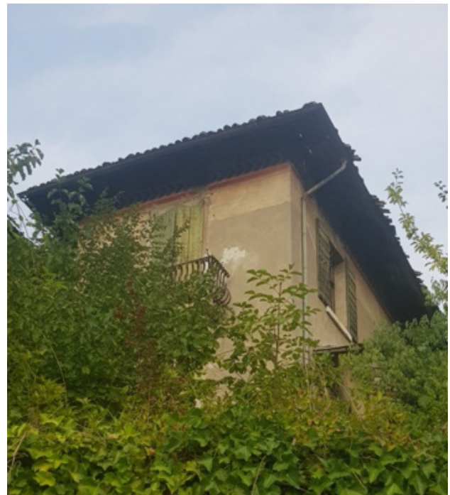
Figura 11. Casa del matrimonio Depero en viale Dei Colli 38.

Al igual que sucede con la prodigiosa obra de Fortunato Depero, los espacios y lugares vinculados al artista se multiplican más allá de los institucionalizados. La ciudad y sus alrededores contienen muchos más espacios vinculados a su vida y obra. Probablemente el más importante sea el inmueble de viale Dei Colli 38, que fue la vivienda y estudio en el que más tiempo vivió el matrimonio Depero. Ubicada entre la ciudad y el valle del Terragnolo, actualmente la casa se encuentra muy deteriorada ya que está abandonada desde hace años y su estructura además fue dañada por un incendio en 2012. La idea del ayuntamiento es rehabilitarla, pero hasta la fecha no hay un programa establecido. Lo que es cierto es que el recorrido vinculado a la casa de Via dei Colli nos traslada la idea de la comunión de la vivienda con el entorno que el artista destacó en todas sus propuestas artísticas.