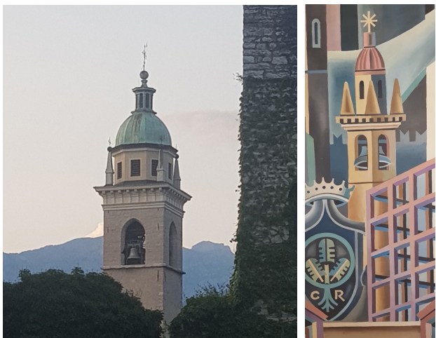
Figura 04. Iglesia de san Marcos (S. XV). Rovereto.