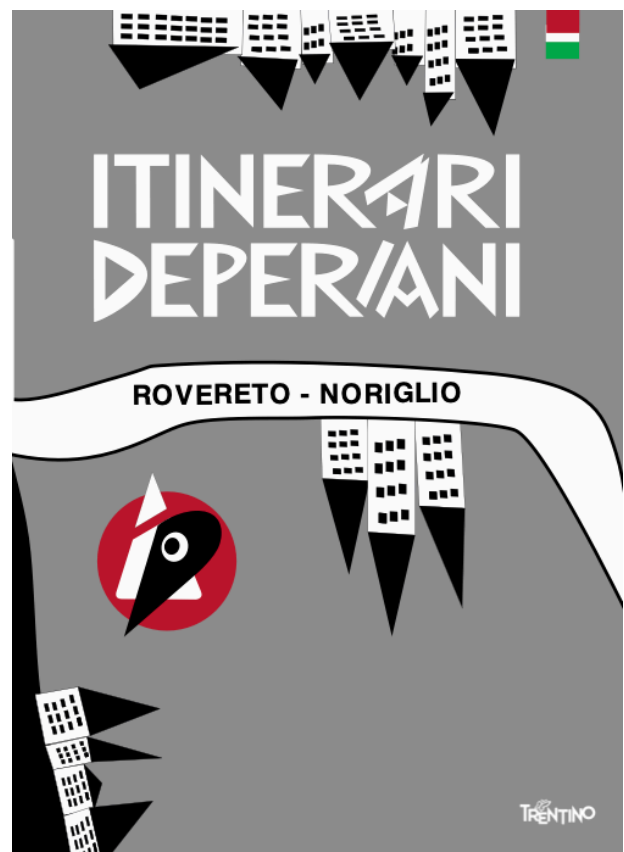
Figura 15. Cubierta del folleto Itinerari deperiani. Trentino Cultura (2018).

El hecho de vivir a entre las dos guerras mundiales hizo que los conflictos bélicos dejaran una huella profunda en la ciudad a partir de los monumentos que se erigieron y que se