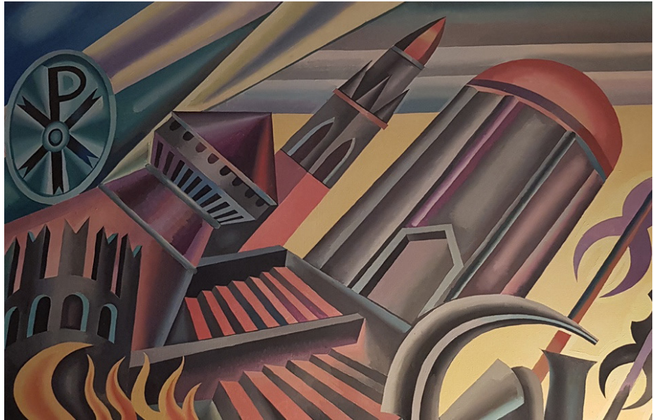
Figura 12. Sacratio Militare di Castel y bastión del Castello de Rovereto (Detalle). Vampe eroiche (1957).