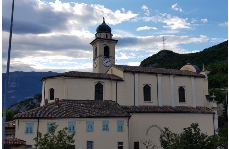
Figura 10. Iglesia de San Martín (s. XVIII) Noriglio, Rovereto.