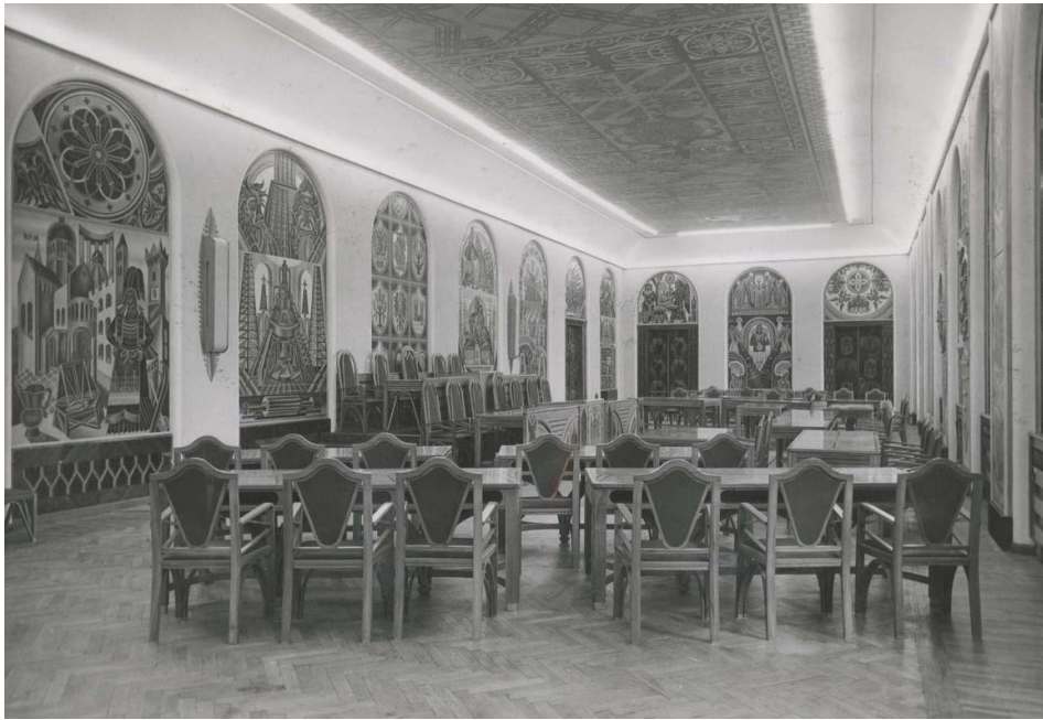
Figura 14. Sala del Consiglio del Palazzo della Provincia Autonoma de Trento (1953-1956).

proyecto inicial y este solo fue admitido tras las presiones que Marinetti ejerció el ministro del ramo Galeazzo Ciano (1903-1943) y la Sala del Consiglio del Palazzo della Provincia Autonoma de Trento, bautizada actualmente como Sala Depero es otra obra emblemática de su madurez en la que está inscrita gran parte de la iconografía y la mayoría de los lugares citados a lo largo de este estudio.