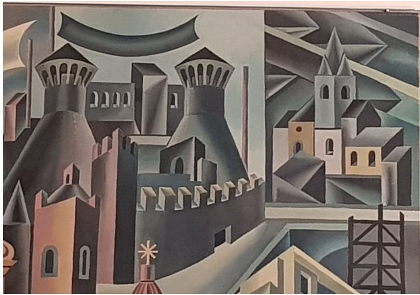
Figura 02. Castello di Rovereto (s. XIV) y Museo Storico della Guerra (1921).