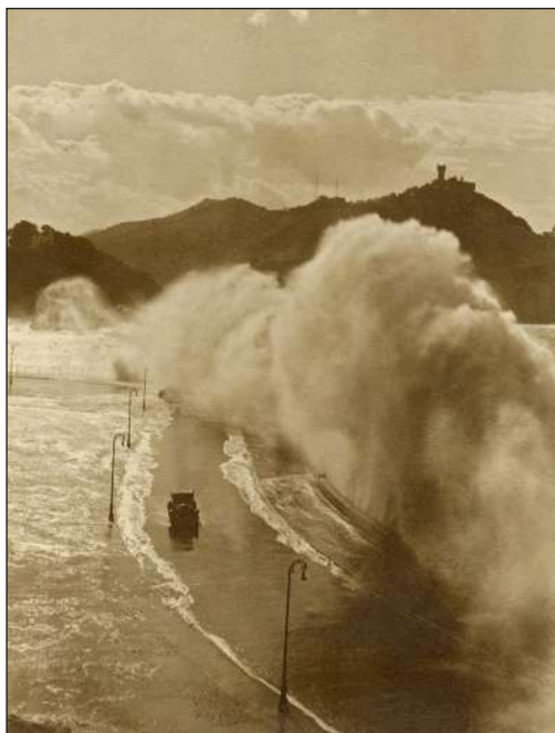
Gregorio González Galarza. Olas en el paseo Nuevo donostiarra, década de 1920.