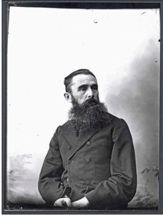
Retrato del fotógrafo Ladislas Konarzewski.

universal de París de 1855 4 . La primera fotografía que se conoce de Pasaia está realizada en 1858 por este autor, que se instaló en la década de 1850 en Baigneres de Bigorre, una población cercana a Pau. Siguiendo la tradición de pintores, dibujantes y grabadores románticos, se dedicó a fotografiar motivos sobre todo pirenaicos.