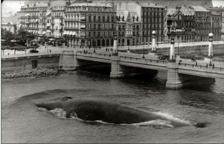
Pascual Marín. Fotomontaje de una ballena en el río Urumea en Donostia, década de 1960.

de Ondarroa en las cercanías de Pasaia en 1892. La fotografía fue tomada por el pintor y fotógrafo aficionado Rogelio Gordon 10 .