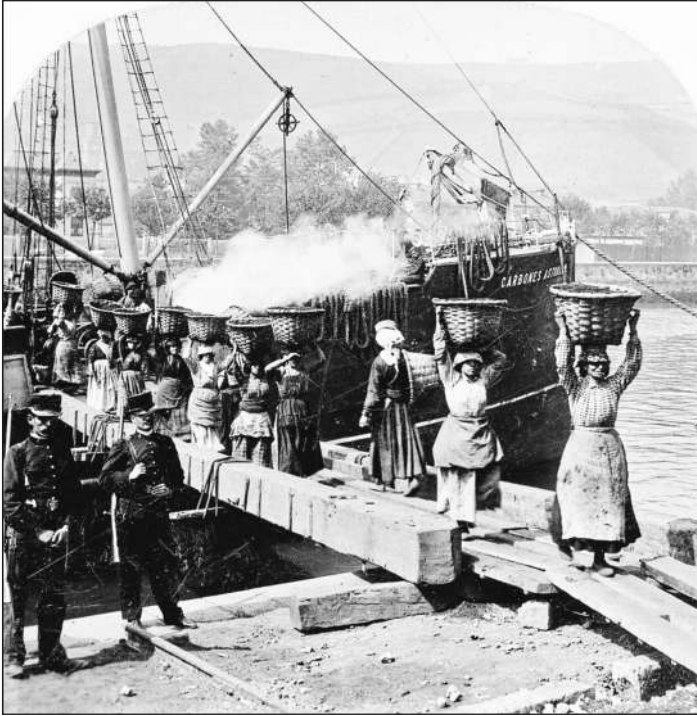
Mujeres descargando carbón en el puerto de Bilbao, 1908.