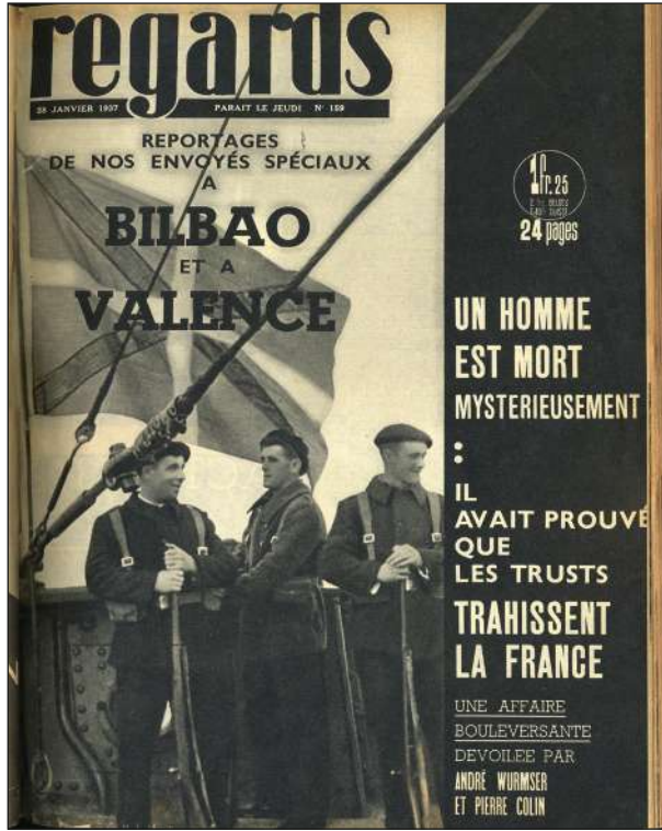
Portada de la revista Regards con una fotografía de David Seymour, 28 de enero de 1937. Colección particular.

nías del ayuntamiento de París en 1950 por encargo de la revista Life para un reportaje. Está considerada un icono de la fotografía del siglo xx y una de las más reproducidas en todo tipo de soportes impresos.