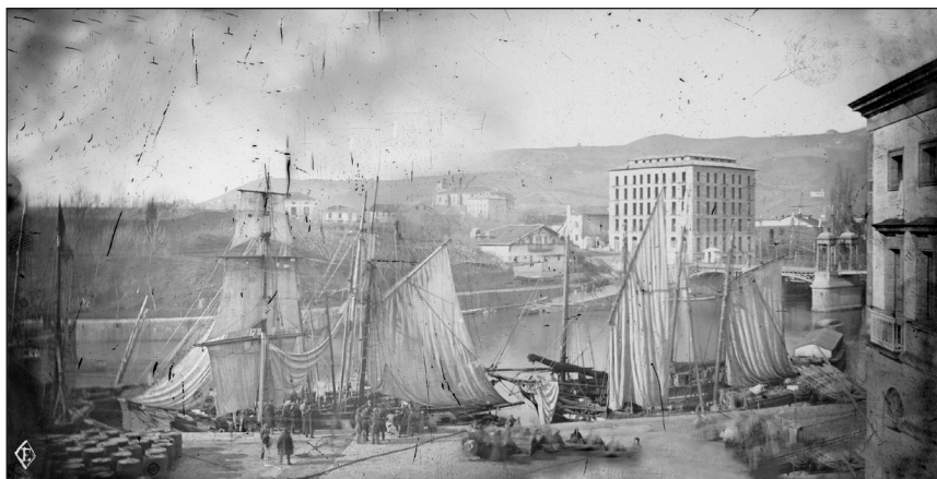
Pedro Telesforo Errazquin. Muelle del Arriaga en Bilbao, 1859. Euskal Museoa, Bilbao.

y sale del golfo, la mujer se queda en el golfo y pasa a todos aquéllos a los que un negocio o un interés les conducen allí 5 .