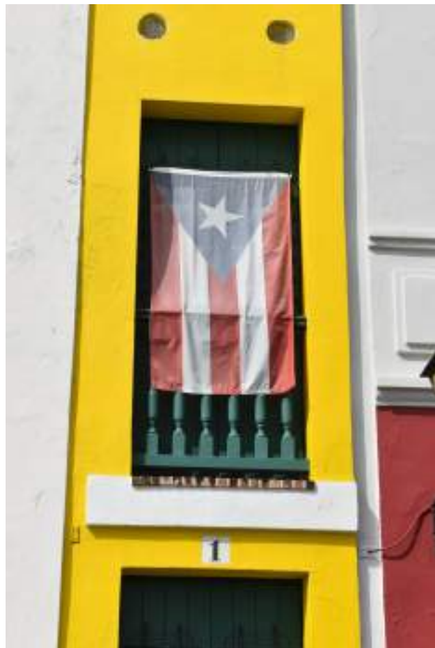
Balcón de la Casa Amarilla, el edificio más diminuto del Viejo San Juan.