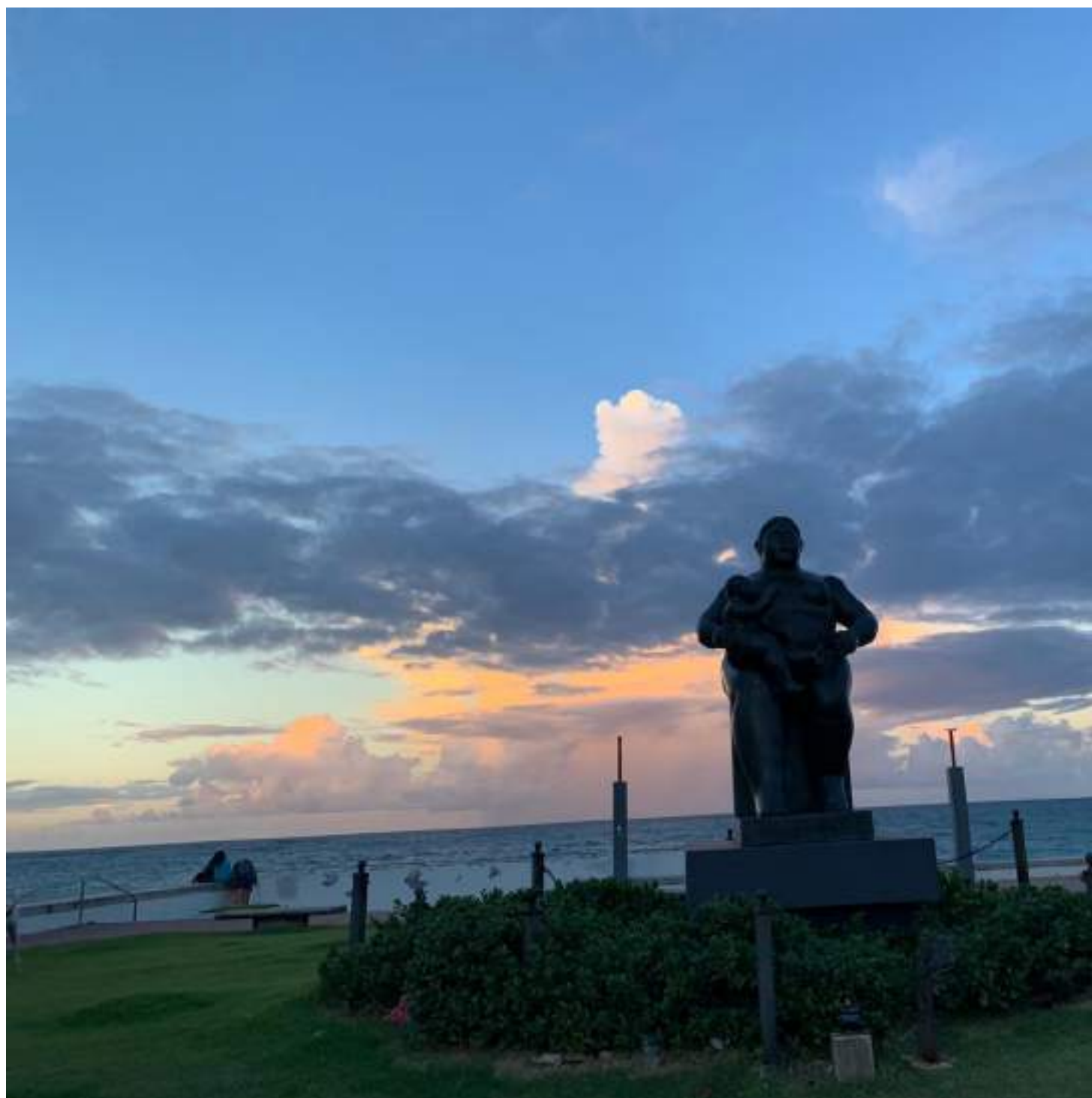
Mujer con hijo, escultura de bronce de Fernando Botero, en el Parque del Ancla o Mirador del Condado (avenida Ashford, Condado, San Juan).