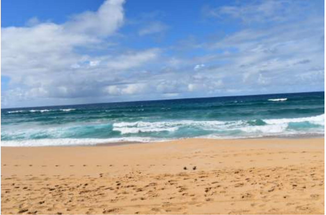
Playa de Condado, en San Juan.