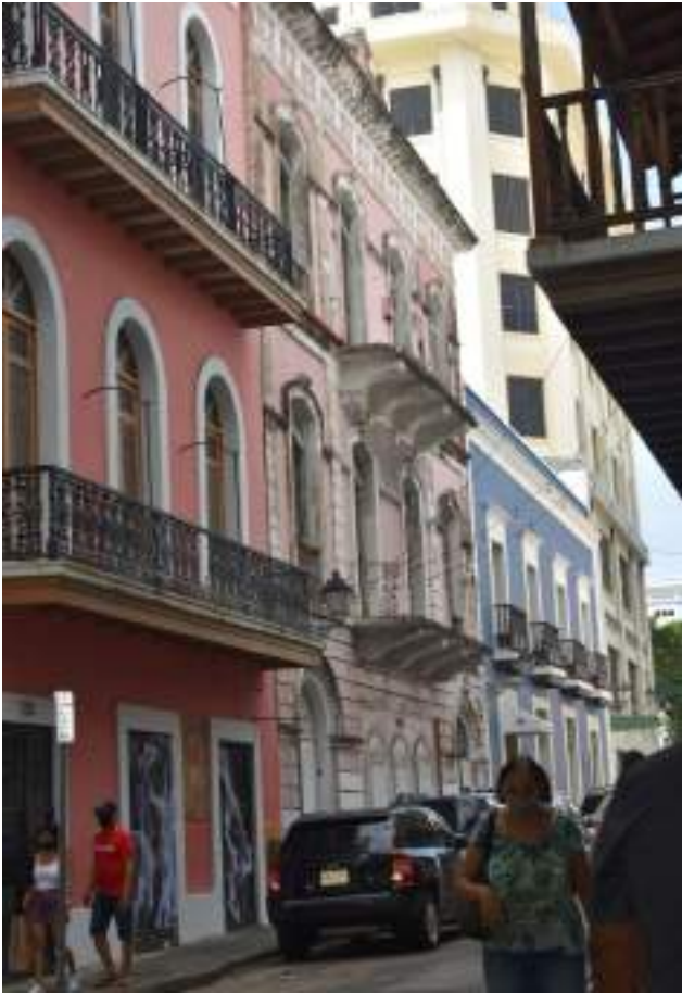
Los balcones son característicos del Viejo San Juan.