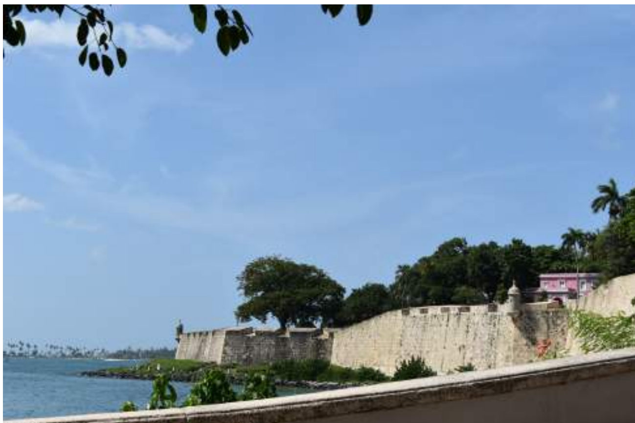
Parte de las murallas que cubren el Viejo San Juan junto a la bahía de San Juan, por donde entraban los dignatarios.