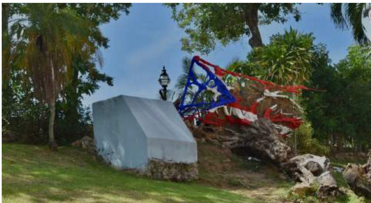
La bandera de Puerto Rico.