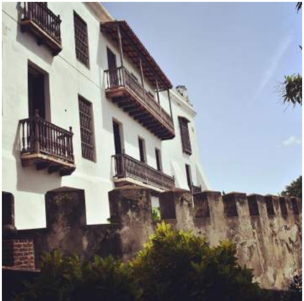
Balcones tras las murallas del Viejo San Juan.