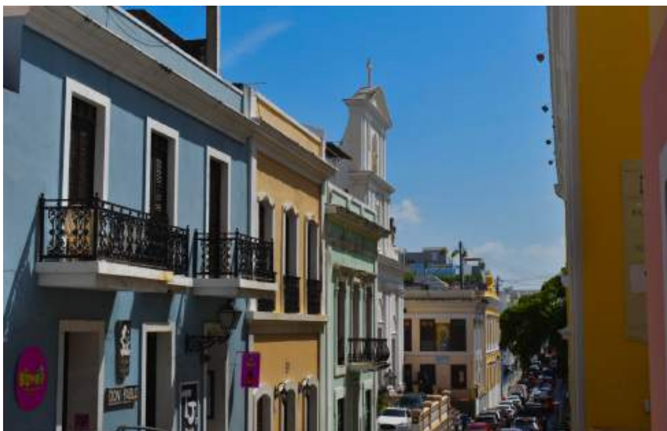
Vista de la calle San Sebastián.