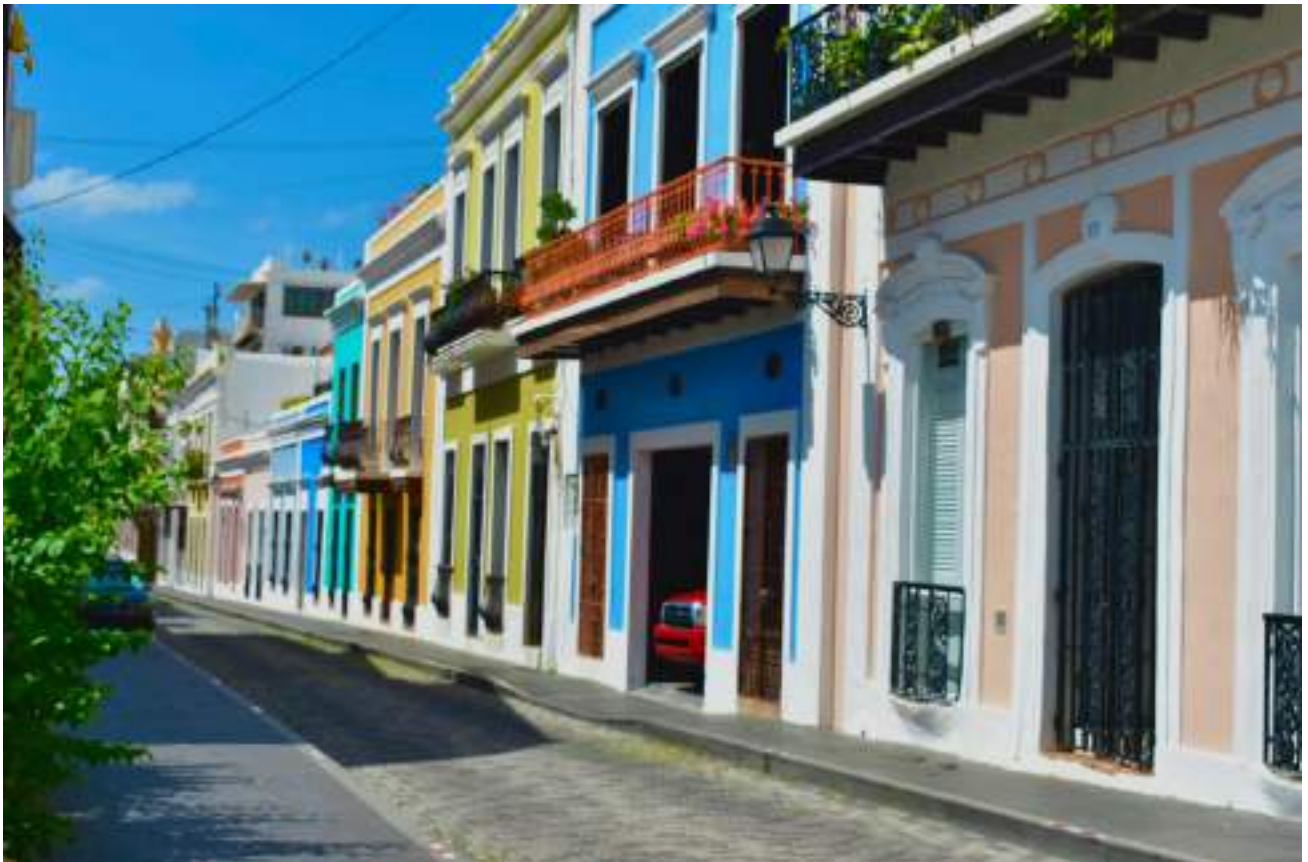
Calle de San Sebastián, en el Viejo San Juan. Aquí se celebran las Fiestas de la calle de San Sebastián, un festival mundialmente reconocido.