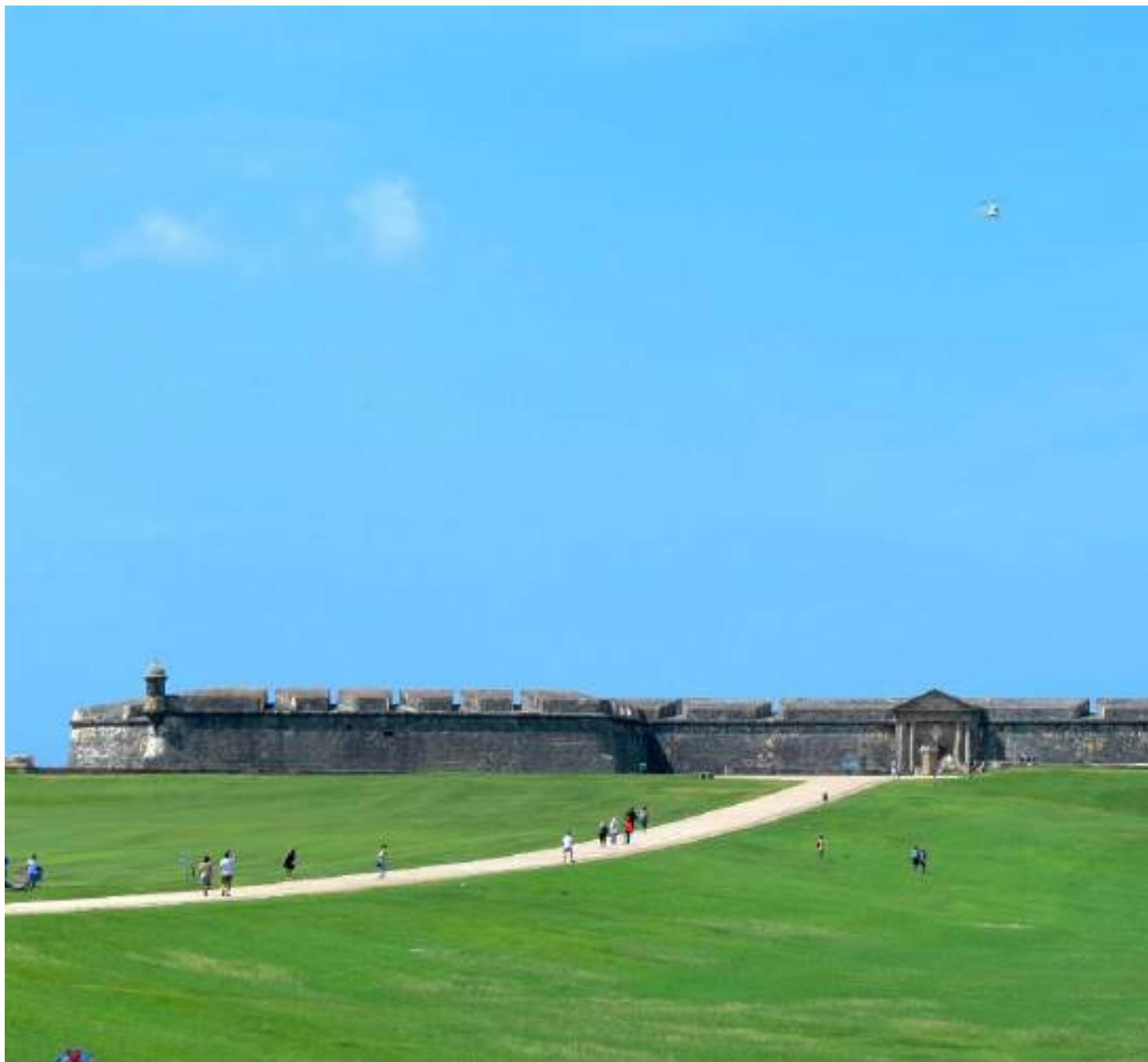
El Castillo de San Felipe del Morro, también conocido como el Morro. Ciudadela española construida entre los siglos XVI y XVIII en el área norte de San Juan. Sirvió para vigilar la entrada a la bahía de San Juan y protegió la ciudad de ataques marítimos.