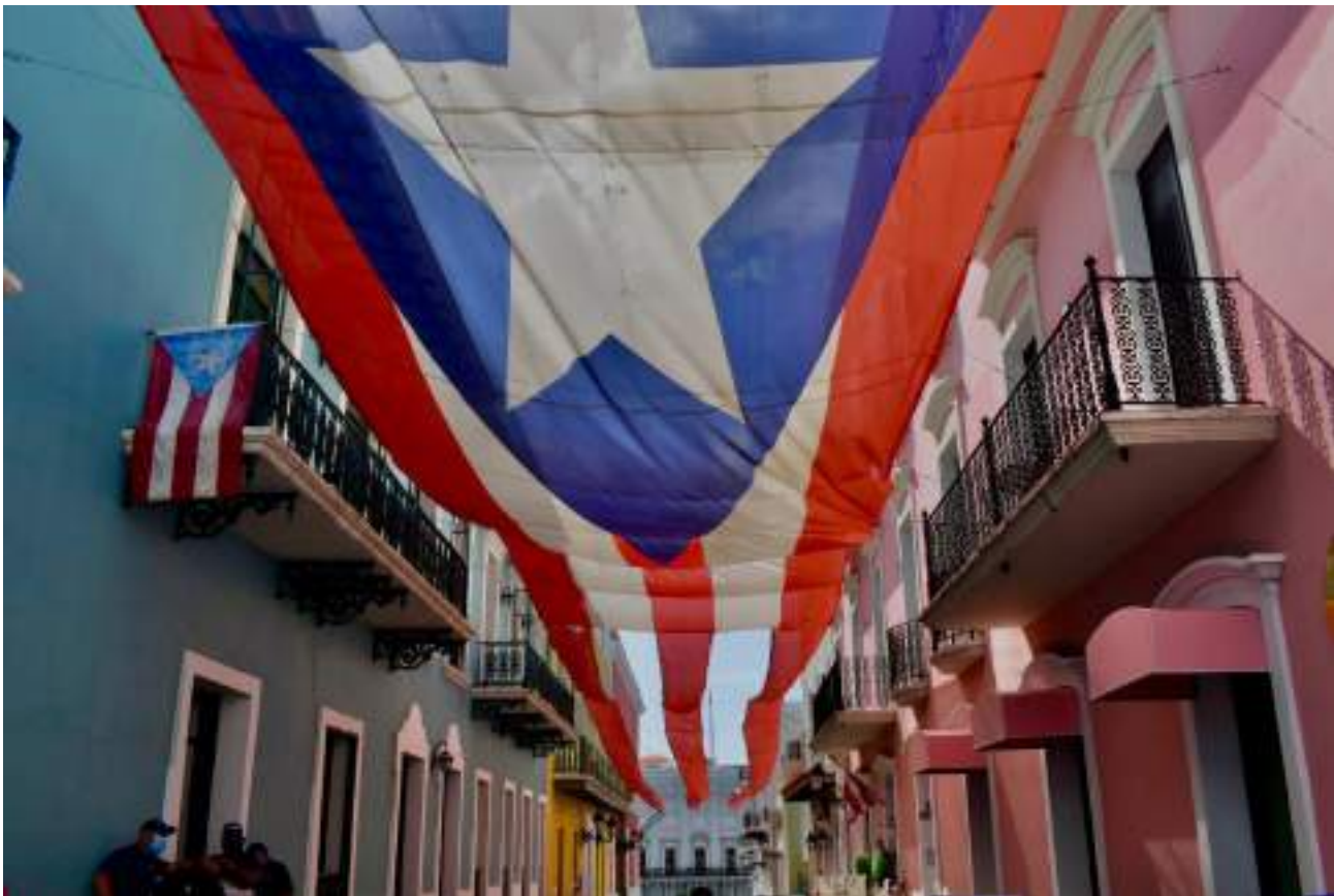
Bandera de Puerto Rico en la calle de Fortaleza. Al fondo se encuentra la Fortaleza, que ha servido como residencia oficial del gobernador de turno en la isla y es la mansión ejecutiva más antigua de uso ininterrumpido en las Américas.