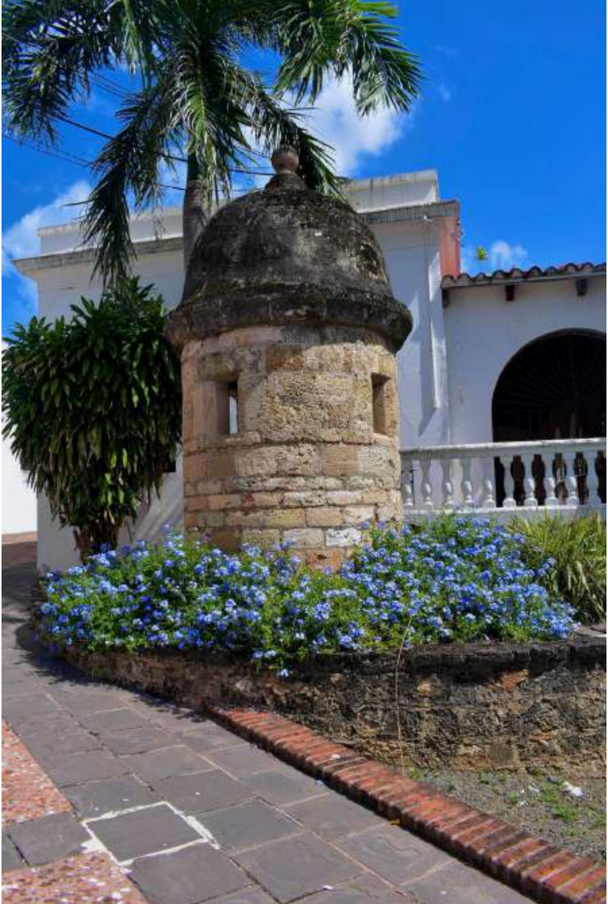
Garita típica en los alrededores del Viejo San Juan, que en tiempos fue utilizada por los vigilantes de la ciudad de San Juan.