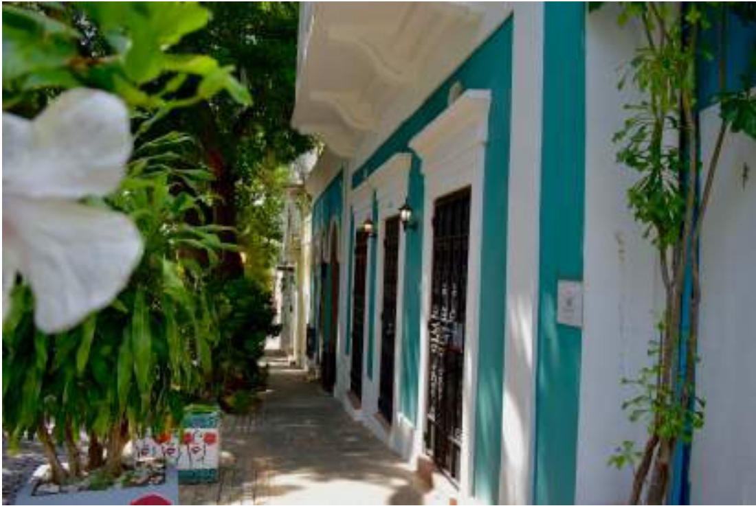
Entrada al museo Casa Blanca, que antes era el hogar de los gobernantes de la isla.