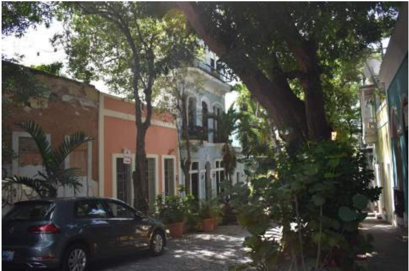
Una de las pintorescas calles del Viejo San Juan.