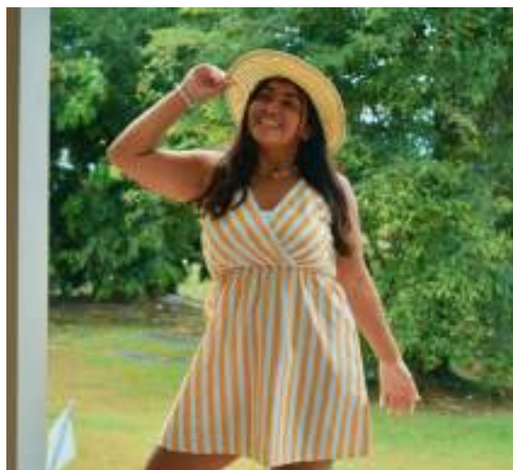
Andrea Marie Rodríguez es autora de este reportaje.

El amor por la fotografía de Andrea Marie Rodríguez comenzó el año 2019. Su admiración del entorno ambiental, social y cultural la ha llevado a capturar no solo monumentos históricos y esculturas, sino también la diversidad natural que los rodea. De norte a sur y de este a oeste, se observa una gama de intensos colores en los paisajes que la Isla del Encanto regala. Desde majestuosas playas hasta bosques lluviosos y desiertos capturan el ojo, que así se puede plasmar en arte.