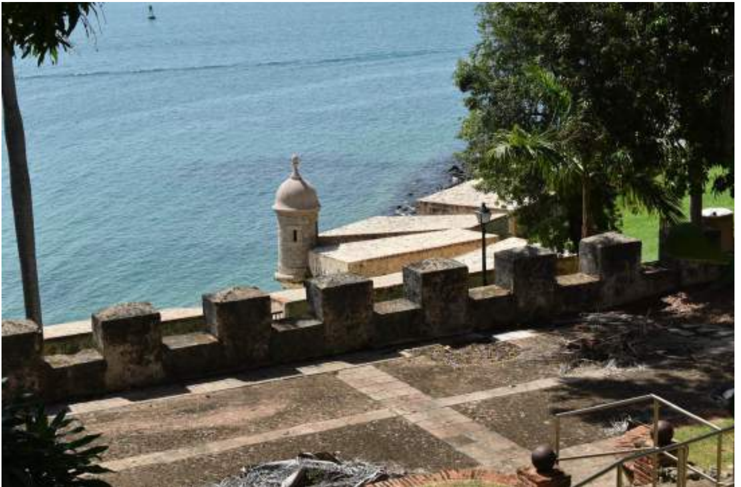
Uno de los patios de Casa Blanca y entrada desde la bahía de San Juan.