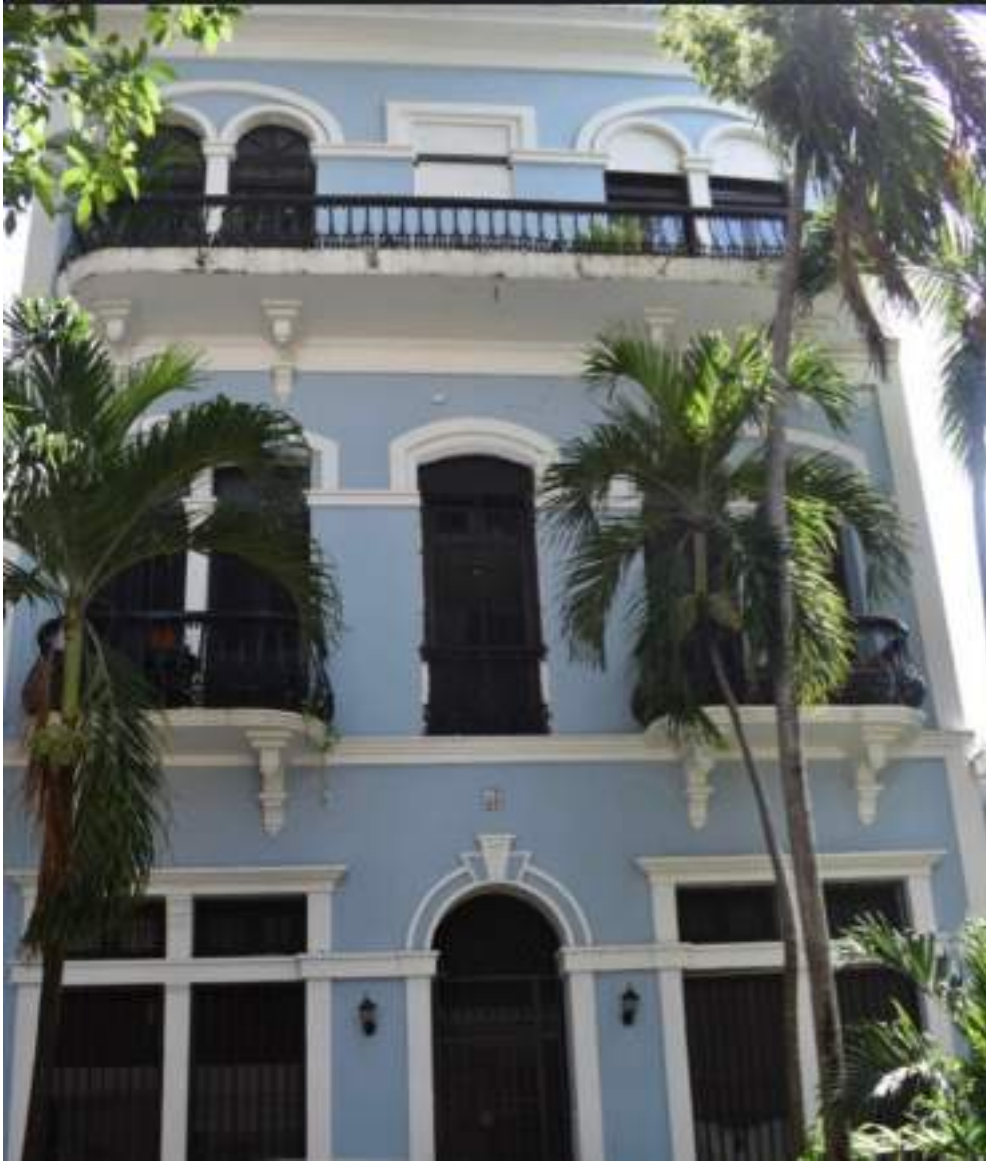
Una de las estructuras que muestra la fachada española, cerca de Casa Blanca.