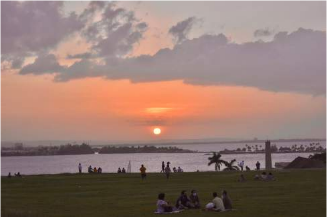
Una de las actividades favoritas de los puertorriqueños es ver el atardecer en el patio del Castillo del Morro.