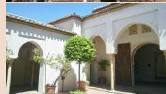
Vista exterior y un patio del Palacio de la Alcazaba.

– Calle de los Álamos , núm. 25. Entre 1740 y 1747, la familia pasó a residir en la calle de los Álamos con los mismos moradores. Tras la muerte de la abuela