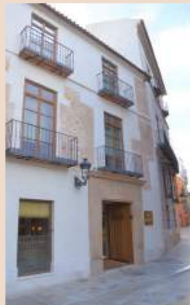
Calle de Granada, 59, antes (arriba,) y ahora (abajo).