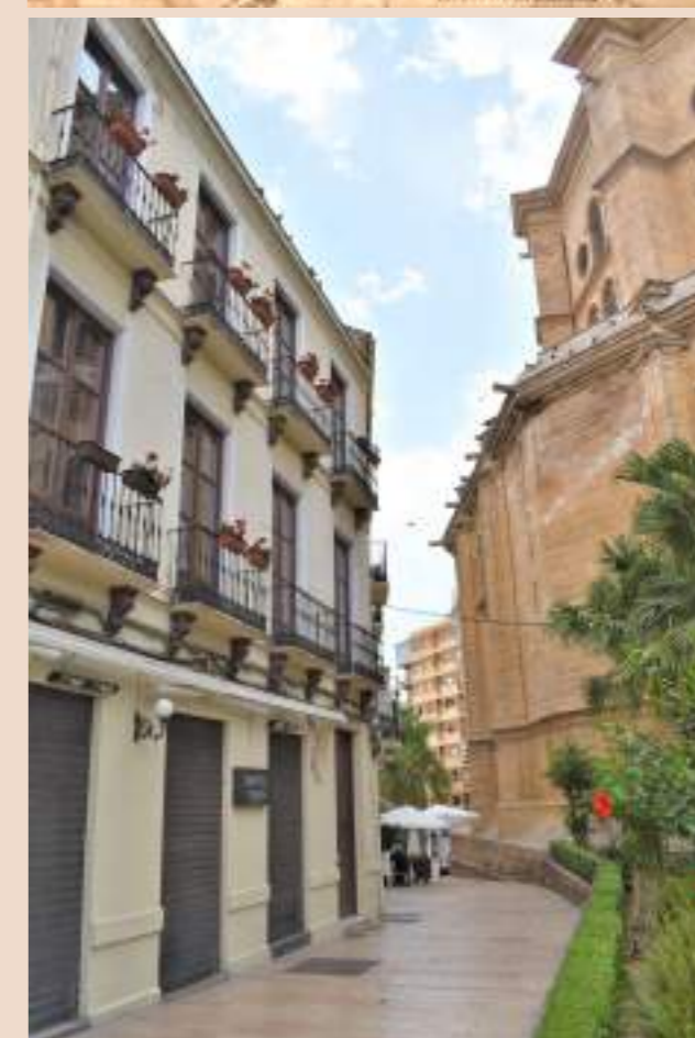
Arriba, la calle Cañón en 1791 según el plano de Carrión de Mula (Archivo Municipal de Málaga) y, abajo, esta misma calle en la actualidad.