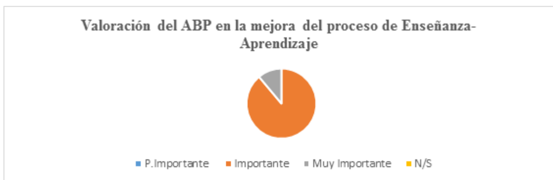
Gráfico 4. Valoración del uso del aprendizaje basado en problemas en la mejora del proceso de enseñanza-aprendizaje.

En lo concerniente al indicador sobre la valoración y uso del aprendizaje basado en problemas en la mejora del proceso de enseñanza-aprendizaje se pudo observar en el gráfico 4 que, 8 lo consideran muy importante, 2 importante y ninguno lo considera poco importante lo que demuestra que se considera muy importante para la mejora del proceso de enseñanza-aprendizaje coincidiendo con el estudio bibliográfico sobre las ventajas que tiene la utilización del aprendizaje basado en problemas para la mejora del proceso de enseñanza-aprendizaje estimulando el trabajo colaborativo, la búsqueda, aprender-aprender y la metacognición.