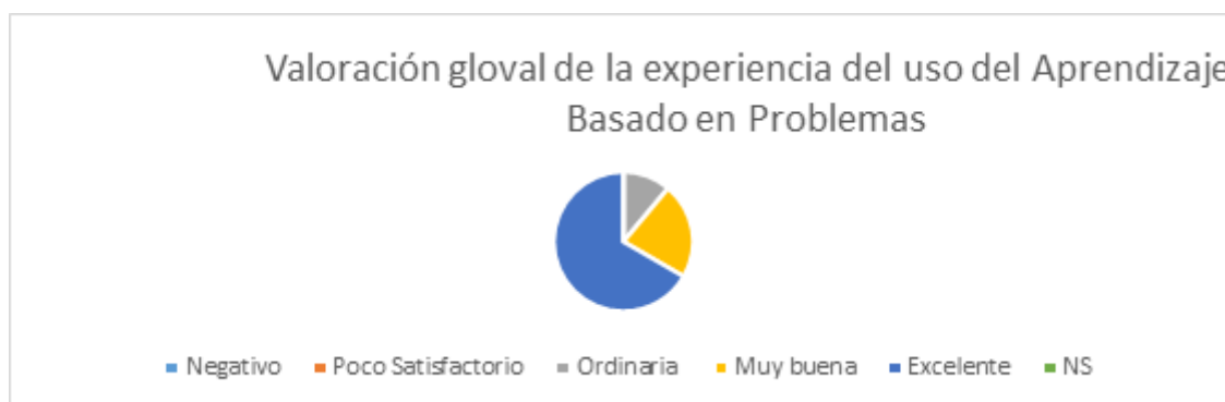
Gráfico 1. Valoración global sobre la experiencia del uso del aprendizaje basado en problemas.

En el gráfico 1, se muestra una valoración global del uso del aprendizaje basado en problemas podemos resaltar que los resultados fueron excelentes, tanto en las impresiones sobre la experiencia como su uso en las diferentes enseñanzas, 5 manifestaron excelente, 3 muy bueno y 1 bueno, reflejando que todos lo consideran de gran importancia teniendo en cuenta que favorece el aprendizaje cooperativo, participativo, autónomo, colaborativo y desarrolla el pensamiento lógico y creativo, indicadores analizados en la valoración de los aspectos que componen la metodología del aprendizaje basado en problemas.