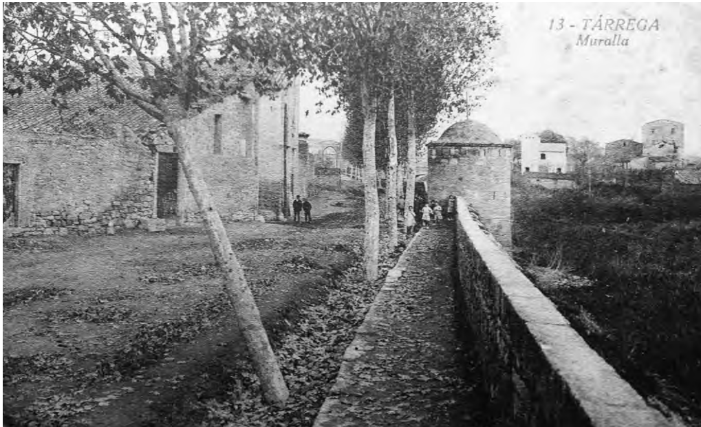
Tram de la muralla del Reguer a principis del segle XX.

Els diumenges en què feia bon temps, al matí i encara més a la tarda, seria habitual passejar en grup pels afores de la vila, tothom mudat i gaudint del paisatge i de la companyia. Aquestes passejades col·lectives estarien protagonitzades sobretot per gent jove, nois i noies, i serien una manera d'establir complicitats i de començar festejos. És probable que els antics targarins fossin bastant classistes en aquesta pràctica: els joves de les bones famílies, més elegants i refinats, anirien en uns grups, els de les famílies humils, amb roba més senzilla i uns comportaments més sorollosos i grollers, anirien en uns altres.