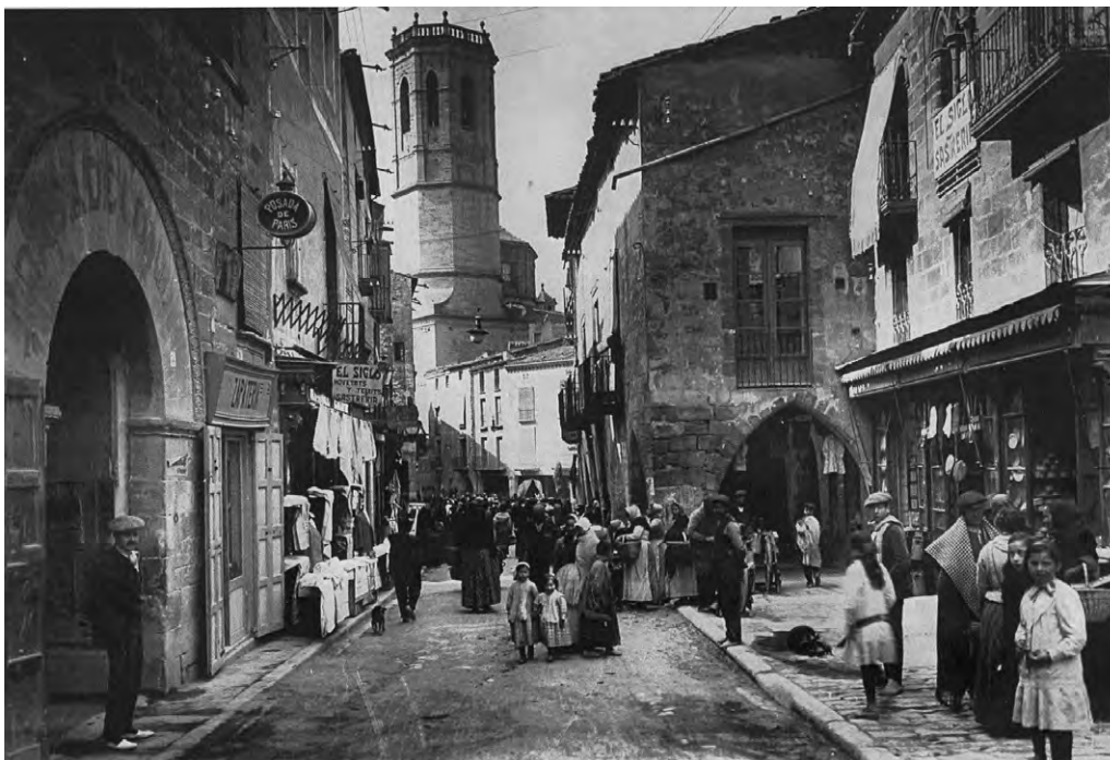
Aspecte del carrer del Carme durant les primeres dècades del segle XX.

Per començar a conèixer la Tàrrega del passat, ens hem de fixar en els seus carrers i cases. Malgrat que es corre el risc de ser massa simplista, es pot parlar de carrers amb predomini