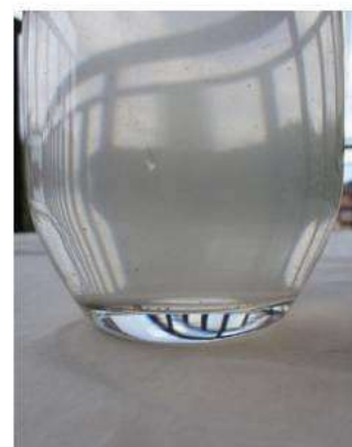
Figura 5. Fotograma 5.

Lo líquido ocupa en su totalidad todo lo que habita, llegando incluso a convertirse en invisible, se trata de una estrategia de supervivencia incluso, camuflado con su entorno. Es una existencia que empapa todo a su alrededor, sin dejar huecos, entrando en cada resquicio del espacio. Afecta en lo personal, nos deja calados, fríos e incluso tiritando. Temblamos. Porque también ocurre que algo más grande que nosotros nos rodea, y cabe la posibilidad de que pertenezcamos a algo mayor que nos nubla.