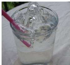
Figura 2. fotograma 2.

El agua es la representación de un modo de estar expansivo, afectado por su estado líquido que no perdona y su afán de ocuparlo todo, su posibilidad de transformación y sus numerosas posibilidades de relación con y en el ecosistema en que se encuentra.