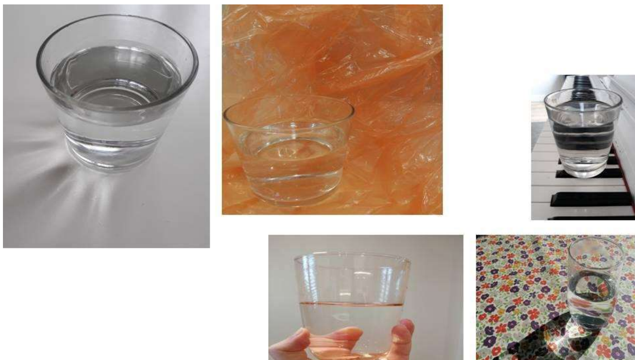
Figura 6. Fotograma 6.

Los rastros de lo húmedo en las paredes del vaso, que no son posibles si el agua no ha pasado por ahí. A veces no sabemos si ese líquido está o no, y hasta puede que no se vea, pero resulta completamente esencial para que lo que vemos suceda.