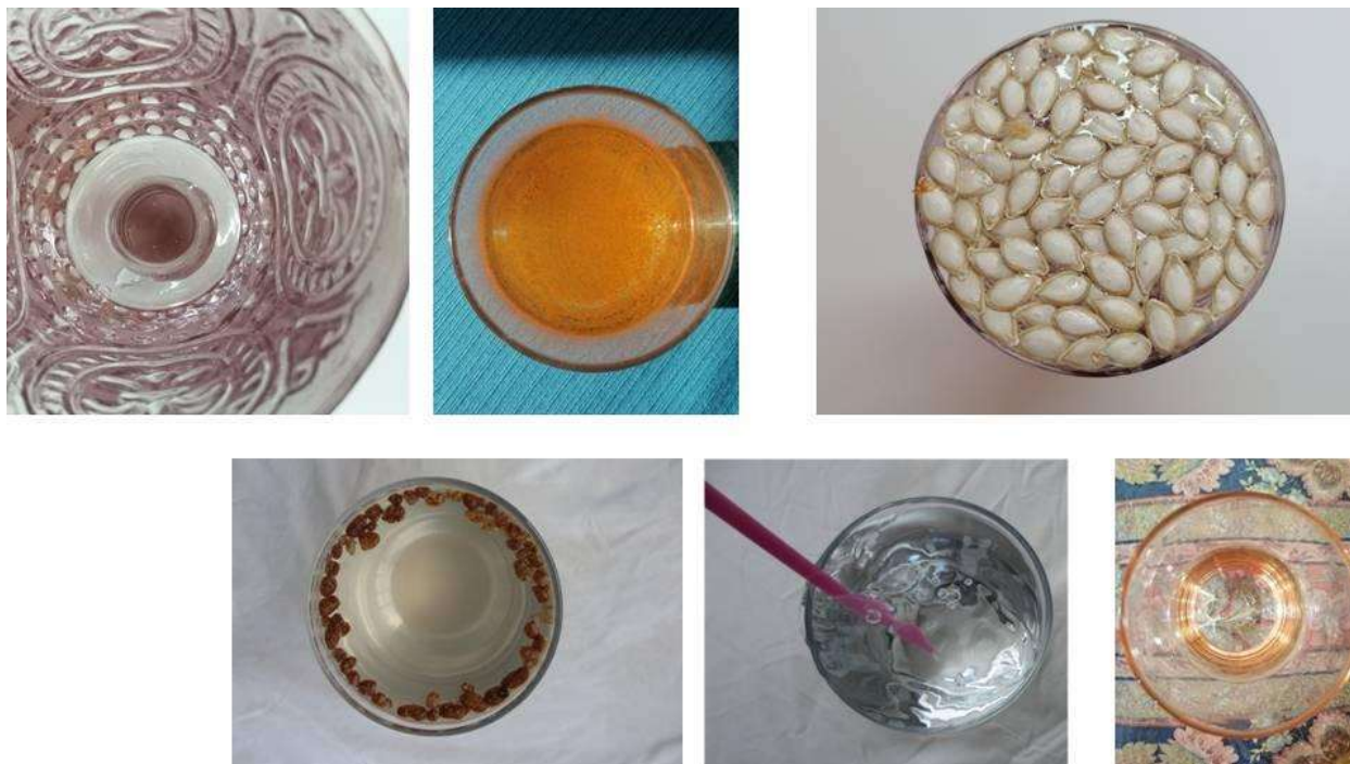
Figura 4. Fotograma 4.

El fondo común cambia, según quién sea la persona que lo habite o según por quién o qué pase la luz. El cómo también influye. ¿Está el espacio ocupado? ¿Cómo hago para pasar desapercibido? y, ¿para llamar la atención? ¿Saben que estoy ahí? ¿Acaso mi transparencia me hace invisible? Si el agua invade todo, ¿somos capaces de ver si lo ocupa todo? La extrañeza necesita una estructura.