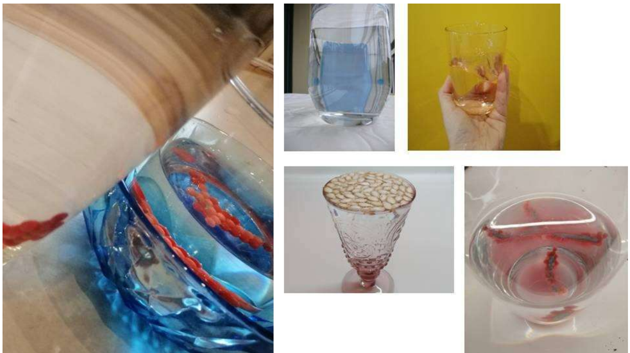
Figura 1. Fotograma 1.

Nuestra reflexión sobre cómo nos relacionamos con y en el espacio nos lleva a preguntarnos cómo nos afecta el espacio y cómo lo concebimos, qué posicionamiento pedagógico adoptamos y qué tipo de relaciones creamos. ¿Qué ocurre desde nuestra práctica docente cuando habitamos un espacio?