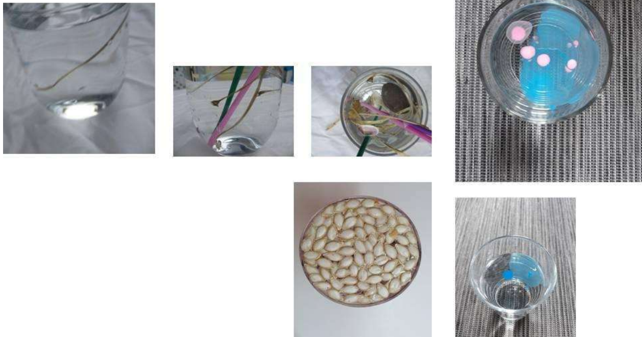
Figura 8. Fotograma 8.

Cuando el estado líquido emerge en un contexto inesperado a veces es visitado por aquello que lo encuentra extraño. Lo mira y valora, a veces amigo, a veces reticente.