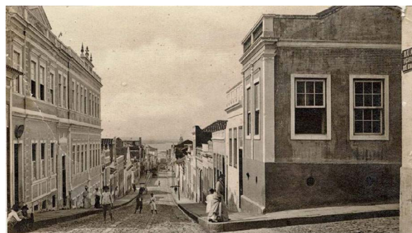
Figura 3 – Rua Vigário José Inácio, década de 1910.