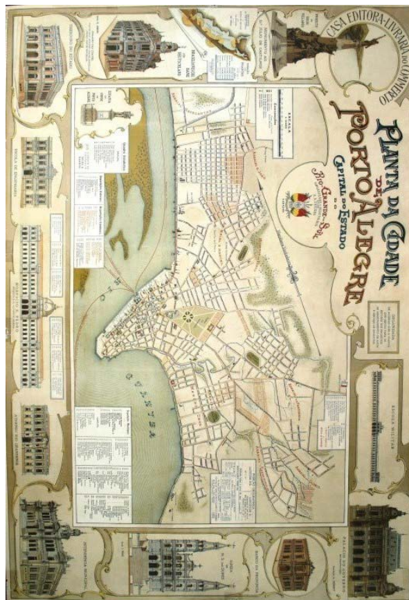
Figura 1 – Planta da cidade de Porto Alegre (1906).