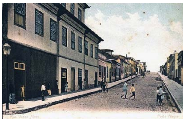
Figura 5 – Rua Vasco Alves, 1910.