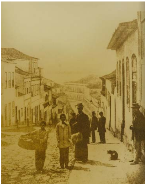
Figura 6 – Rua General Câmara, 1890.

Fonte: Xavier e Bohrer (1890, p. 218-219).