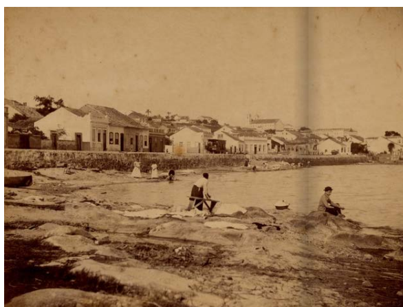
Figura 4 – Praia do Riacho, 1900 (Pantaleão Teles).

Fonte: Adaptado de Xavier e Bohrer (2018, p. 208-209).