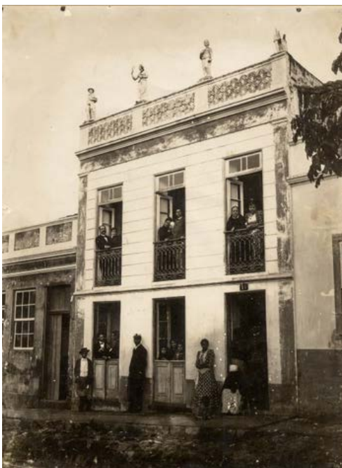
Figura 7 – Rua Riachuelo, 1900.

Fonte: Xavier e Bohrer (1890, p. 218-219).