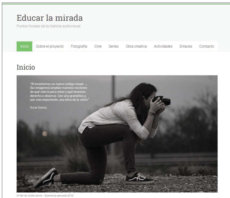
Figura 1: Captura de pantalla de la página de inicio de la publicación en línea Educar la mirada , plataforma de difusión de los resultados obtenidos en distintos proyectos de innovación docente asociados a la asignatura Teoría e historia de los medios audiovisuales

Los cuatro proyectos han puesto el énfasis en la adopción de metodologías participativas de enseñanza/aprendizaje. El primero de ellos, Prácticas de innovación docente para el aprendizaje creativo de la teoría e historia de los medios audiovisuales (2016-17), fue seguido por un segundo proyecto de igual título (2018-19), que amplió el alcance de los resultados obtenidos en el anterior. El tercero de ellos, Collaborative learning of film analysis in transnational and interuniversity environments (2019-20), persiguió dos de los objetivos del Plan Bolonia en el marco del Espacio Europeo de Educación Superior, la internacionalización universitaria y el bilingüismo. Se acometió en colaboración con el alumnado de la BA Film and Media (Japanese Studies Programme) de Birkbeck Collage, University of London 1 . Estos tres proyectos han dado lugar a diversas publicaciones de análisis fotográfico, fílmico y serial, catálogos