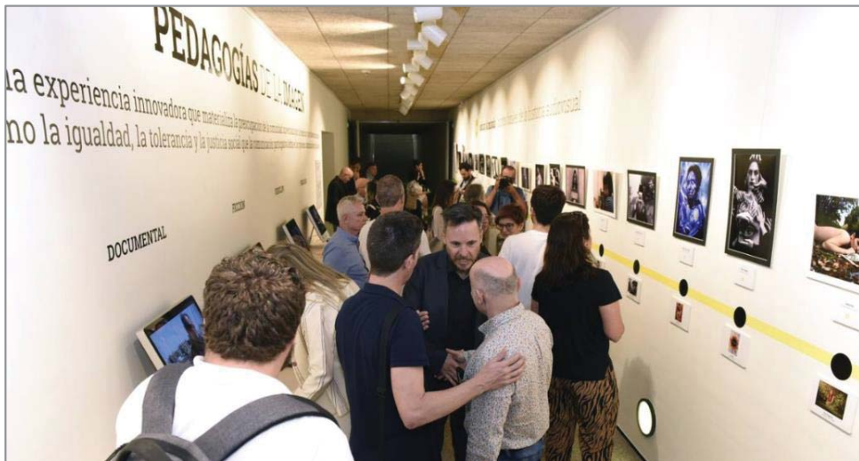
Figura 3: Pedagogías de la imagen , muestra expositiva que inauguró la Sala Isidoro Valcárcel, de la Facultad de Comunicación y Documentación (UMU). Fotografía de Alfonso Durán (AGM) publicada en el diario La Verdad (13/06/2019) y recogida en Educar la mirada

Los alumnos, orientados por la docente, articulan sus proyectos de manera autónoma. Al vincular lecciones magistrales y seminarios con aspectos de corte práctico y creativo, las exposiciones teóricas se vuelven más eficaces para la adquisición de competencias. De acuerdo con el Espacio Europeo de Educación Superior (EEES), la metodología docente sigue los criterios establecidos, al sumar enseñanzas teóricas y prácticas, tutorías y trabajo autónomo del estudiante. El EEES favorece un modelo no basado exclusivamente en el trabajo del profesorado, dado que las metodologías de enseñanza participativas aplicadas en el aula se encaminan a lograr un cuerpo poliédrico de conocimientos, habilidades y actitudes que abogan por la integración de los mencionados contextos académicos (Fernández March, 2006; De Miguel, 2006; Pavié, 2010). Este modo de proceder supone una dinámica que favorece la comunicación, no solo entre alumnos y profesores, sino también entre la institución educativa y el entorno social, puesto que cualquier persona interesada puede apreciar los resultados obtenidos durante el proceso de aprendizaje accediendo a la web Educar la mirada .