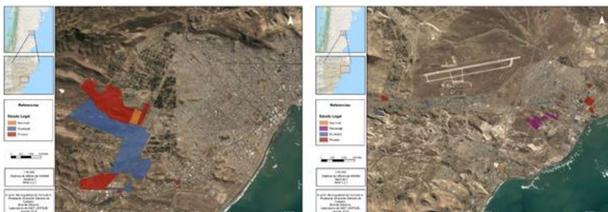
Figura 1: Estado legal de tierra vacante en la ciudad de Comodoro Rivadavia. (Zona Sur derecha- Zona Norte izquierda)