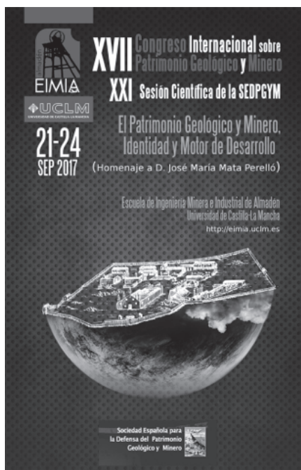
Póster del XVII Congreso Internacional sobre Patrimonio Geológico y Minero, celebrado en Almadén.

Destacábamos la participación en el XVII CONGRESO INTERNACIONAL SOBRE PATRIMONIO GEOLÓGICO Y MINERO y XXI SESIÓN CIENTÍFICA DE LA SEDPGYM, que se celebrada en Almadén de 21 al 24 de septiembre de 2017. Así como el concurso a la CONVOCATORIA DE SUBVENCIONES PARA LA PRO-