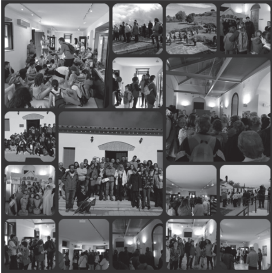
Visitas guiadas durante el 2017.

PENCO VALENZUELA, F., 2010: Cerro Muriano: Sitio Histórico. Minería en Córdoba , ed. Almuzara, 2010.