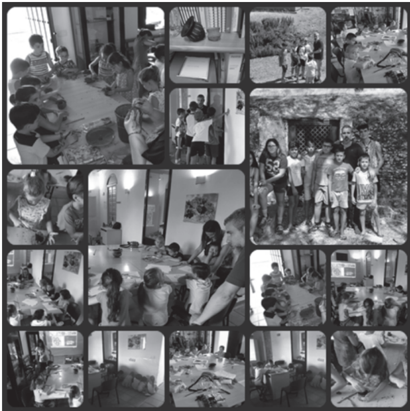
Talleres infantiles de verano, julio de 2017.

Talleres creativos, juegos, senderismo, manualidades, etc. que se desarrollaron durante el mes de julio y fundamentalmente entre colegiales de la localidad.