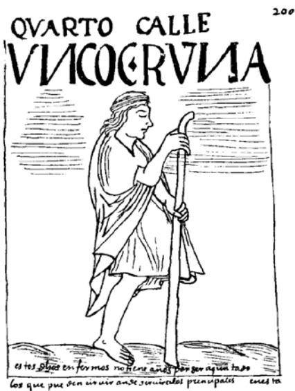
Figura 6. Representación de una persona con una pierna amputada y un ojo cerrado. La inscripción en la parte inferior indica: Estos dichos enfermos no tienen años por ser ajuntado, los que pueden servir ha de servir a los principales