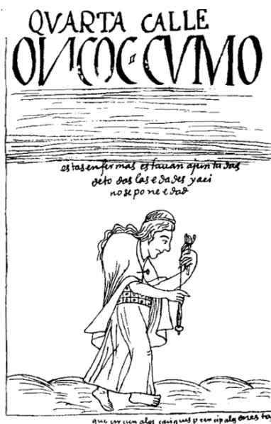
Figura 5. Representación “corcovada” hilando con la inscripción en la parte superior, en la que se indica: Cuarta calle, y más abajo, en el párrafo: estas enfermas estaban ajuntadas de todas las edades y así no se ponen edad