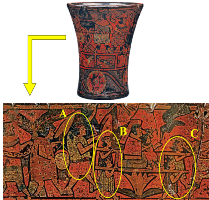
Figura 3. Kero colonial inca con el motivo de la “Cadena de Huáscar”

El individuo A presenta una protuberancia en la espalda y los personajes B y C de pequeño tamaño que sostienen las andas de un personaje importante, posiblemente sean personas con talla baja.