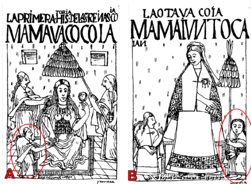
Figura 1. Representaciones de “corcovados” y “enanos” asociados con la primera (A) y octava Coya (B)

Fuente: Guamán Poma de Ayala, 1615/1980, p. 87, 97.