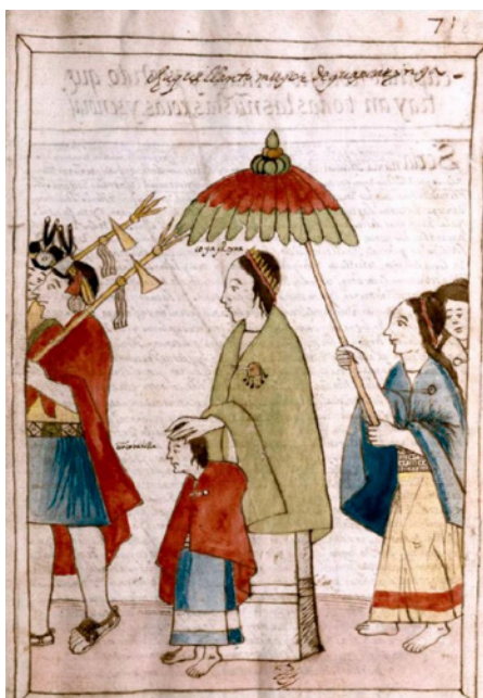
Figura 2. Representación de Martín de Murúa de una “corcobadilla” junto a la Coya Chuquillanto, mujer del inca Guascar

Fuente: Guamán Poma de Ayala, 1615/1980, p. 87, 97.