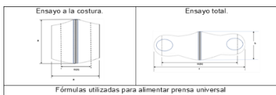
Tabla 1.- Disposición de las probetas en la prensa universal.