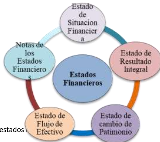
Figura 2 Detalle de los estados financieros

Hay ciertos factores que representan indicios de que se está originando un deterioro, estos pueden ser internos o externos: (a) Indicios internos: evidencia de obsolescencia o daño físico, planes para discontinuar o reestructurar una operación, y, evidencia de reconocimiento económico debajo de los esperados; y, (b) Indicios externos: declinación significativa en los valores de mercado; cambios tecnológico, comerciales, económicos o legales adversos; y, aumento de las tasas de mercado en el periodo.